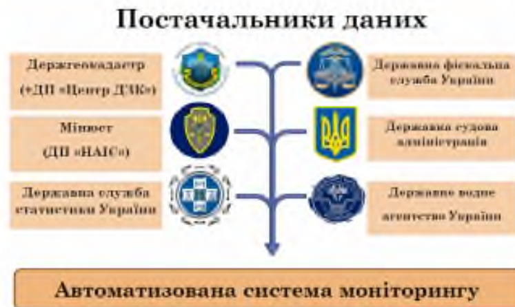
Рисунок 1. Постачальники даних для моніторингу земельних відносин (за даними land.kse.org.ua )

етапи (неофіційний пілотний етап та офіційний пілотний етап). Реалізація пілотного проекту щодо проведення моніторингу земельних відносин для забезпечення прозорості функціонування в Україні дозволить подолати зазначені проблеми. Зазначена система буде забезпечувати органи виконавчої влади та місцевого самоврядування відповідними інформаційно-аналітичними матеріалами щодо розвитку земельних відносин і у кінцевому результаті стане базою для розробки економічного механізму регулювання земельних відносин, як на рівні держави, так і на рівні територіальних громад [3].