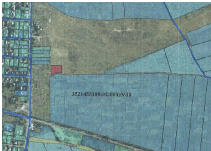
Рисунок 2 "Викопіювання з кадастрової карти (плану), на якому зазначено місце розташування земельної ділянки" суміжних земельних ділянок.

Як результат, проектом передбачено сформувавши та відвести в оренду земельну ділянку площею 0,2000 га (рис. 2).