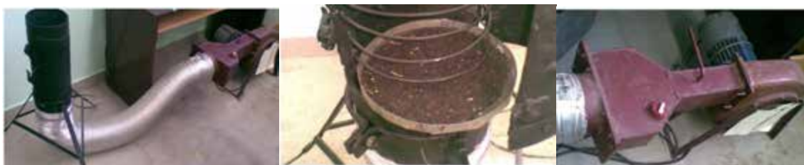
Fig. 1. Installation for studying the drying process of rapeseeds

The setup works as follows: atmospheric air is supplied by a fan to the heater, heated to the temperature set by the regulator and supplied by a flexible connection to the drying chamber, in which numbered cassettes with samples are installed one above the other. The drying agent moves through the cassettes with rapeseed samples installed in the specified sequence from the bottom up, ensuring the implementation of the counter-current method