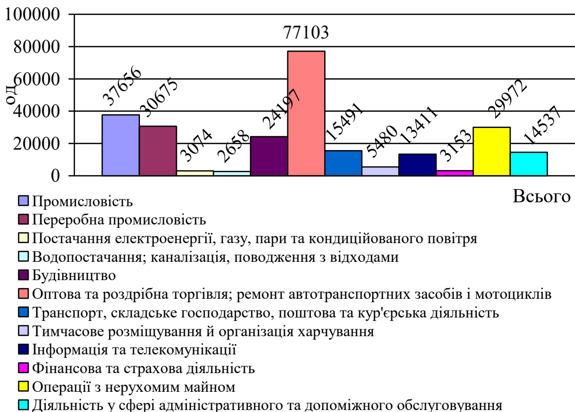
Рис. 2.1. Розподіл за малих суб'єктів господарювання за видами діяльності в 2023 році*

Мале підприємництво є особливим сектором ринкової економіки, який є основою дрібного виробництва та здійснює швидку окупність витрат виробництва, сприяє розширенню межі свободи ринкового вибору, забезпечує насичення ринку товарами, послугами та додатковими робочими місцями, сприяє послабленню монополізму в економіці. Воно визначає ступінь економічної свободи (вільний доступ до інформації, ресурсів, ринків), обсяг сукупного попиту, рівень розвитку ринків, конкуренції, стабільність національної валюти, податкову політику, рівень доходів населення, домінування певної ідеології тощо [24].