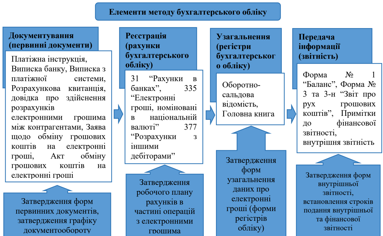
Рис. 2.2. Схема відображення наявності та руху електронних грошей в обліку

достатність і, за потреби, розробити нові форми первинних документів, які підтверджуватимуть здійснення розрахунків електронними грошима у контексті їх руху між учасниками операцій.