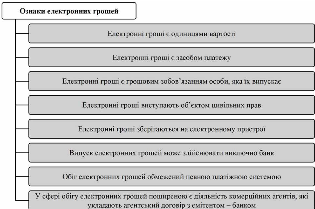
Рис. 1.1. Ознаки електронних грошей

З огляду на проведений аналіз порівняльної характеристики, доцільно визначити ключові ознаки, що притаманні електронним грошам та розкривають їхні особливості як засобу платежу (рис. 1.1).