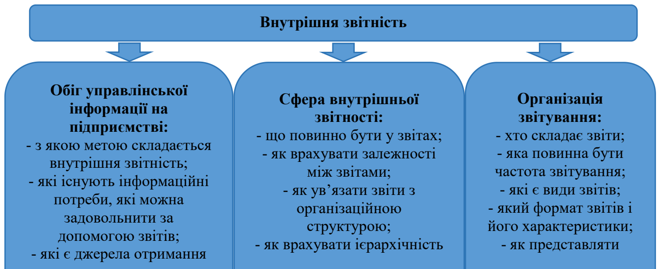
Рис. 2.3. Структура внутрішньої звітності за Б. Ніта [92]

точну, своєчасну та достовірну інформацію для оперативного прийняття управлінських рішень.