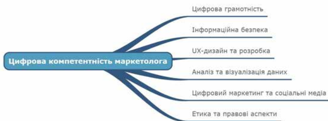
Рис. 1 Структура цифрової компетентності сучасного маркетолога

грамотності; з них 7,7% склали тест Цифрограма на рівень В1, а 90,1% – на на рівні В2, 2,2% – на рівні С1. Аналізуючи отримані результати, Т.Бережна, С. Заєць, С. Шибіріна зробили висновок, що у більшості студентів цифрові компетентності сформовані на середньому рівні [2]. На основі аналізу наукових публікацій, обговорень з професійними маркетологами, а також досвіду роботи зі студентами спеціальності “Маркетинг” визначено такі складові цифрової компетентності сучасних маркетологів: цифрова грамотність, інформаційна безпека, UX-дизайн та розробка, аналіз та візуалізація даних, цифровий маркетинг та соціальні медіа, етика та правові аспекти (рис. 1).