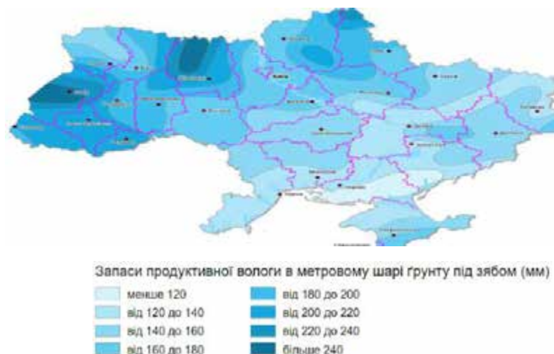
Рис. 2.1 – Запаси продуктивної вологи в шарі ґрунту 0-100 см, 2024 ( https://geomap.land.kiev.ua/climate-9.html )

Основним лімітуючим фактором формування стабільно високих врожаїв є запаси доступної вологи рослинам кукурудзи протягом вегетаційного періоду, зокрема на час сівби кукурудзи (рис. 2.1).