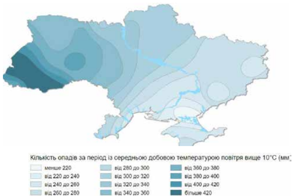
Рис. 2.2 – Кількість опадів за період активної вегетації, 2024 ( https://geomap.land.kiev.ua/climate-9.html )

Кількість опадів істотно обумовлює водний баланс, що потрібно враховувати при виборі строку сівби і норми висіву насіння (рис. 2.2).