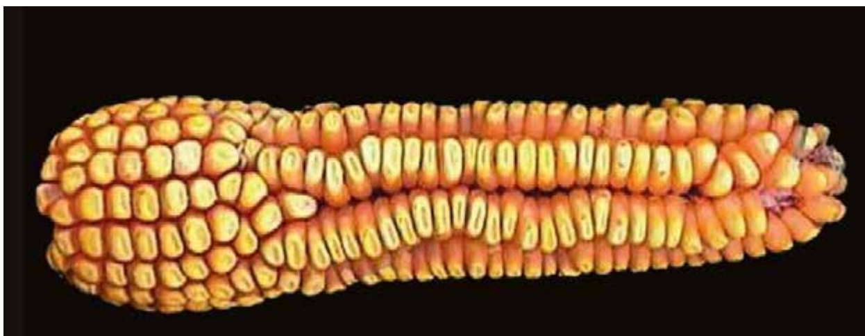
Рис. 1.3. - Скидання рядів качаном внаслідок несвоєчасного застосування гербициду із групи сульфонілсечовин, V10

Гербициди – інгібітори поділу клітин. Наприклад гербициди, що містять сульфонілсечовину, можуть спричиняти значний негативний вплив на формування качана, якщо їх застосовувати несвоєчасно. Для більшості гібридів кукурудзи це відбувається на стадіях V7-V10. Рослина кукурудзи має засвоїти такі гербициди для повної безпеки. Якщо засвоєння відбулося не повністю і достатня кількість діючої речовини гербициду доходить до качана, що формується, може відбутися гальмування розвитку сім'ябруньок, внаслідок чого сім'ябруньки можуть залишитися непарними (рис. 1.3.)