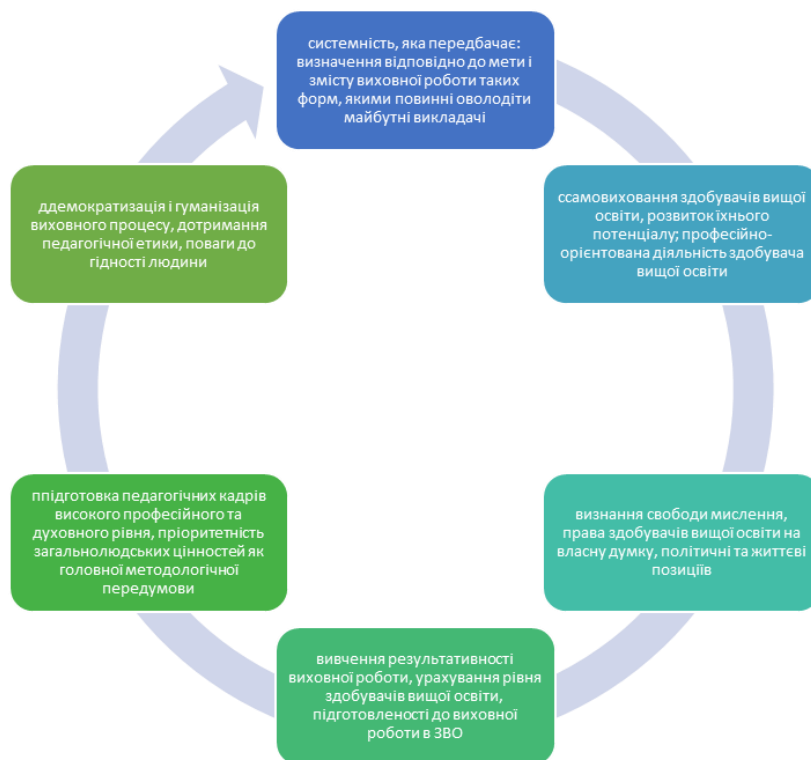
Рисунок 1. Принципи формування національної ідентичності в роботі педагогічного закладу вищої освіти (за М. Михальченко[38])

Формування національних цінностей у здобувачів освіти потребує дотримання певних принципів (рис.1).