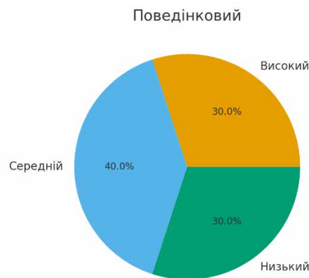
Рисунок 6. Результати діагностування респондентів на предмет сформованості у них національних цінностей за поведінковим критерієм

Висновок: поведінковий компонент є найбільш проблемним — навіть студенти з високим рівнем знань та позитивним ставленням не завжди реалізують їх у практичній діяльності.