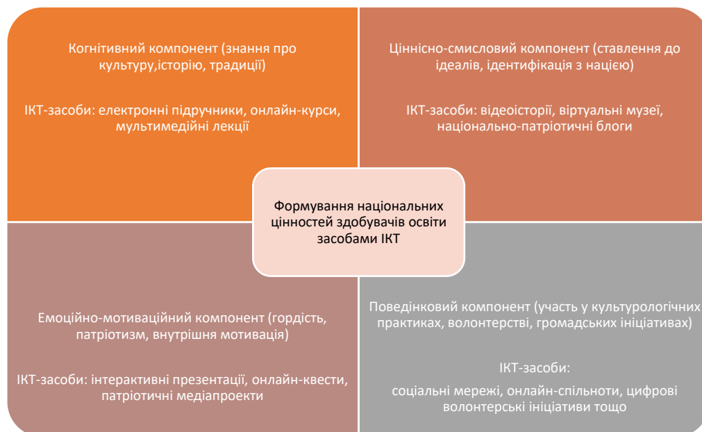
Рисунок 2. Формування національних цінностей здобувачів освіти засобами ІКТ

Взаємозв'язок ІКТ та формування національних цінностей за чотирма ключовими напрямками (компонентами) ілюстровано на рис.2.