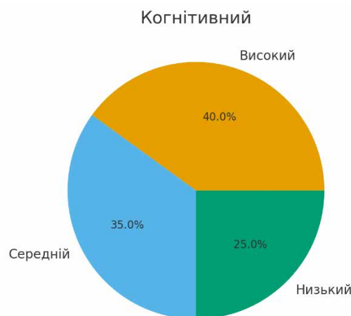
Рисунок 4. Результати діагностування респондентів на предмет сформованості у них національних цінностей за когнітивним критерієм

Висновок: хоча більшість студентів володіє достатнім рівнем знань, існує група, яка потребує системної просвітницької роботи.