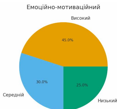
Рисунок 5. Результати діагностування респондентів на предмет сформованості у них національних цінностей за емоційно-мотиваційним критерієм

Висновок: майже половина студентів має високий рівень емоційно-мотиваційної залученості, що свідчить про достатньо сильну базу для виховання громадянської позиції.