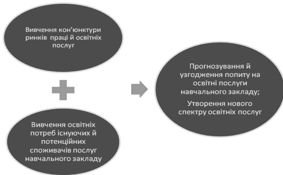
Рисунок 7. – Забезпечення якості надання здоров'язбережувальних освітніх послуг навчальним закладом на основі проведених маркетингових досліджень. Загальна схема маркетингового дослідження була сформульована провідними науковцями, такими як Є. Голубков, Ф. Котлер, О. Панкрухін, З. Рябова. Тому ми включили їх у створення нашої моделі закладу освіти, а саме такі основні етапи:

тенденції ринку як освітніх послуг, так і ринку праці. Саме це являється головним моментом механізмів державного управління проведення маркетингових досліджень щодо визначення стану й формулювання місії здоров'язбережувальної діяльності навчального закладу (рис. 7).