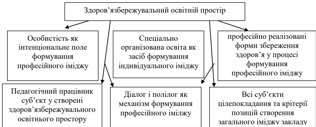
Рисунок 1. – Іміджований діалог-полілог у процесі формування професійного іміджу педагогічних працівників

іміджирований діалог-полілог у процесі формування професійного іміджу педагогічних працівників у здоров'язбережувальному просторі.