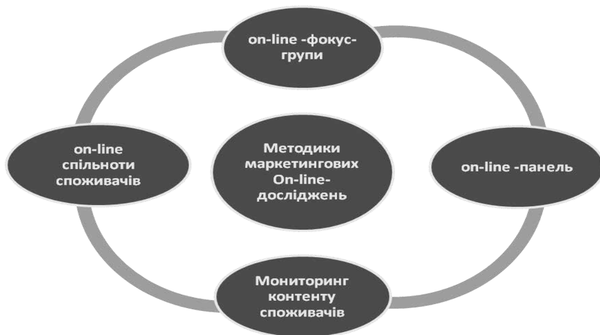
Таблиця 8. – Методики маркетингових On-line-досліджень.

On-line панель – ефективна методика для опитування цільової аудиторії з рівнем проникнення Інтернету понад 50 % населення певної території. Для її впровадження використовуються on-line-сервіси. Цю технологію Інтернет-ресурсів ми використовували для проведення опитування клієнтів, на сайті, шляхом їх обов’язкової реєстрації в дослідженні. On-line спільноти споживачів. Це об’єднання груп та категорій користувачів Інтернету за інтересами, наприклад, групи у соціальних мережах [147; 148]. Механізми в сучасному сьогоденні перебудовуються – посилюється орієнтація на клієнта. Тепер споживач виступає не як пасивний користувач продукту, але і висуває свої вимоги та висловлює свої побажання. Ця робота у взаємодії між обома сторонами максимально ефективна. Технологія здійснювалась через Інтернет-портали. Відбувалось об’єднання учасників, які оцінювали продукцію усіх можливих напрямків, від комп’ютерної техніки до оцінювання якості надання освітніх послуг закладам освіти через утворення таких спільнот. Спільноти були відкриті і закриті. Перші направлені на дослідження громадських думок і орієнтовані на типового споживача. Другі ж, вхід в які регламентований тільки за запрошенням, призначені для більш «вузької» групи користувачів. Це