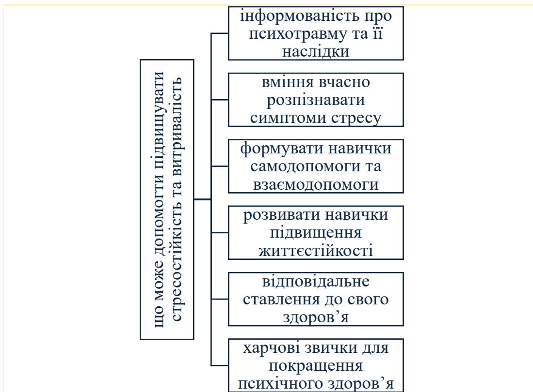
Рис. 2.1. Шляхи розвитку стресостійкості.

Життя у сучасному світі дедалі більше підкорене хронічному стресу. У нескінченних емоційних перегонах мозок перевантажується, організм перебуває у стані постійної напруги, і часто людині здається, що контролювати себе неможливо. Як зазначає дослідниця Міту Стороні, стрес впливає одночасно на нервову, гормональну та імунну системи, порушуючи баланс і призводячи до виснаження. Вона пояснює механізм стресу з позицій нейробіології та підкреслює, що навіть невеликі зміни у способі життя – корекція харчування, фізична активність, робота над емоціями, відновлювальні практики (масаж, сауна) чи навіть певні ігрові методики – можуть поступово підвищувати стресостійкість людини (рис. 2.1).