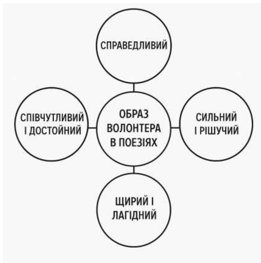
Рис. 3.1 Образ волонтера очима автора