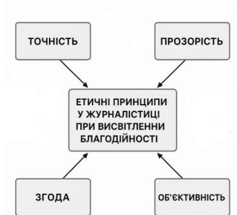
Рис. 1.2 Схема етичних принципів у журналістиці при висвітленні благодійності

— Об'єктивність - висвітлення різних сторін благодійної діяльності, включно з критикою.