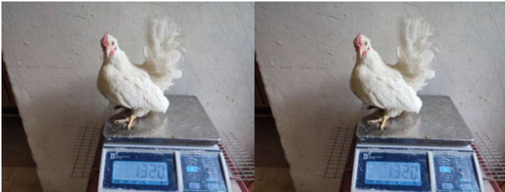
Рис. 3.6. Визначення живої маси курок

Результати досліджень представлено в таблиці 3.3. та на рис. 3.7.