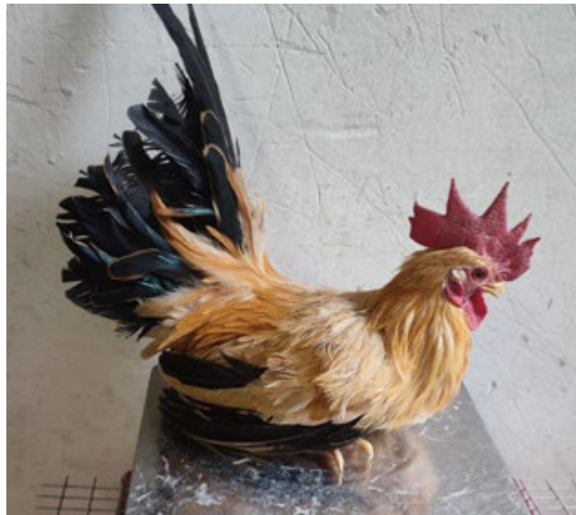
Рис. 3.5. Визначення живої маси півня