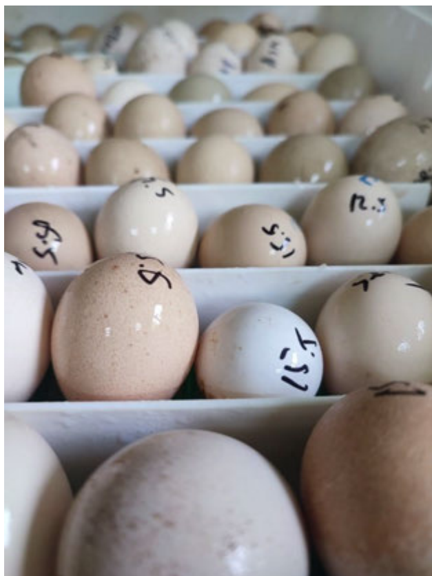
Рис. 2.2. Зовнішній вигляд яєць курей шабо та інших видів птахів

Для визначення маси яєць проводили їх індивідуальне зважування на електронних вагах (рис. 2.3).