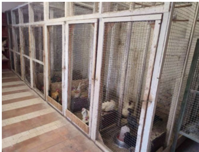
Рис. 3.1. Утримання шабо у внутрішніх вольєрах

Внутрішні вольєри виготовлені з дерев'яного бруска та зварної сітки. Загальний їх розмір – 2х1х2 м. Як підстилка використовується тирса або пісок, залежно від щільності посадки птиці (рис. 3.1).