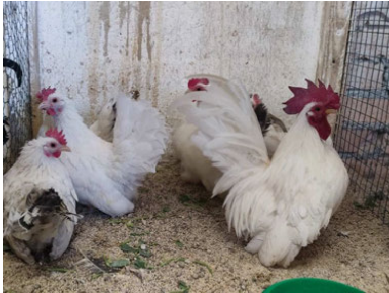
Рис. 2.1. Кури породи шабо з різним забарвленням оперення

У колекції представлені два основні типи цих птахів: європейський – із незначно вигнутим хвостом, подовженим тулубом і невеликою масою тіла (близько 500–800 г), та тайський – з більш об’ємним корпусом, добре вираженим хвостовим оперенням і живою масою 1–1,5 кг. Переважна кількість курей має змішане походження, де домінує генетика тайського типу (від 75 до 98,5%).