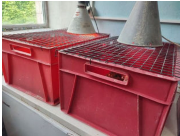
Рис. 3.3. Зовнішній вигляд брудера