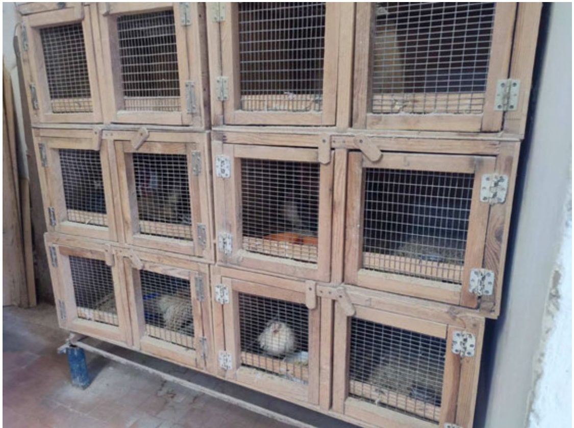
Рис. 3.2. Утримання шабо у клітках

Отже птахи розміщені у вольєрах і клітках, виготовлених з дерев'яних каркасів, обтягнутих зварною сіткою. З метою профілактики зараження курячим кліщем щороку здійснюється обробка конструкцій вапном, а також використовуються препарати, такі як «Arpalit» або «Івермектин». У якості підстилки використовують пісок і тирсу: останню переважно у місцях, де концентрація птахів висока – для кращого вбирання вологи. Пісок застосовується у вольєрах з меншою кількістю особин, бо він швидше забруднюється, але водночас сприяє гігієнічному самоочищенню птиці та постачає мінерали й гастроліти. Через те, що шабо майже не літають, насісти їм не встановлюються. Для відкладання яєць передбачені гніздові ящики з соломою чи сіном або пластикові гнізда для голубів.