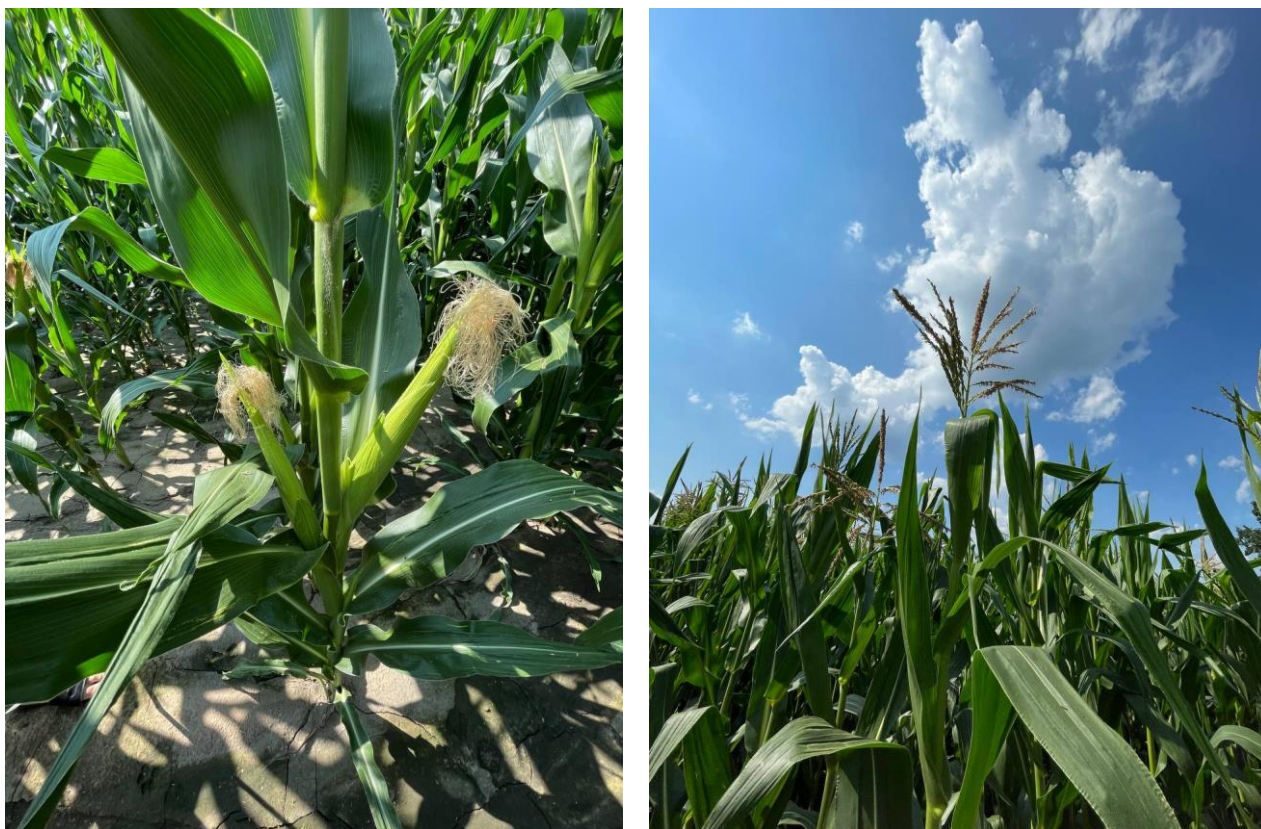
Рис 3.2. Аномальні (з ліва) та типові (з права) ділянки кукурудзи

Для визначення площі листя вибиралися лише типові ділянки з рівномірною густиною стояння, оскільки в окремих випадках просівів змінювалася площа листя окремих рослин в зв'язку з гілкуванням та надлишком поживних речовин (рис. 3.2).