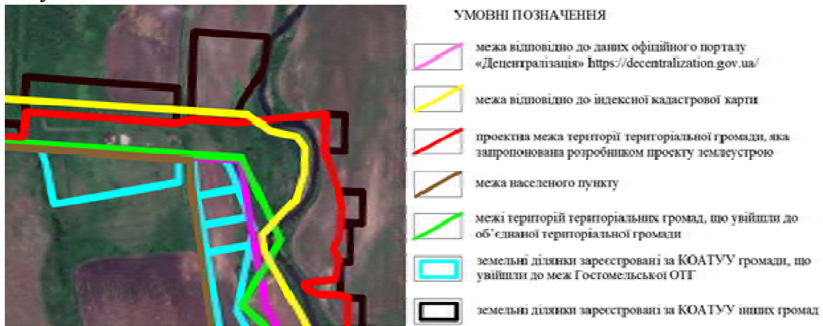
Рисунок 1. Приклади меж, які потрібно враховувати при визначенні межі територіальної громади