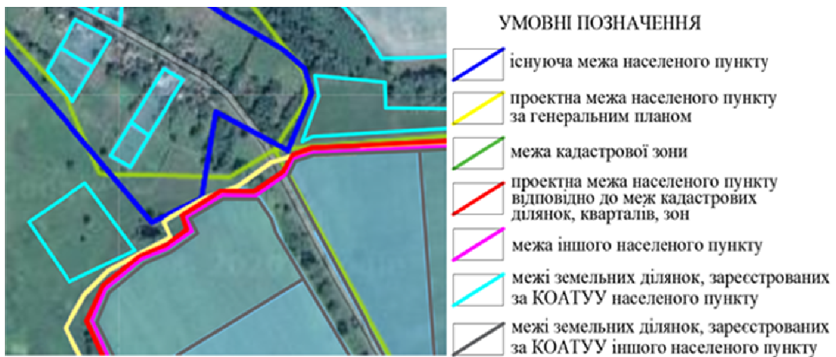
Рисунок 2. Приклад меж, які потрібно враховувати при визначенні межі населеного пункту

Висновки. При складанні документації із землеустрою важливим елементом є організація виконання землепорядних робіт: їх етапність, змістовність наповнення та оформлення текстової і графічної частини. Для кожного виду документації із землеустрою встановлюють комплекс якісних та кількісних показників, параметрів, що регламентують їх розробку та реалізацію.