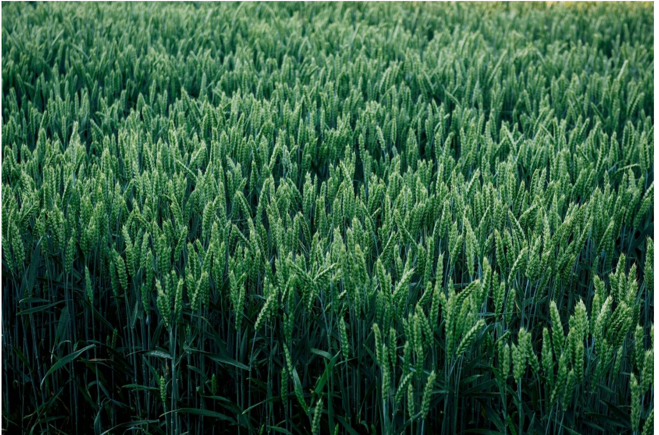
Рис. 5 Пшениця озима сорт Авеню

Ультраранній, напівкарликовий, продовальчий сорт озимої пшениці В-типу (рис. 5). Оптимальний попередник для озимого ріпаку та проміжних культур. Термін сівби 15.09 - 05.10. Обробіток бажано традиційний та висівати на родючих ґрунтах по кращих попередниках.