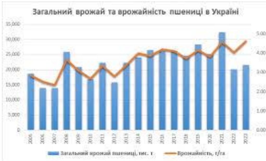
Рис. 2 Загальна врожайність пшениці в Україні.

безповоротно змінила експортний ландшафт України. Чорноморські порти, колись основа зернової торгівлі тепер або заблоковані, або перебувають перед постійною загрозою.