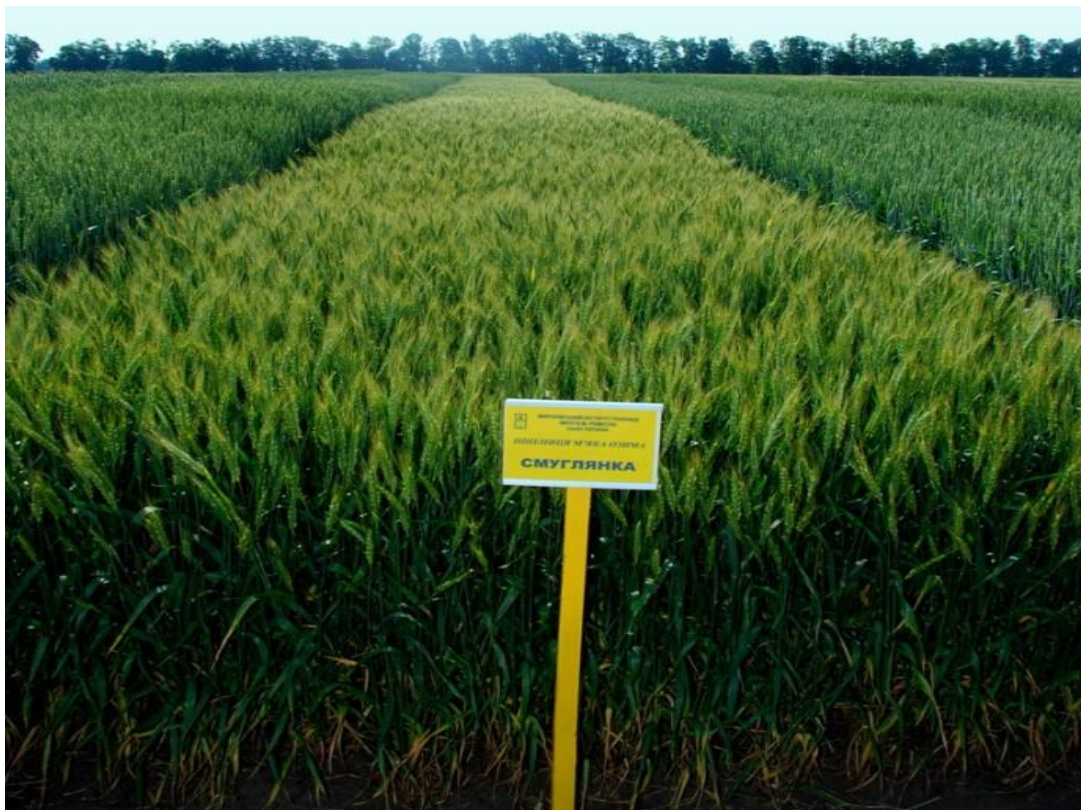
Рис. 4 Пшениця озима сорт Смуглянка

Досліджуваний сорт пшениці озимої - Смуглянка – середньоранній сорт високоінтенсивного типу (рис.4). Різновид еритроспермум. Колос циліндричний, середньої довжини та щільності. Колоскова луска середня, овальна, зубець короткий, загострений, плече округле, середнє.