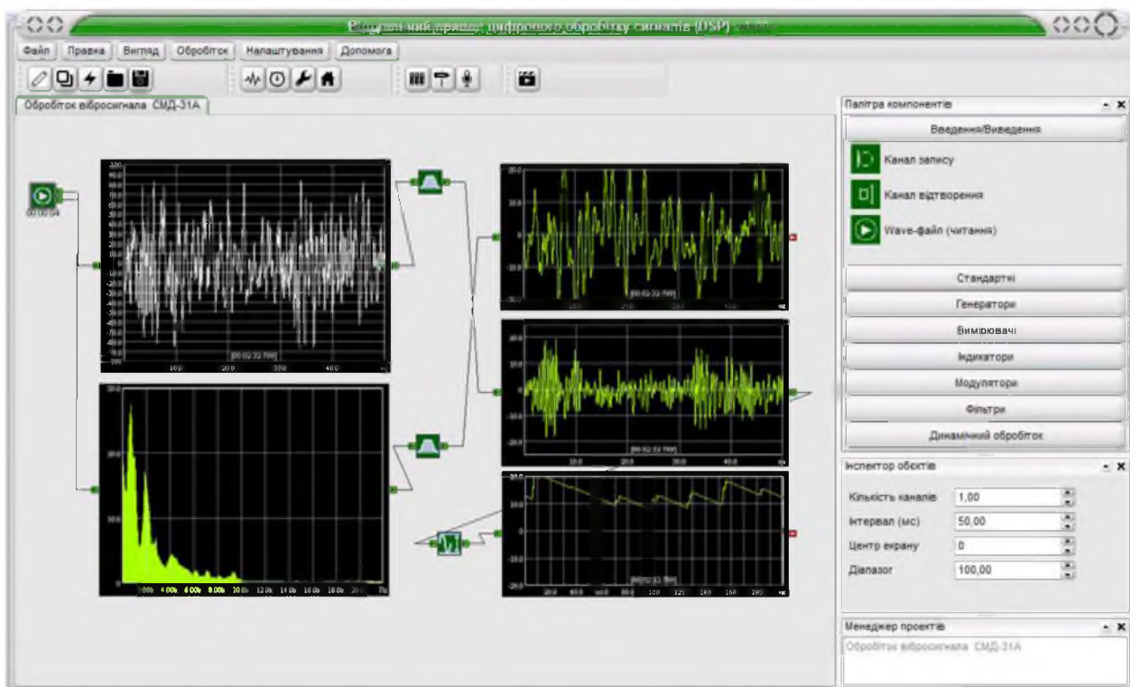
Рис. 1. Головне вікно віртуального приладу ЦОС (DSP).

Віртуальний вимірювальний комплекс створений на основі звукової карти з частотою дискретизації 96 або навіть 192 кГц використовує її як аналого-цифровий (АЦП) і цифро-аналоговий (ЦАП) перетворювачі, дозволяючи оцифрувати аналоговий сигнал і потім якісно його проаналізувати та провести його обробку. На кафедрі технічного сервісу і інженерного менеджменту ім. М.П. Момотенка НУБіП України зроблена спроба розробити такий віртуальний прилад для цифрової обробки сигналів отриманих від звукової плати (рис. 1).