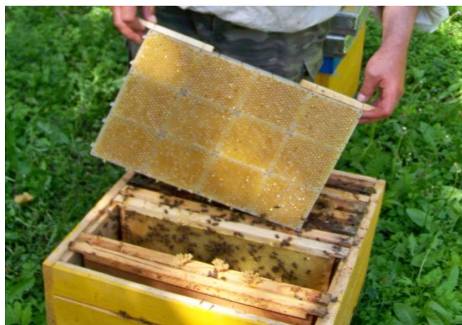
Рис. 2.6. Розміщення штучного стільника із ущільненим обніжжям у гнізді бджолої сім'ї