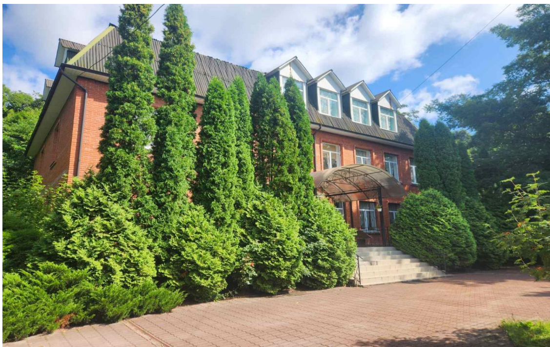
Рис. 2.2. Лабораторний корпус кафедри бджільництва