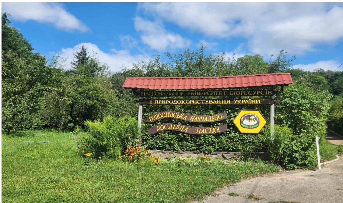
Рис. 2.1. Пасічний точок навчальної лабораторії бджільництва «Голосіївська навчально-дослідна пасіка»