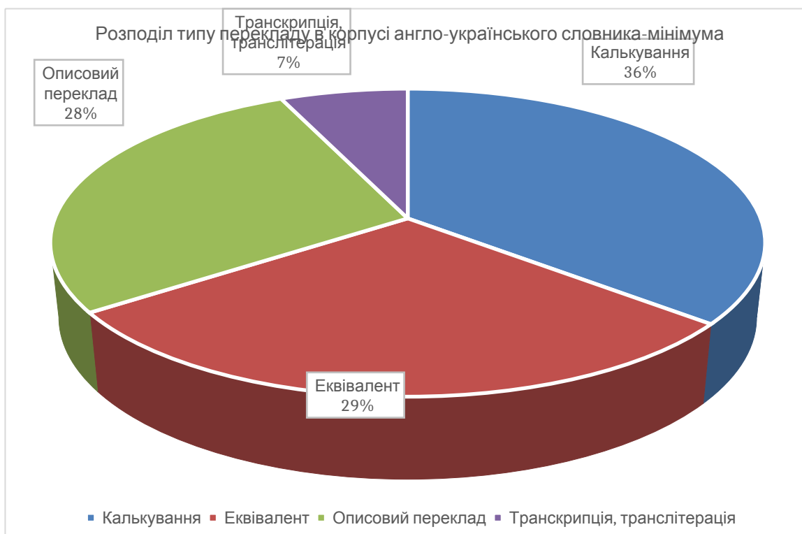
Рис. 3.1. Розподіл типу перекладу в корпусі англо-українського словника-мінімуму

Потрібно зазначити, що дані лексеми охоплюють підмови озброєння й техніки, управління військами, картографії, зв'язку, ППО/авіації, логістики, радіофразеології, навчально-строевої підготовки тощо.