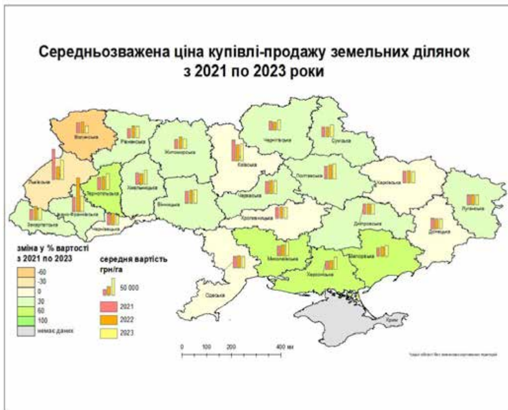
Рис.3. Середньозважена ціна купівлі-продажу земельних ділянок сільськогосподарського призначення з 2021 по 2023 роки на території України (розроблено автором)

Згідно рис.3. дані змінилися несуттєво в областях де не велося активних бойових дій та не відбулося значного переселення громадян в ці регіони. На сході країни в Сумській, Запорізькій областях відбулося підвищення цін через звільнення територій з окупації, ведення дій щодо відновлення земель, а також це можливість вигідно придбати великі земельні ділянки за низькою ціною, тому попит на ці землі та перспективи щодо їх майбутнього освоєння підвищили їх вартість. В 2022 році значно зросли ціни в Івано-Франківській, Житомирській, Закарпатській, Волинській та Миколаївській області через велику кількість внутрішньопереміщених осіб та велику кількість фермерських підприємств, що були перенесені на ці території. У Львівській області, порівняно з 2021 роком,