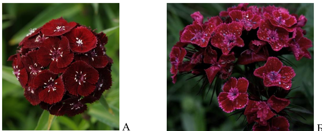
Рис.1.1. Різновид квітів гвоздики: А – міні-гвоздика, Б – бородата

Серед них гвоздика бородата ( Dianthus barbatus ) займає особливе місце. Її ботанічний опис включає дворічну або короткоживу багаторічну трав'янисту рослину, що у перший рік формує лише прикореневу розетку, а на другий рік — генеративні пагони з характерними щиткоподібними суцвіттями. Природний ареал цього виду охоплює Карпати, Балкани, Кавказ, частково Малу Азію. З часом D. barbatus натуралізувалась у країнах Західної та Центральної Європи, а згодом — у регіонах Північної Америки та Східної Азії. Її здатність до адаптації до різних кліматичних умов зробила рослину популярною не лише серед ландшафтних дизайнерів, а й серед науковців, які вбачають у ній об'єкт перспективних біотехнологічних досліджень [5, 8, 17].