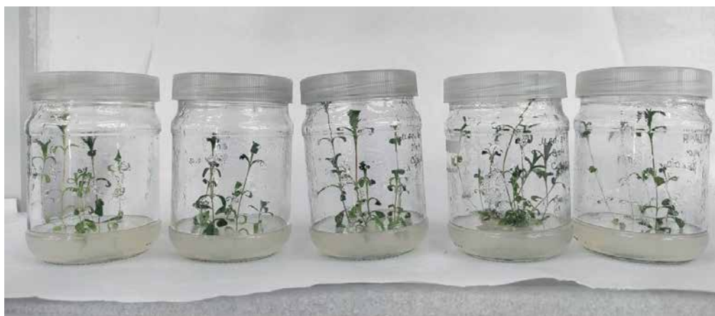
Рис. 3.3. Проростки Dianthus barbatus на 14 день культивування in vitro

Морфометричний аналіз проростків Dianthus barbatus , отриманих у стерильних умовах in vitro , є важливим етапом оцінки ефективності використаної схеми стерилізації, живильного середовища та умов культивування. Цей аналіз дозволяє визначити динаміку росту, виявити потенційні морфологічні аномалії, а також оцінити якість посадкового матеріалу, який згодом може бути використаний для подальшого мікроклонального розмноження або переведення в умови ex vitro .