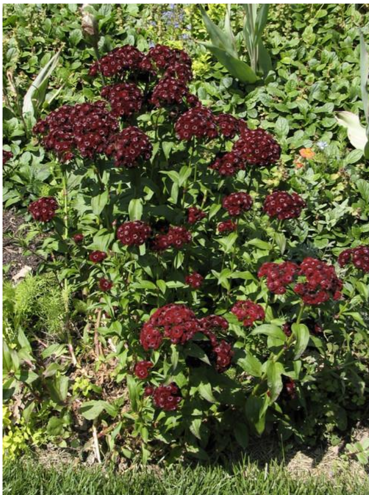
Рис. 2.1. Колекційна ділянка гвоздики бородатої ( Dianthus barbatus L. ) у Національному ботанічному саді ім. Гришка

У біотехнології рослин однією з найвідповідальніших процедур є вибір вихідного матеріалу, який безпосередньо визначає успіх подальшого введення культури in vitro . Особливої актуальності це набуває при роботі з декоративними видами, зокрема з Dianthus barbatus — гвоздикою бородатою, що має високу морфологічну чутливість до умов культивування.