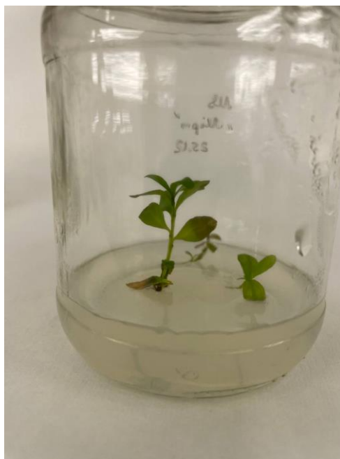
Рис. 3.2. Проростки Dianthus barbatus на 7-й день культивування на безгормональному середовищі МС.

Асептичність культур перевіряли на 10 добу: зараження спостерігалось лише в окремих пробірках, де насіння було оброблено за спрощеними схемами стерилізації (без \text{HgCl}_2 ). У варіантах з обробкою сулемою або \text{AgNO}_3 рівень асептичності перевищував 95%, що підтверджує ефективність багатоступеневої стерилізації при роботі з дрібним насінням декоративних видів.