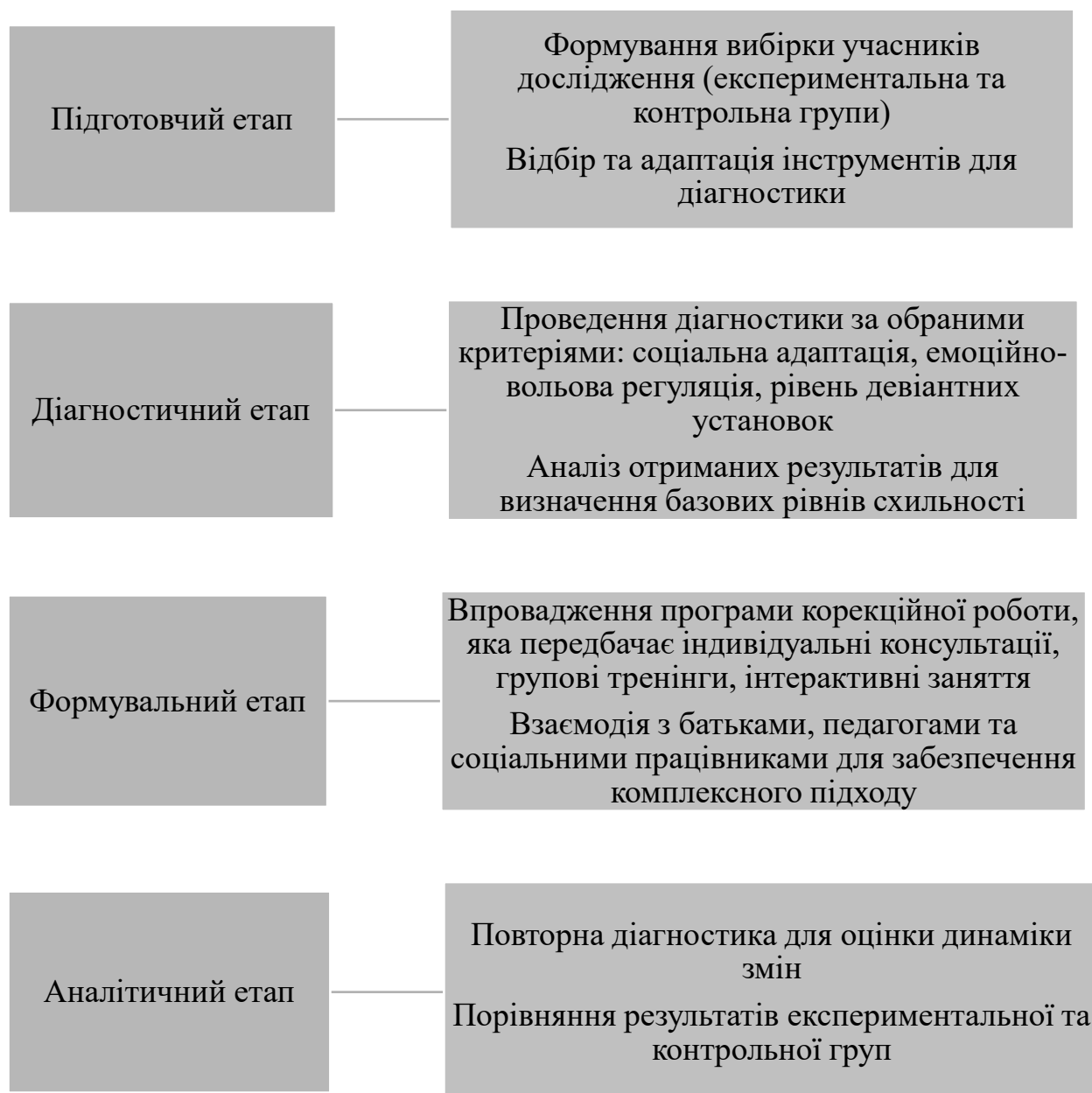
Рис. 2.1. Етапи впровадження програми соціального супроводу підлітків з девіантною поведінкою

Вивчення девіантної поведінки серед підлітків є важливим аспектом сучасної соціальної та психологічної науки. Для ефективного розуміння та корекції цієї проблеми необхідно враховувати комплексний підхід, який включає біологічні, психологічні та соціальні фактори. Методичні аспекти програми базуються на кількох ключових принципах, таких як комплексність, індивідуалізація та активна участь підлітків у процесі самокорекції. Ці принципи дозволяють адаптувати методики до потреб кожного конкретного підлітка.