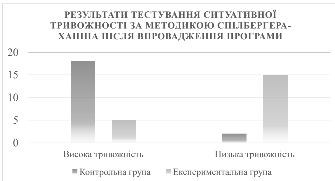
Рис. 3.2. Результати тестування ситуативної тривожності за методикою Спілбергера-Ханіна після впровадження програми

тривожності може провокувати агресивну або імпульсивну поведінку, що утруднює соціальну адаптацію та сприяє виникненню конфліктів у міжособистісних відносинах. Для оцінки рівня тривожності було використано методику Спілбергера-Ханіна, яка дозволяє визначити ступінь емоційної напруги та її вплив на поведінку підлітків у різних соціальних ситуаціях.