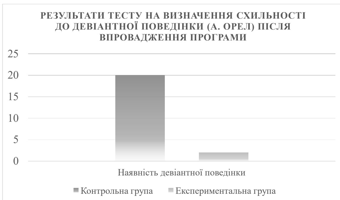
Рис. 3.3. Результати тесту на визначення схильності до девіантної поведінки (А. Орел) після впровадження програми

підтримки підлітків із девіантною поведінкою, оскільки вони демонструють необхідність врахування рівня ситуативної тривожності при створенні профілактичних та корекційних заходів.