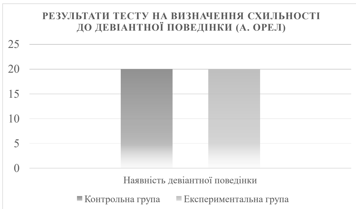
Рис. 2.4. Результати тесту на визначення схильності до девіантної поведінки (А. Орел)

Результати, представлені на рис. 2.4 демонструють рівень схильності до девіантної поведінки у підлітків, що проходили тестування за методикою А. Орела. Порівняння показників контрольної та експериментальної групи показує однакові результати на початковому етапі дослідження, що вказує на схожий рівень схильності до девіантної поведінки в обох групах до початку впровадження корекційних заходів. Така ідентичність показників підтверджує коректність формування вибірки та надає об'єктивну основу для подальшого аналізу ефективності застосованих інтервенцій. Ці результати дозволяють зберегти валідність дослідження та створюють базу для оцінки змін у поведінці після впровадження соціально-психологічних програм.