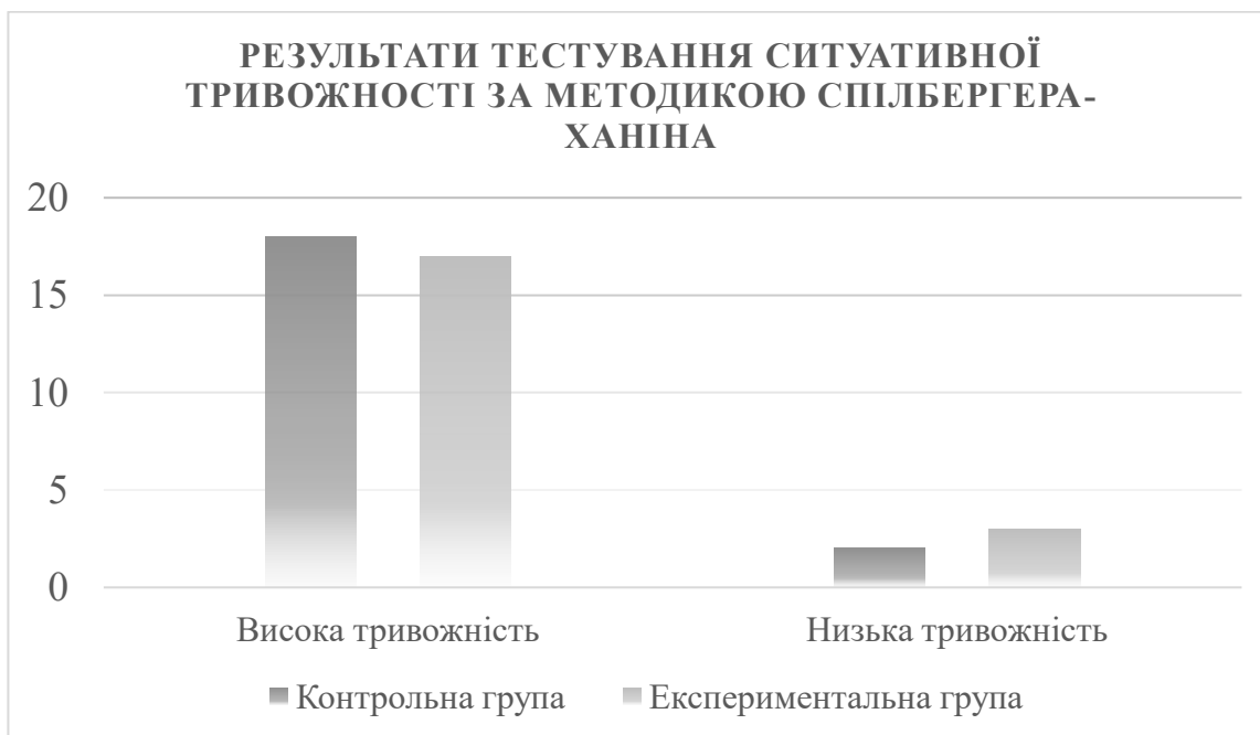
Рис. 2.3. Результати тестування ситуативної тривожності за методикою Спілбергера-Ханіна

Для дослідження впливу тривожності на девіантну поведінку підлітків використовується методика Спілбергера-Ханіна, яка дозволяє оцінити рівень ситуативної тривожності. За допомогою цієї методики можна визначити, наскільки часто підлітки відчують тривогу в різних ситуаціях, а також виявити взаємозв'язок між високими показниками тривожності та схильністю до девіантних проявів у поведінці. Результати тестування представлені на рис 2.3. допомагають не лише виявити підлітків з підвищеним рівнем тривожності, але й встановити необхідність психокорекційної роботи, спрямованої на зниження тривожності та поліпшення адаптації підлітків до соціуму.