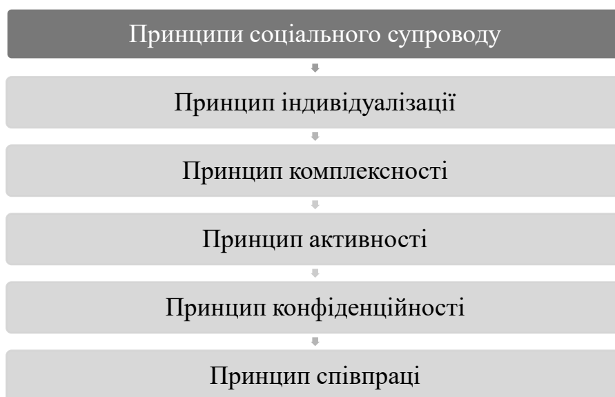
Рис. 1.1. Принципи соціального супроводу підлітків з девіантною поведінкою

підтримку підлітків у процесі соціалізації, зниження рівня девіантної поведінки та стимулювання позитивних змін у їхньому житті.