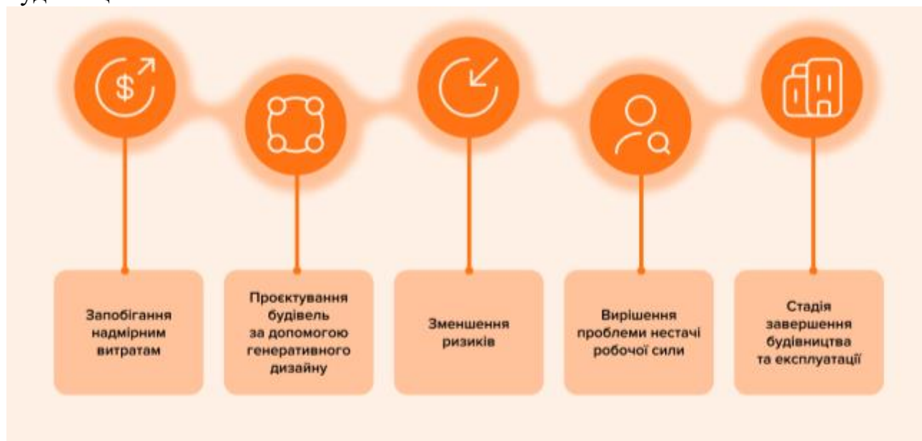
Рис. 1. Технології штучного інтелекту у будівельній галузі [1]

Штучний інтелект (ШІ) розвивався на перетині різних сфер знань, включаючи філософію, наукову фантастику, уяву, комп'ютерні науки, електроніку та інженерні винаходи.