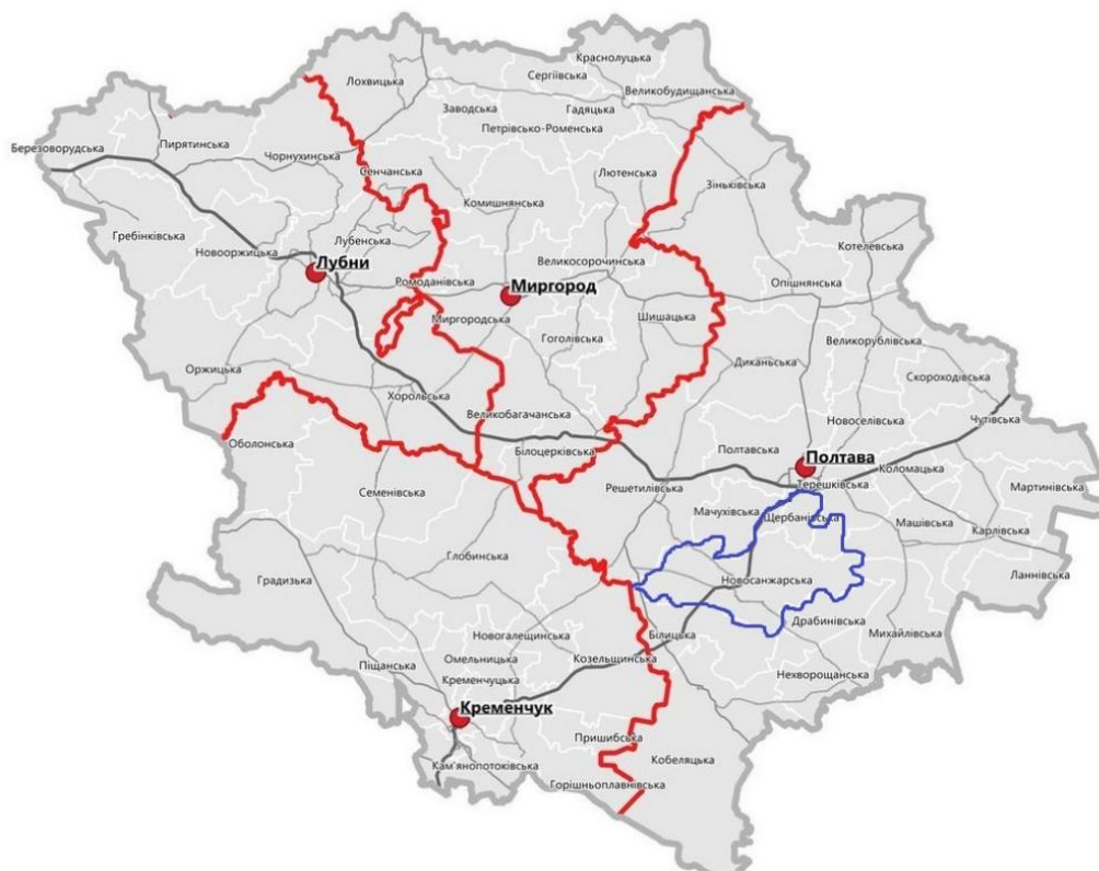
Рис. 2.1. Схема розташування холдингу «Фенікс Хантер» в межах Полтавської області

Район має вигідне транспортно-географічне розташування, густу мережу автомобільних шляхів, ліній електропередач та сприятливі кліматичні умови, що в цілому формують високий природно-ресурсний потенціал. Корисні копалини на території району включають газоконденсат, піски будівельні, цегельна і керамзитова сировина. Ґрунтові та агрокліматичні умови території розміщення мисливського господарства сприятливі для розвитку лісового господарства.