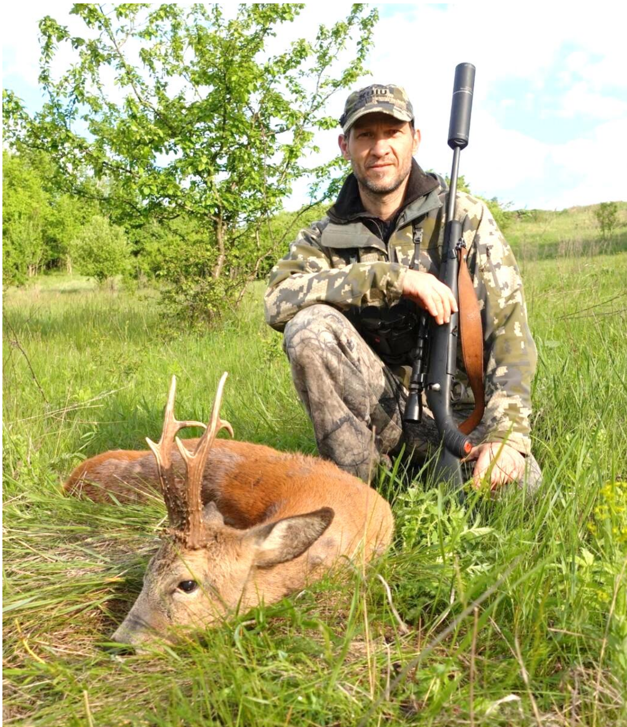
Трофейне полювання на самця козулі європейської (МХ «Фенікс Хантер», 2021)