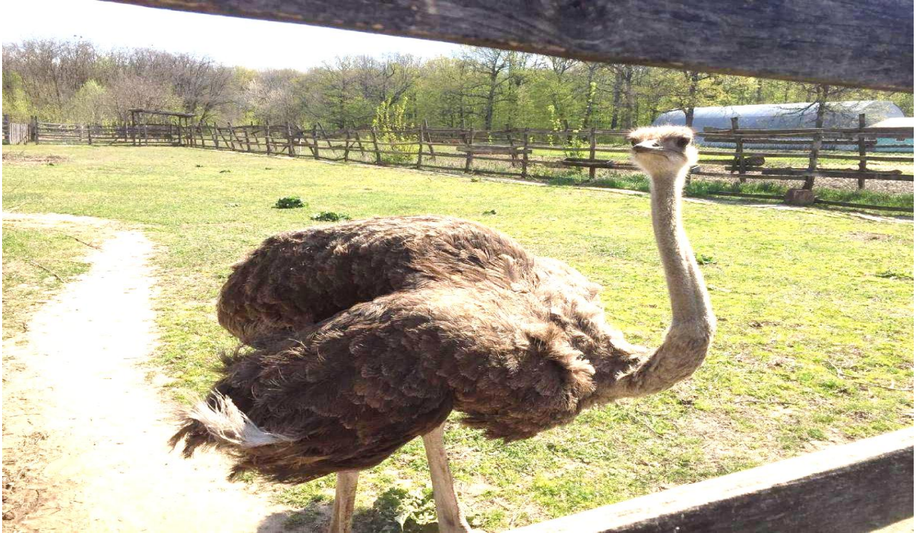
Еко-парк «Попівка» (МХ «Фенікс Хантер», 2025)