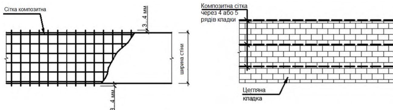
Рисунок 2 – Схеми армування кладки композитною арматурою

Схеми улаштування армування кам'яної кладки композитною арматурною сіткою наведені на рис. 2.