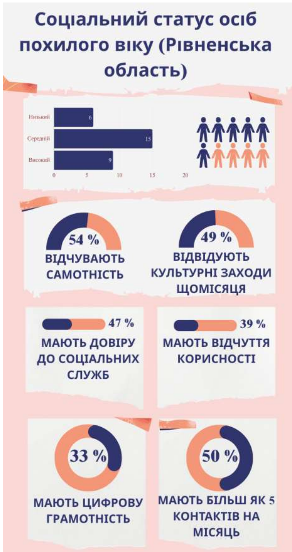
Рис. 3.3. Результати дослідження соціального статусу осіб похилого віку в Рівненській області