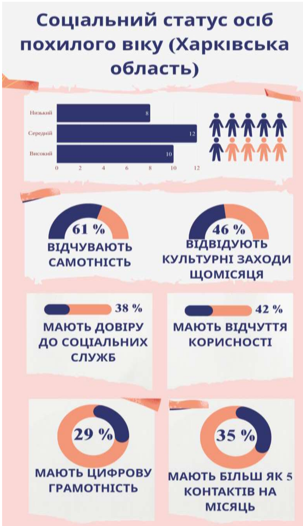
Рис. 3.1. Результати дослідження соціального статусу осіб похилого віку в Харківській області