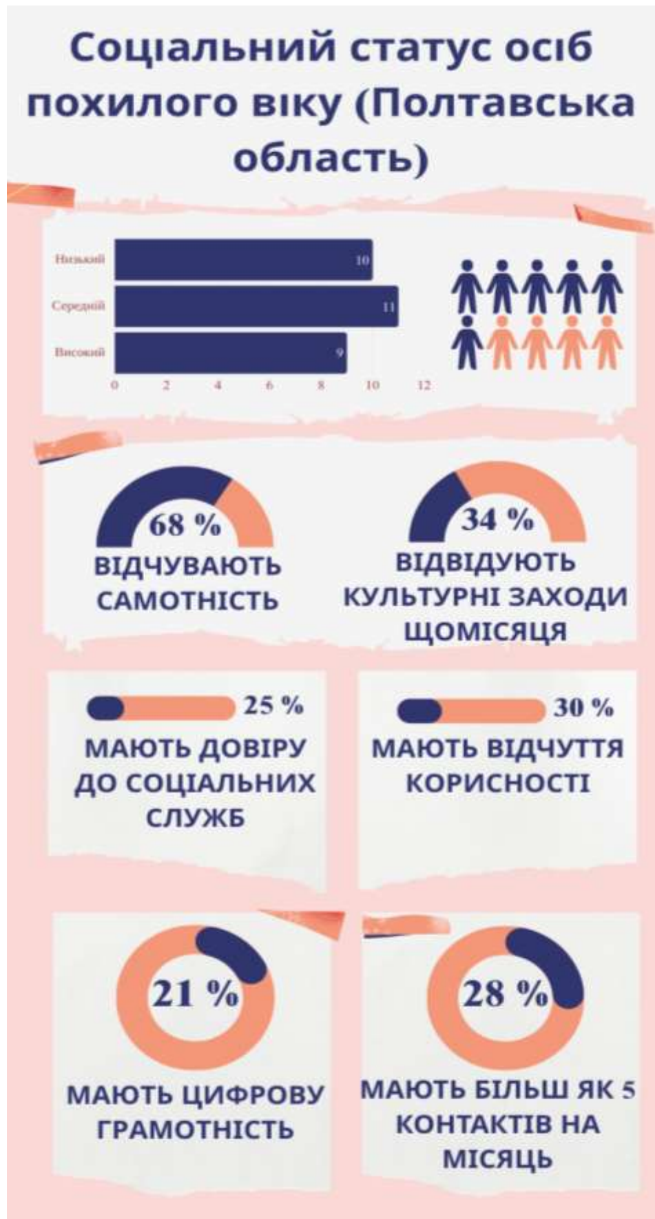
Рис. 3.2. Результати дослідження соціального статусу осіб похилого віку в Полтавській області