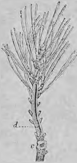
Побег поврежденный лубоедом: c — входное отверстие, d — канал в сердцевине (искрытый).

Достигнув полного роста личинка углубляется внутрь коры, в мертвую часть и здесь окукливается в особой яйцевидной колыбельке. Свежевышедшие из куколок жуки, окрашенные обыкновенно в желтый цвет, остаются еще несколько дней в колыбельках, пока окрепнут и побуреют, и тогда вылетают наружу, для чего каждый выгрызает особое летное отверстие. Входное отверстие, ведущее в маточный ход, обыкновенно бывает скрыто в щели коры или под какой-нибудь отставшей чешуйкой, а летные лежат совершенно открыто. Входное отверстие можно легко находить, благодаря тому, что работающие лубоеды всегда выкидывают через него из маточного хода наружу беловатые и светлорубые опилки (червоточину), которые скопляются на коре ниже входного отверстия кучкой или рассыпаются на коре и легко бросаются в глаза, пока не сдуют их ветры и не смоют дожди; нередко из маточного хода вытекает смола, скопляющаяся вокруг входного отверстия и образующая при засыхании белую воронку, из которой и сыпятся опилки. Все развитие лубоеда длится около 8—12 недель.