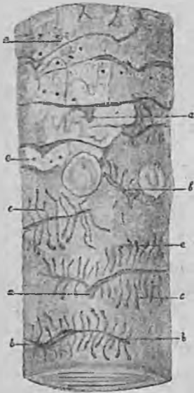
Ходы малого лубоеда на стоящем дереве: a —входной канал, b —маточный ход, c —личинковые ходы, e —летные отверстия.

жука. Колыбелька может углубляться иногда до 2 см. в древесину; величина входного отверстия в ней соответствует толщине личинки в момент ее углубления, но позднее отверстие расширяется жуком при вылете и тогда, как летное отверстие, оно точно соответствует диаметру тела лубоеда. В последствии тонкая кора образует трещины вдоль маточных ходов, а выше и ниже их видны летные отверстия. Если жуки нападают на лежащее дерево, то входные каналы могут идти в обратном направлении или бывають косы; скобка, образуемая ветвями маточных ходов, бывает тогда неправильной и может быть обращена, в одних ходах, к вершине, а в других, соседних—к комлю, между тем как на стоящих деревьях все скобки обращены к вершине дерева и входные каналы всегда находятся ниже маточных ходов.