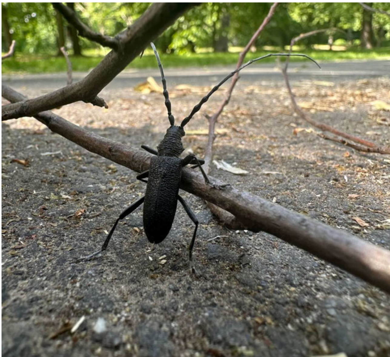
Рис. Г.2.Малий дубовий вусач