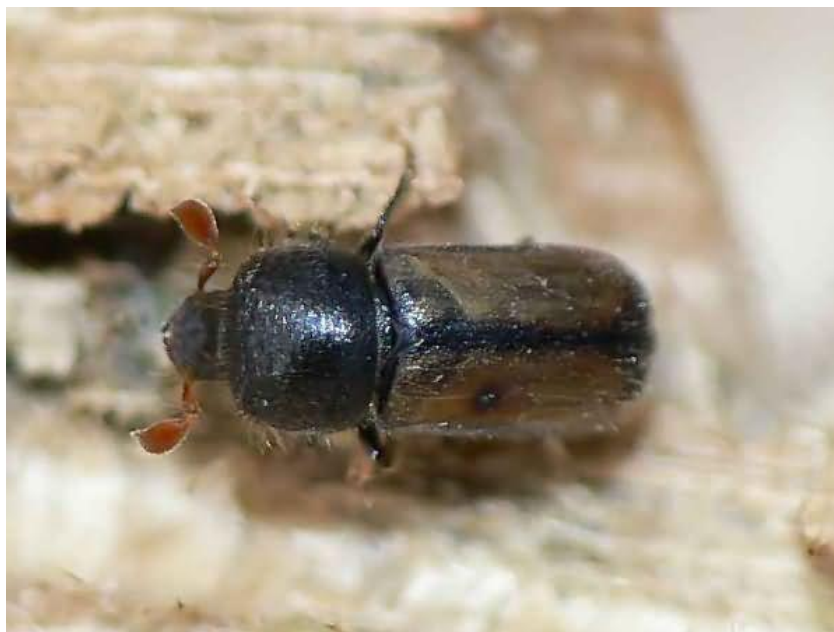
Рис. 1.4. Великий сосновий лубоїд ( Tomicus piniperda ) [10]

частини хлистів, лісоматеріали осінньо–зимової та весняної рубки, а також великі порубкові залишки, пні, дерева, пошкоджені внаслідок вітровалу і бурелому. Віддає перевагу затіненим і зволженим місцям; рідкий штабель заселяє дощенту, щільний – лише на поверхні і неглибоко з боків.