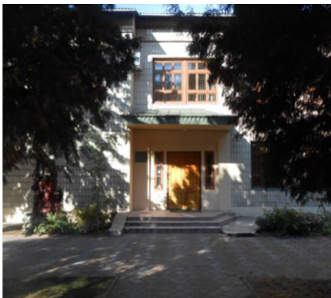
Рис. 2.1. Контора надлісництва

Розташований в центральній частині Київської області на території трьох адміністративних районів: Бориспільського, Баришівського і частково Броварського. Було організовано в складі держлісгоспу 6 лісництв: Баришівське, Вишеньківське, Кийлівське, Старинське, Процівське, Сулимівське. На даний час держлісгосп має 9 лісництв, – це пов'язано з проведеною реорганізацією та приєднанням ДП «Переяслав–Хмельницький лісгосп» в 2022 році: Баришівське, Вишеньківське, Кийлівське, Старинське, Березанське, Переяславське, Стовп'язьке, Студениківське, Помоклівське лісництва.