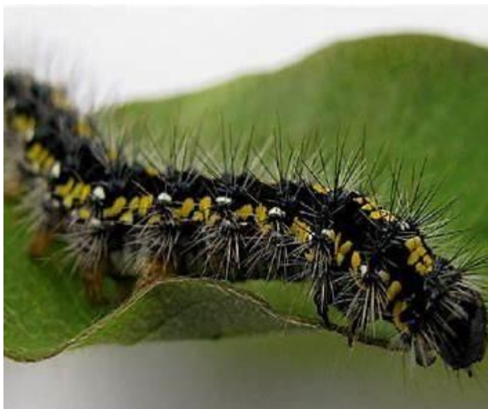
Рис. 4.1. Гусениця золотогуза [19]

Золотогуз ( Euproctis chrysorrhoea ) – це поширений шкідник з родини молей-вогнівок (Lymantriidae), який може завдати шкоди лісам. Дорослий метелик має яскраве забарвлення: червонувато-жовті плями на крилах і золотисті волоски на задній частині тіла. Розмах крил становить від 35 до 50 мм.