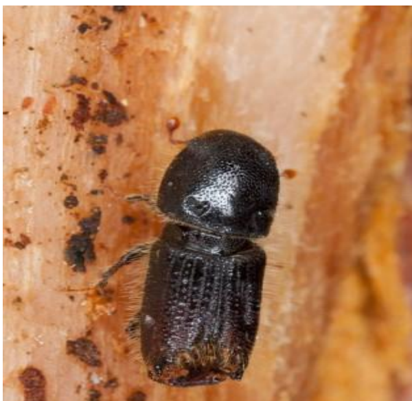
Рис. 1.2. Імаго короїда шестизубчатого ( Ips sexdentatus Voern.) [4]

Цей шкідник живе переважно в областях товстої і перехідної кори, лише іноді, зазвичай на лежачих деревах, поширюючись у область тонкої кори. Він заселяє товстомірні сортименти і частини хлестів, заготовлених восени, взимку, навесні та влітку. Світлолюбний і теплолюбний, тому глибоко в штабелі не проникає.