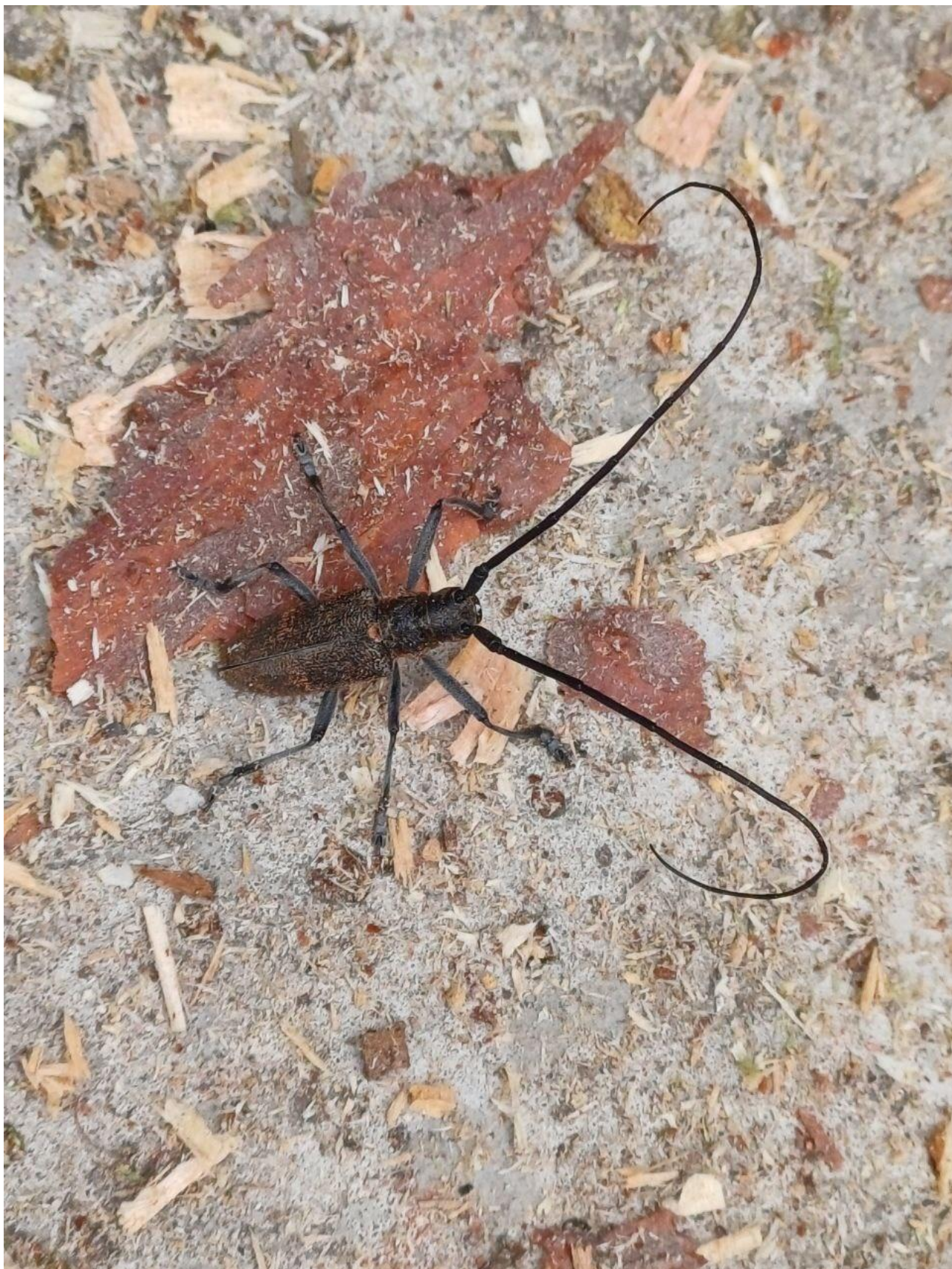
Рис. Г.1. Чорний сосновий вусач