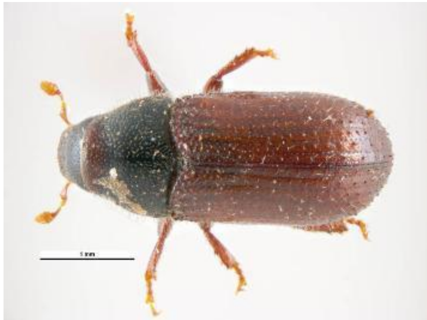
Рис. 1.5. Малий сосновий лубоїд ( Tomicus minor ) [4]

Плодючість сягає 60–100 яєць. Вхідний канал і розвилка, утворені обома розгалуженнями маточного ходу, слугують камерою спарювання. Відроджені личинки прогризають ходи з обидвох боків від маточного ходу вздовж стовбура дерева, які розширюються в міру їх росту.