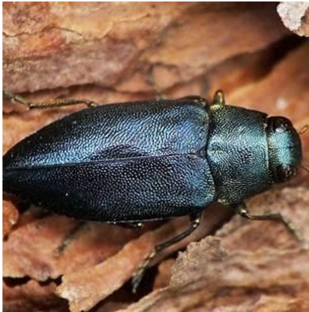
Рис. 4.2. Синя соснова златка [17]

Золотогуз поширений у Європі та Азії, але його також завезли в Північну Америку для біологічної боротьби з бур'янами. Проте через здатність сильно шкодити листовим деревам, цей вид вважається небезпечним шкідником і потребує постійного нагляду в лісовому господарстві[17].