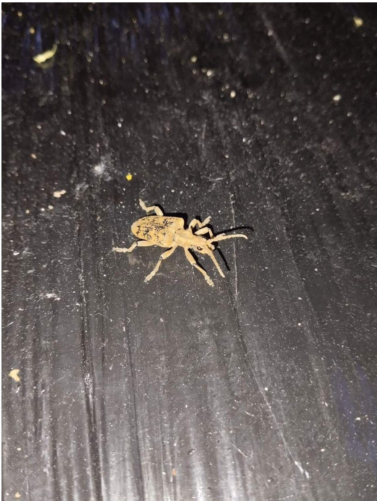
Рис.Г.4. Вусач рагій