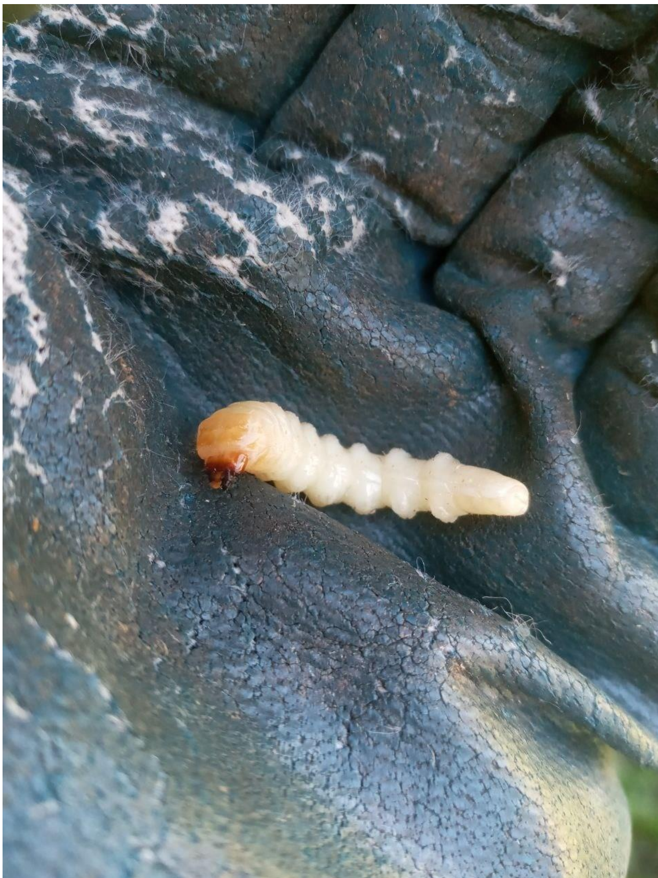
Рис. Г.3. Личинка малого дубового вусача