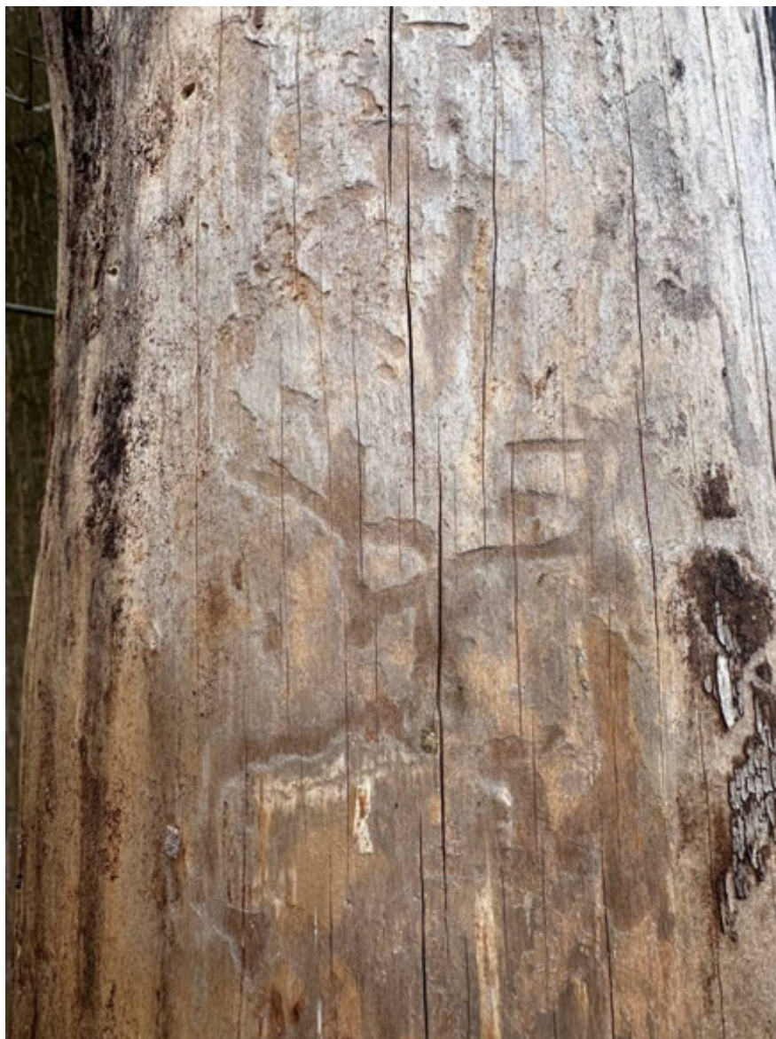
Рис. 1.1. Ходи златки [12]

Більшість видів цієї підродини мають на задній частині надкрил заглибини із зубчиками та бугорками на краях, які утворюють «тачку», за допомогою якої жуки, рухаючись назад, видаляють зі своїх ходів порошок. Кількість зубців і їхня форма на краях «тачки» відрізняються для різних видів і є постійними для кожного виду [3].