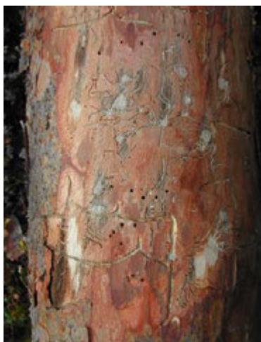
Рис.1.3. Ходи лубоїдів

Великий сосновий лубоїд ( Tomicus piniperda ). Характер пошкоджень і біологічні особливості. Один з найбільш поширених і небезпечних шкідників сосен. Широко поширений в хвойних і змішаних, особливо в соснових лісах. Розвивається переважно під товстою і перехідною корою, частіше на зростаючих, ослаблених або недавно відмерлих деревах.