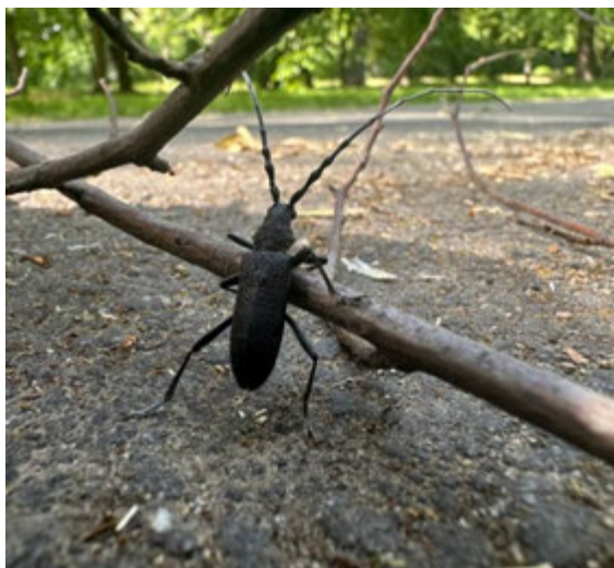
Рис. 4.4. Вусач дубовий малий

Життєвий цикл виду охоплює 2–3 роки. Цей вусач переважно заселяє дубові, грабово–дубові й грабово–букові ліси. Імаго не живляться. Вони проявляють активність у сутінках та вночі, часто летять на штучне світло, особливо самці. У денний час перебувають переважно біля основ дерев або в лісовій підстилці. Період масового льоту починається наприкінці травня в передгір'ях і триває до кінця червня, тоді як у гірських районах активність спостерігається з червня по серпень [15].