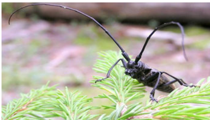
Рис. 1.6. Чорний сосновий вусач ( Monochamus galloprovincialis Ol.)

Літ триває з червня до осені. Додаткове живлення в кронах триває 1–2 тижні. Самки відкладають по 1–3 яйця (загалом до 20) у вигризені ними в корі ямочки. На стовбурах з'являються насічки: на товстій корі – у вигляді ворончок, на тонкій – у вигляді поперечних щілин. Личинки зазвичай з'являються з другої половини червня до початку липня. Молоді личинки спочатку гризуть кору, потім харчуються поверхневими шарами деревини.