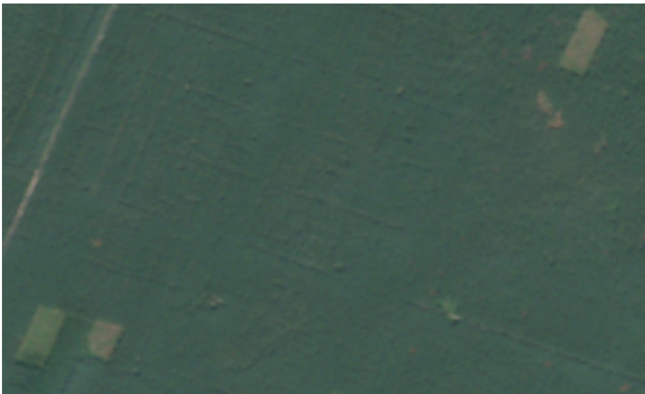
Рис. 3.1. Знімок від 24 серпня 2018р. (Sentinel-2, True Color)

Відбір зображень для референтних дат здійснювався за двома ключовими критеріями: мінімальна хмарність та належність до одного сезону. Пріоритет надавався знімкам за літній вегетаційний період (червень-серпень), оскільки максимальна вегетаційна активність рослинності в цей час забезпечує найбільш інформативні та зіставні дані. Порівняльний аналіз відібраних знімків уможливорює точну просторову локалізацію ділянок змін, ідентифікацію їхнього характеру та кількісну оцінку масштабів трансформації лісового покриву.