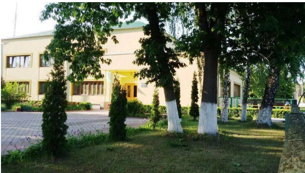
Рис. 2.1. Контора Шепетівського надлісництва

Територія діяльності Шепетівського надлісництва охоплює землі Шепетівського адміністративного району, розташованого в північно-східній частині Хмельницької області. Поштова адреса: індекс 30400, м. Шепетівка вул. Героїв Небесної сотні, 113 Електронна адреса: leshos08@ukr.net тел./факс: (03840) 417-48'