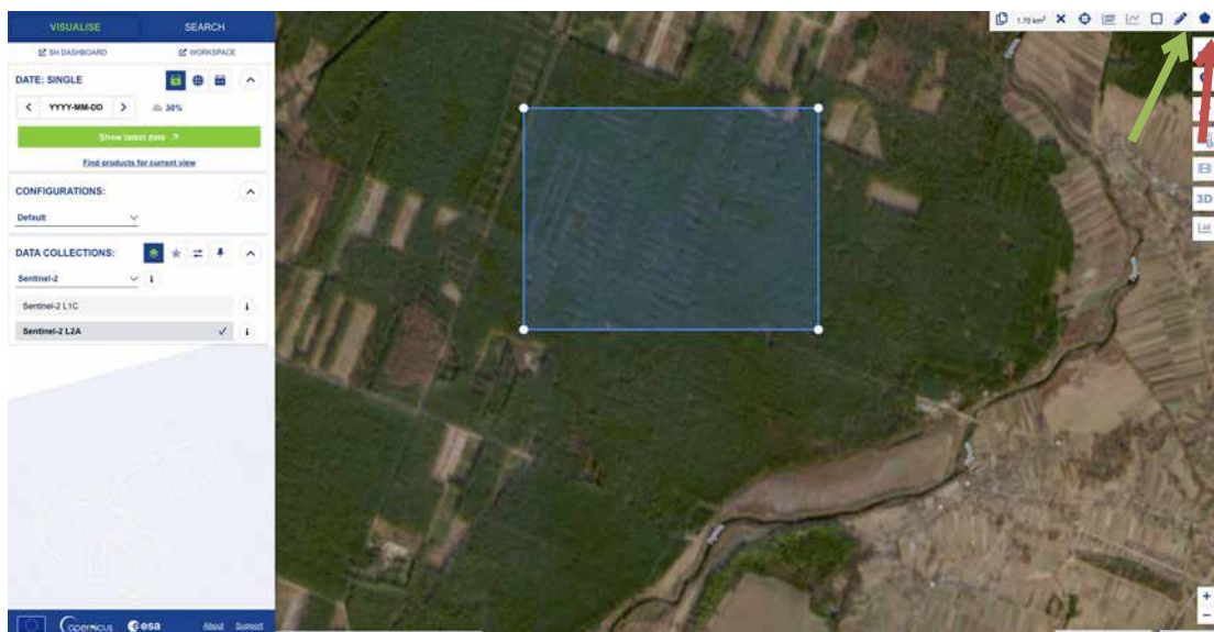
Рис. 2.4. Інструменти для побудови полігона в Copernicus Browser

Рисунок 2.4 ілюструє процес створення та фінальний вигляд полігональної області, що окреслює межі досліджуваної території в сервісі Copernicus. На зображенні стрілками виділено ключові елементи інтерфейсу, задіяні в цьому процесі: інструмент роботи з шарами (червона стрілка) для керування картографічною основою та інструмент векторизації «Олівець» (зелена стрілка). Саме за допомогою останнього було сформовано результуючий полігон, який слугує основою для подальшого аналізу динаміки лісового покриву.