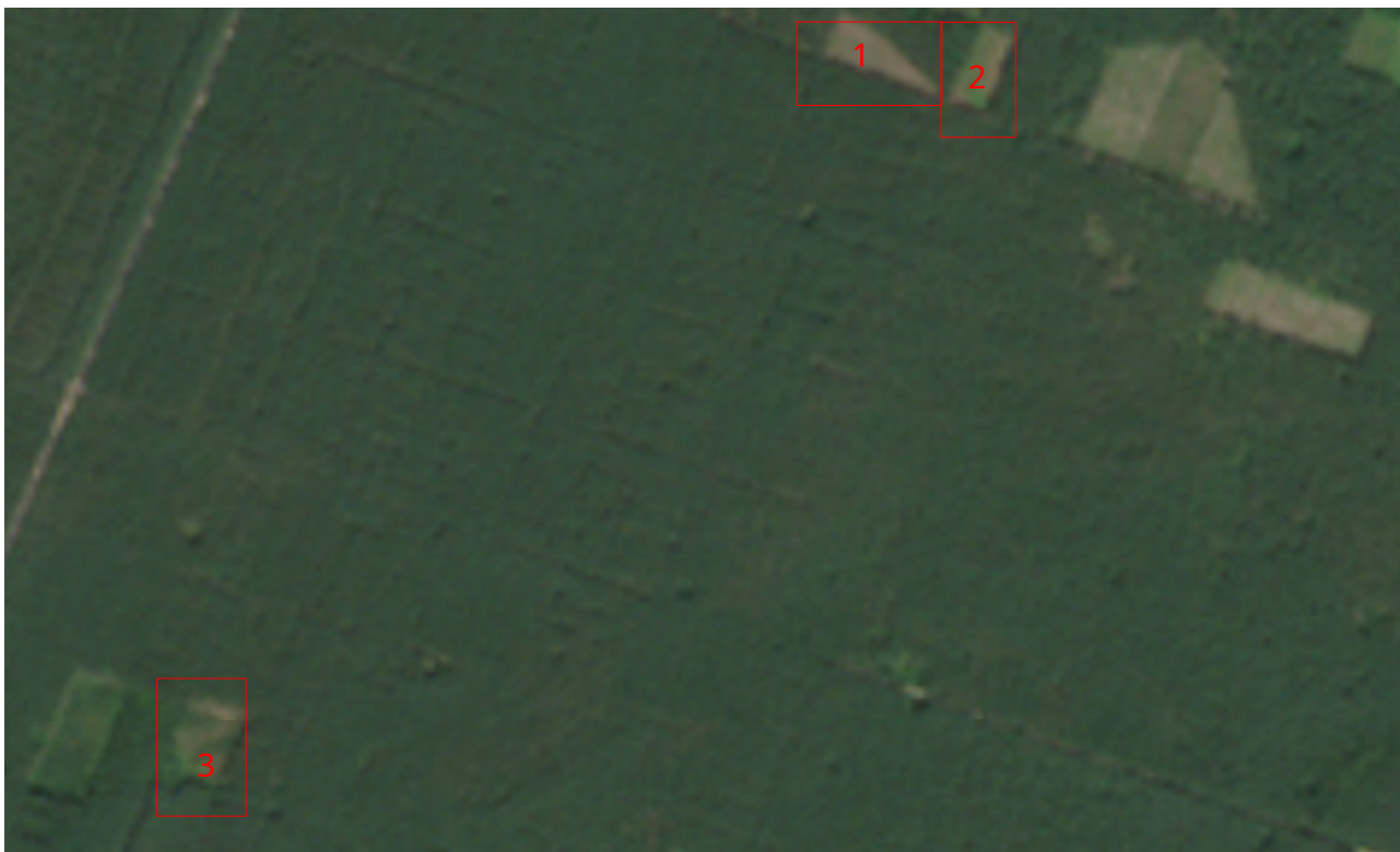
Рис. 3.5. Знімок від 26 серпня 2022 року (Sentinel-2, True Color)

темпів лісгосподарської діяльності в межах аналізованого кварталу протягом 2021 року.