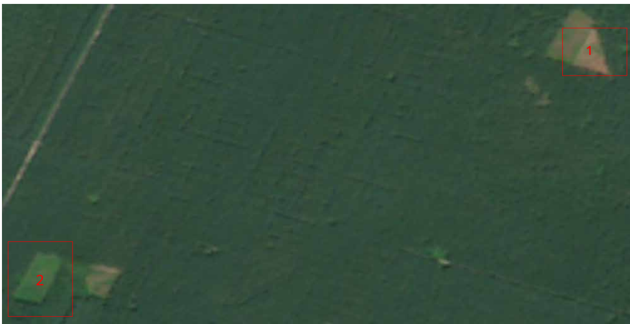
Рис. 3.3. Знімок від 6 серпня 2020 року (Sentinel-2, True Color)

Аналіз супутникових зображень за період 2019-2020 років фіксує перші значні трансформації лісового покриву на досліджуваній території після періоду відносної стабільності. На знімку від 6 серпня 2020 року чітко ідентифікуються новостворені безлісі ділянки, що є свідченням інтенсивних лісогосподарських втручань.