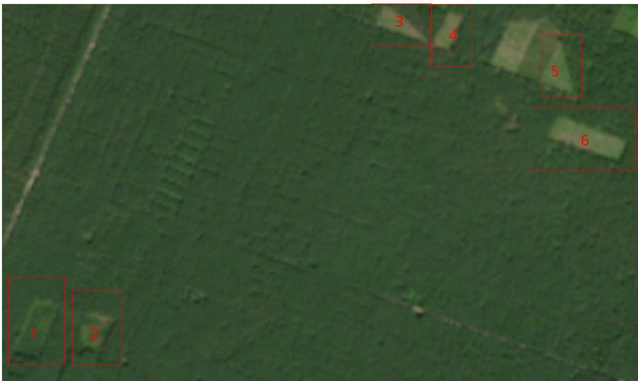
Рис. 3.6. Знімок від 16 серпня 2023 року (Sentinel-2, True Color)

У 2023 році не спостерігається зростання масштабів вирубки лісу. Якщо порівнювати з попередніми роками, то в 2021 відбулись наймасштабніші зміни на досліджуваній території.