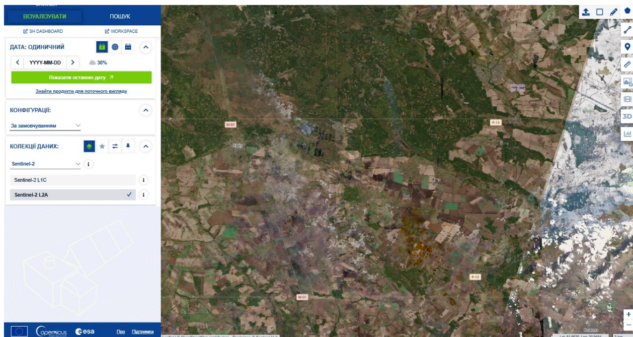
Рис. 2.3. Вигляд головного меню Copernicus Browser

На рисунку 2.3 зображено головне меню сервісу Copernicus Browser, яке містить основні інструменти для роботи з даними.