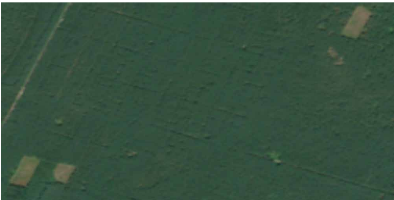
Рис. 3.2. Знімок від 19 серпня 2019 року (Sentinel-2, True Color)

Аналіз іншого знімка, зробленого 19 серпня 2019 року, наведено на рис.3.2.