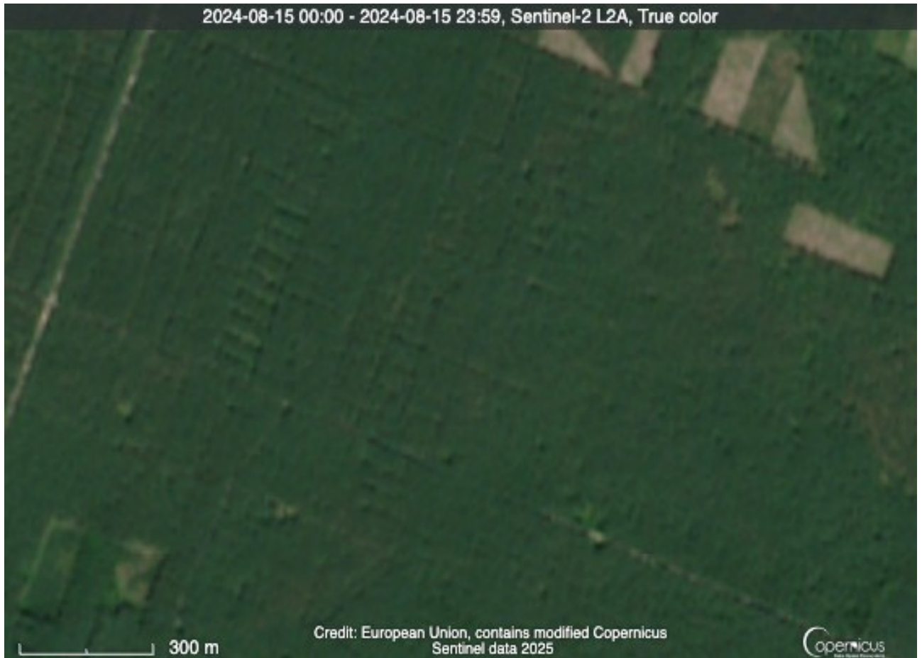
Рис. 3.7. Знімок від 15 серпня 2024 року (Sentinel-2, True Color)

У 2024 році на території дослідження суттєвих вирубок не зафіксовано: Раніше вирубані ділянки, зокрема великі світлі площі з минулих років, залишаються помітними, але видно хороше природне поновлення. Нових рубок або розширення старих лісосік у порівнянні з 2022 роком не спостерігається. На ділянках, де в попередні роки проводились рубки, чітко помітно покращення, що свідчить про активне природне або штучне відновлення.