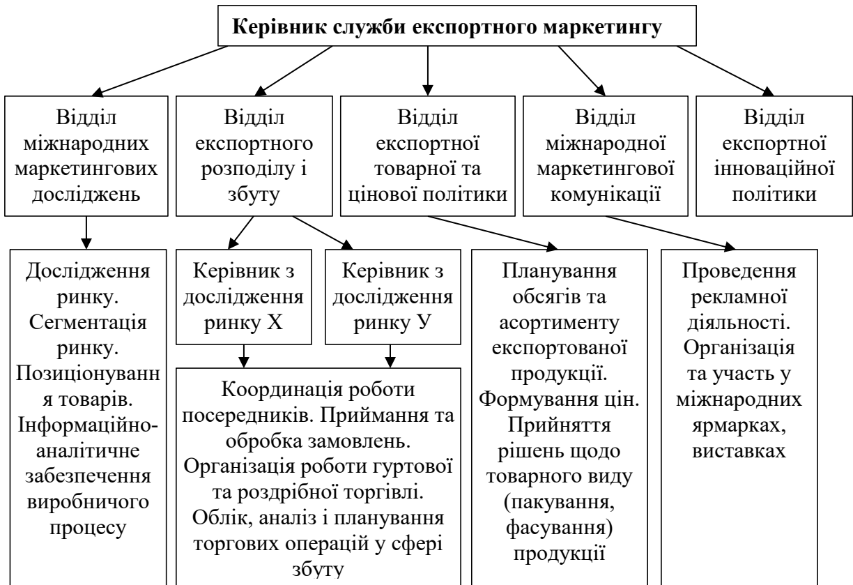
Рис. 3.1. Схема організації служби експортного маркетингу на підприємствах АПК за ринково-функціональною ознакою

Розвиток переробки продукції АПК в післявоєнний період може бути важливим кроком для відновлення та розвитку сільськогосподарського сектора України. Ось декілька напрямків, на які варто звернути увагу: