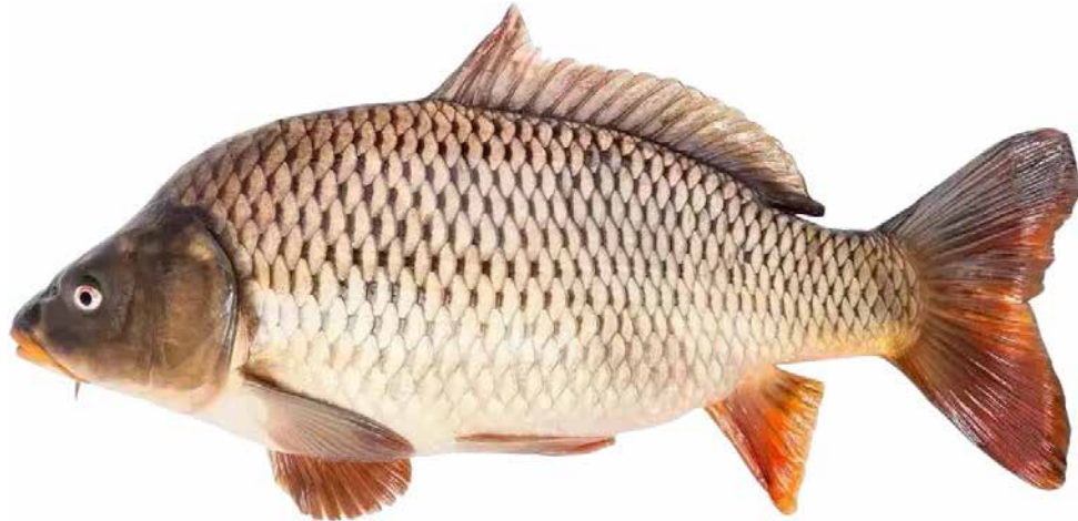
Рис. 1.3.1. Короп звичайний ( Cyprinus carpio ) [17]

обумовлене високою екологічною пластичністю, значним потенціалом росту, ефективною конверсією корму та здатністю повноцінно використовувати природну кормову базу водойм різного типу. Цей вид добре адаптується до змін умов середовища, що робить його універсальним об'єктом як екстенсивних, так і інтенсивних форм ведення рибного господарства.