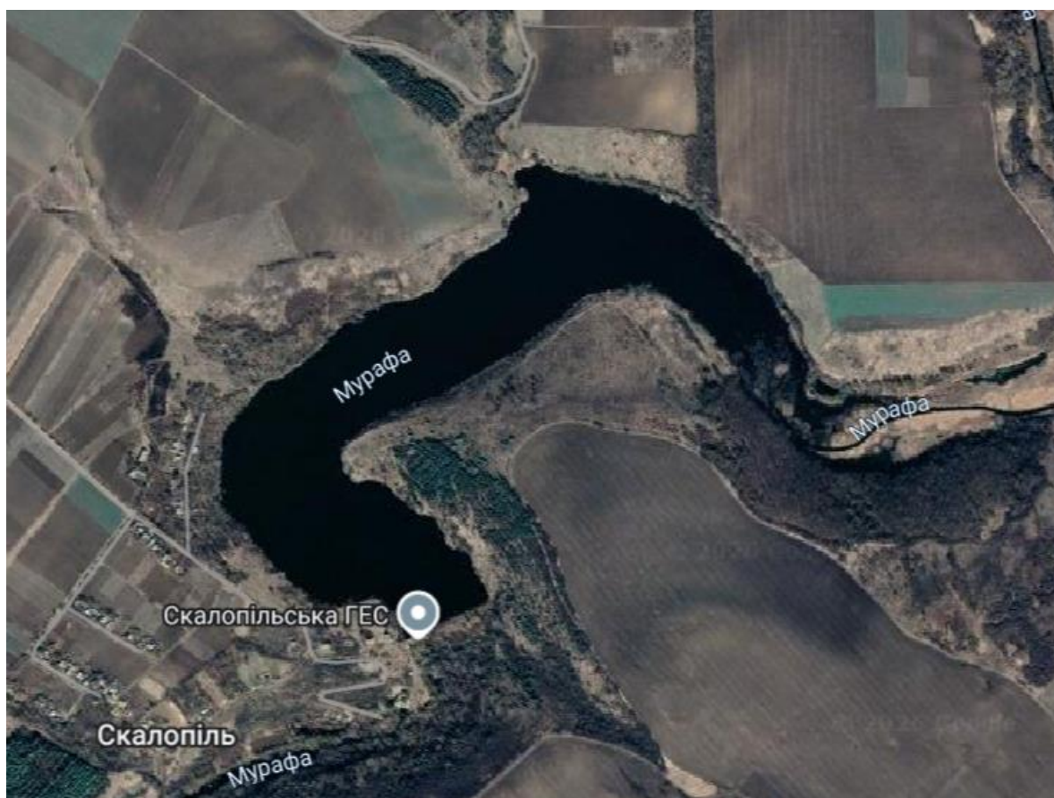
Рис. 2.1. Супутниковий знімок Скалопільського водосховища [12]

У ході досліджень було проаналізовано гідрохімічний режим водойми (за 19 показників), оцінено якість водного середовища, а також визначено чисельність і біомасу основних груп кормових організмів риби, зокрема фітопланктону, зоопланктону, зообентосу та вищої водної рослинності.