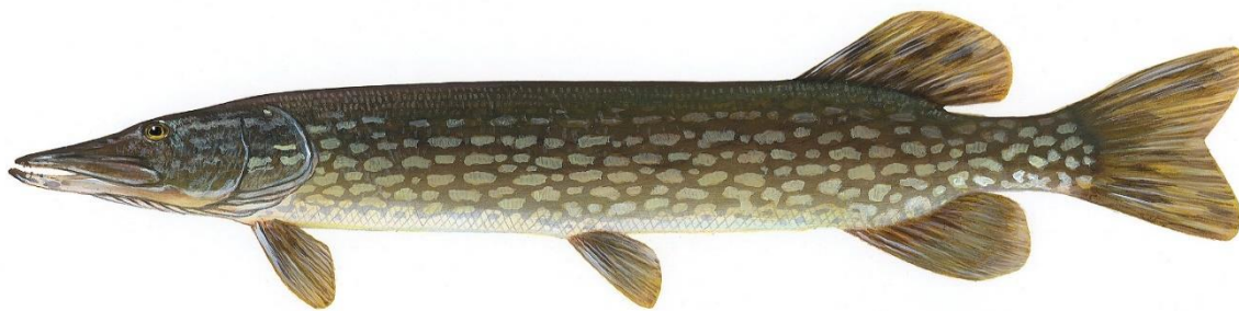
Рис. 1.3.7. Щука звичайна ( Esox lucius ) [17]

На початкових стадіях розвитку молодь живиться зоопланктоном, однак уже у двомісячному віці переходить до споживання риби. Після першого року життя щука стає типовим хижаком. Вона здатна поїдати здобич масою до 25–30 % від власної, а для приросту 1 кг маси споживає близько 3 кг риби [33].