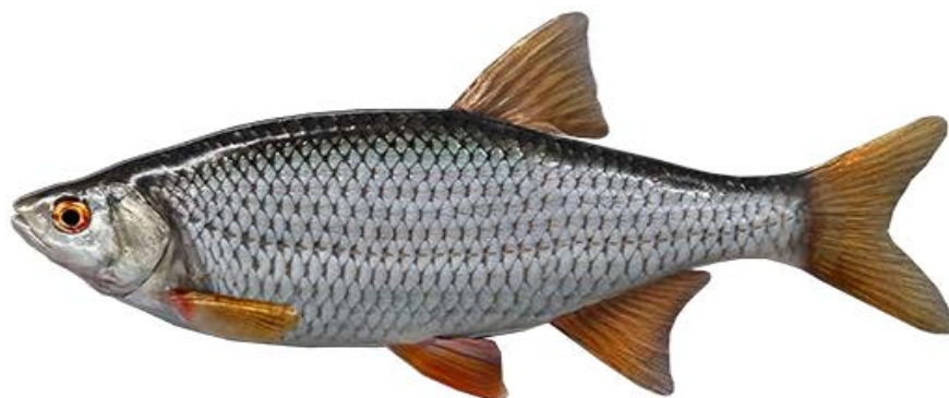
Рис. 1.3.5. Плітка звичайна ( Rutilus rutilus ) [17]

Незважаючи на значну поширеність, плітка традиційно відноситься до малоцінних промислових видів через невеликі розміри та певні особливості м'яса. Проте у великих водосховищах за рахунок покращення кормової бази її біологічні показники суттєво поліпшуються, що підвищує її господарське значення. Крім того, цей вид відіграє важливу роль у трофічних ланцюгах водних екосистем [17, 34].