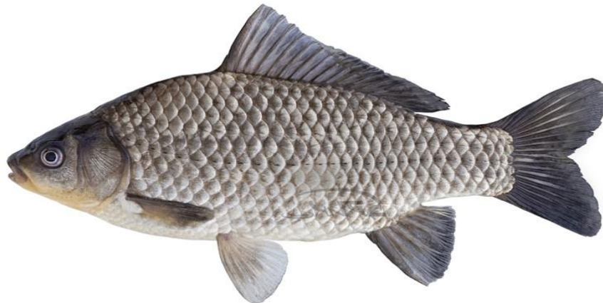
Рис. 1.3.6. Карась сріблястий ( Carassius gibelio ) [1]

Сріблястий карась ( Carassius gibelio ) є одним із найбільш витривалих та екологічно пластичних видів риб, широко поширених у водоймах України (рис. 1.3.6). Його здатність витримувати несприятливі умови, зокрема низький вміст кисню, значні коливання температури та підвищену мінералізацію води, робить його важливим об'єктом рибництва, особливо у водоймах із нестабільними гідроекологічними параметрами [17].