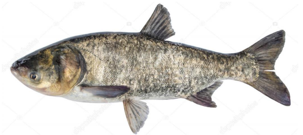
Рис. 1.3.3. Строкатий товстолоб ( Hypophthalmichthys nobilis ) [17]

Цей вид також характеризується високою плодючістю та значним потенціалом росту – у південних регіонах маса окремих особин може перевищувати 30–40 кг. Біологія розмноження строкатого товстолоба подібна до інших рослиноїдних риб: нерест у природних умовах відбувається у річках із швидкою течією, однак в Україні його відтворення здійснюється штучно [17, 34].