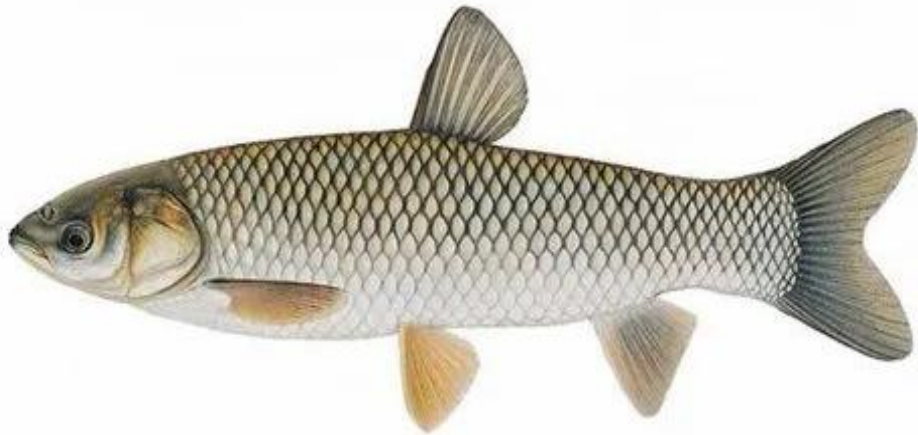
Рис. 1.3.4. Білий амур ( Stenopharyngodon idella ) [1]

Важливе місце в іхтіофауні водосховищ займає плітка ( Rutilus rutilus ), яка є широко розповсюдженим видом у внутрішніх водоймах України (рис. 1.3.5). Вона характеризується високою чисельністю популяцій та значною екологічною пластичністю. Плітка є всеїдною рибою: на ранніх стадіях розвитку живиться зоопланктоном, а дорослі особини споживають як рослинні, так і тваринні корми, включаючи молюсків та дрібну рибу.