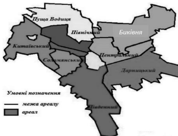
Рисунок 1. Розподіл території міста Києва за історичними ареалами [2]

Термін «Історичний ареал» (від лат. area — площа, простір, ділянка) вперше застосовано у Законі України «Про охорону культурної спадщини» від 08 червня 2000 р. № 1805. Для захисту традиційного характеру середовища населених пунктів вони за рішенням Кабінету Міністрів заносяться до Списку історичних населених місць України (Рис. 1), а для кожного історичного місця на основі опорних архітектурних планів затверджуються межі й режими використання історичних ареалів. [1]