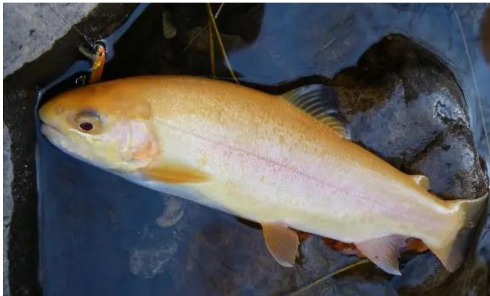
Рис. 1.2 Альбіносна форма райдужної форелі

Ця особливість забезпечує можливість ефективнішого управління виробничими циклами на фермах з вирощування райдужної форелі. У багатьох країнах культивується альбіносна форма райдужної форелі, яку часто неправильно ідентифікують як золоту форель (рис.1.2). Цей різновид користується популярністю завдяки декоративній цінності та потенціалу для розведення. Однак ця форма вирізняється високою чутливістю до несприятливих екологічних і виробничих умов, що може ускладнювати її культивацію.