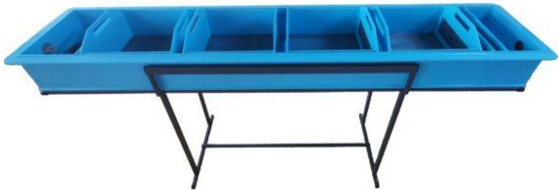
Рис.3.7 Інкубаційний апарат лоткового типу

горизонтальних апаратах на одному квадратному метрі можна розмістити до 45–60 тисяч ікринок форелі. Вертикальні апарати з'явилися пізніше і є більш економічними в плані використання води та займаної площі. Завдяки їх конструкційним особливостям можна розміщувати до 600 тисяч ікринок на одному квадратному метрі, що значно підвищує їх ефективність порівняно з горизонтальними моделями (рис. 3.7).