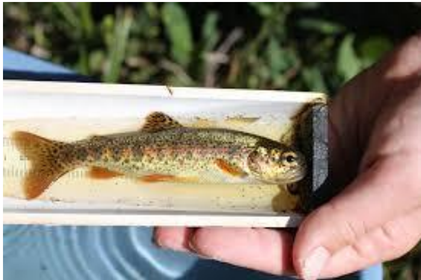
Рис.3.11 Молодь райдужної форелі

Під час вирощування цьоголіток форелі у ставках слід зважати на те, що витрата води там значно нижча, ніж у басейнах, що диктує меншу щільність посадки риб. При зміні води 2-3 рази на годину, щільність посадки може сягати 600-750 екземплярів на кубічний метр. При вирощуванні риби в садках із синтетичної сітки або металу, розмір комірок визначається масою риби, а щільність посадки не повинна перевищувати 800 екземплярів на кубічний метр (рис.3.11).