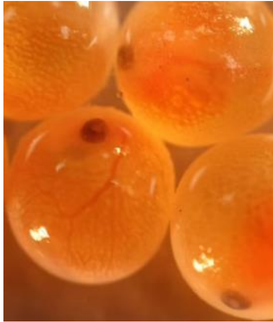
Рис.3.8 Ембріональний розвиток ікри райдужної форелі

Механічні впливи найбільш небезпечні в першій стадії інкубації, через це слід поводитися з ікрою максимально обережно. На фінальному етапі, що починається зі стадії пігментації очей і триває до викльовування, ікра стає стійкішою, тому в цей період її можна транспортувати.