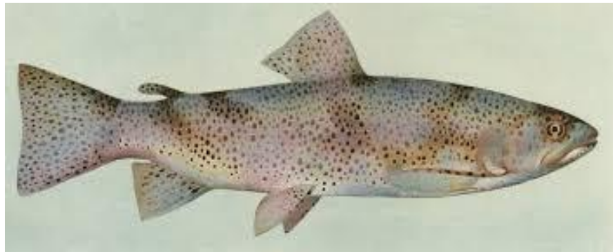
Рис. 3.12 Райдужна форель, уражена іхтіободозом

Хілодонела (Chilodonella) — це невеликий, овальної форми, безбарвний війчастий найпростіший організм, який уражає шкіру, плавники та зябра лососевих і тепловодних видів риб. Було зафіксовано випадки змішаної інфекції Chilodonella та Ichthyobodo в умовах рециркуляційної системи (рис. 3.12) .