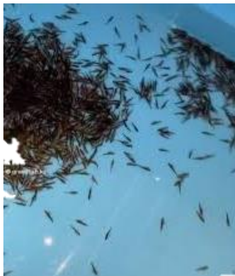
Рис.3.10 Личинки райдужної форелі

Щільність посадки за утримання вільних ембріонів залежить, головним чином, від обсягу та якості доступної води. На початковому етапі вирощування щільність посадки досягає 100 тисяч особин на кубічний метр, однак із ростом личинок цей показник поступово зменшується до 25–30 тисяч на кубічний метр. Оскільки вільні ембріони мають негативний фототаксис, необхідно забезпечити захищеність лотків і басейнів від світла, використовуючи кришки (рис.3.10).