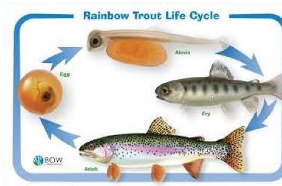
Рис.1.4 Життєвий цикл райдужної форелі

Запліднена ікра спочатку перебуває в темряві й протягом першої години після відкладання проходить процес, відомий як загартовування у воді, коли пори в ікринках запечатуються. На цьому етапі ікра стає липкою та переходить до стадії зеленої ікринки, яка триває приблизно 20 днів після нересту. У цей період ікринки дуже крихкі та можуть легко пошкоджуватися. З часом вони змінюються — стають прозорими й набувають рожевого відтінку. На їхній поверхні починають з'являтися дві темні точки, що є очима форелі. Ця фаза називається стадією ікри з очима та триває 2-3 тижні. Після цього на світ з'являються личинки. На цьому етапі форель ще не живе самостійно, оскільки харчується запасами жовткового мішка, прикріпленого до її черева. У міру свого зростання мальки залишаються червонуватими доти, поки весь жовтковий мішок не буде повністю засвоєний. Ікринки та личинки на цій стадії є дуже чутливими до змін у довкіллі, що робить їх вразливими. Коли жовтковий мішок зникає, мальки спливають на поверхню, де активно починають шукати їжу. Цей процес трансформації личинок у мальків може зайняти від 2 до 3 тижнів (рис.1.4) [10].