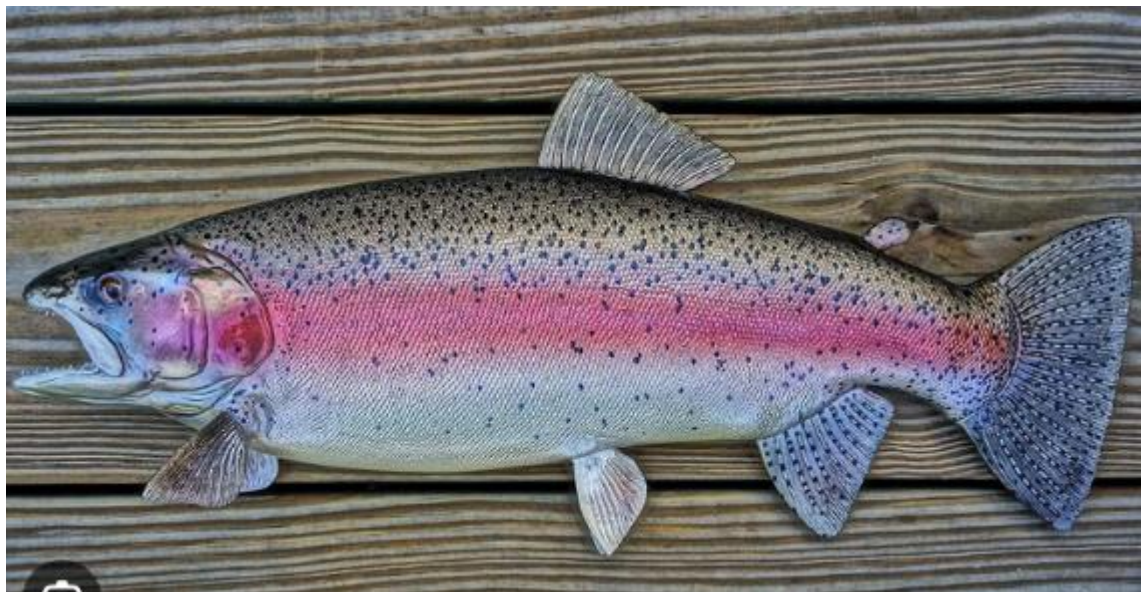
Рис. 1.1 Райдужна форель ( Oncorhynchus mykiss )

В Європу райдужна форель була інтродукована з Північної Америки у 80-х роках XIX століття. Наразі цей вид успішно акліматизувався в багатьох країнах світу, продемонструвавши високу адаптивність до нових екологічних умов.