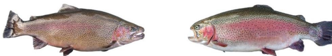
Рис.3.3 Плідники райдужної форелі (зправа – самка, зліва - самець)

Для осіменіння ікри слід використовувати суміш сперми самців віком 3–4 роки, які мають якісну сперму. Для запобігання інбридингу в господарстві рекомендується створити дві племінні групи плідників, що забезпечить можливість дволінійного промислового схрещування. Оптимальне співвідношення самців до самок становить 1:4–10. У великих господарствах доцільно утримувати на 10–15 % більше плідників, ніж це необхідно для стабільності виробництва. На рисунку 3.3 зображено плідників райдужної форелі.