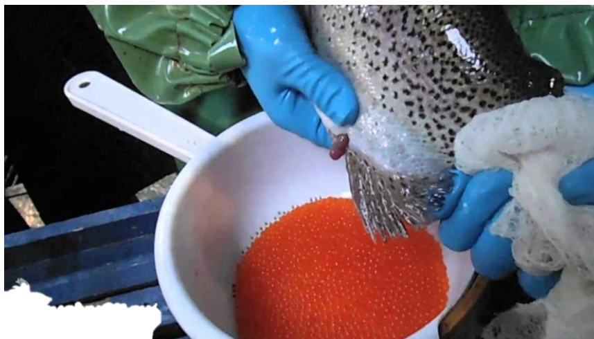
Рис.3.5 Відціджування ікри райдужної форелі

3.3.3. Відбір статевих продуктів. Ікру та молоки форелі добувають методом відціджування з використанням анестезії. Для знерухомлення плідників застосовують хінальдин та інші речовини в концентрації 1:10 000–50 000. Риб занурюють у розчин на одну хвилину, після чого наркоз припиняє діяти через 5-7 хвилин після повернення риби у звичайну воду. Після вилучення з розчину рибу обполіскують чистою водою та обережно осушують м'якою сухою тканиною. Ікру збирають у ємності від 5-8 самок і змішують із молоками, отриманими від 3-5 самців. Процес від моменту вилучення статевих продуктів до їх змішування не повинен перевищувати 10 хвилин. Існує також метод збору ікри за допомогою стисненого повітря, що дозволяє отримати чисті ікринки й мінімізувати ризик пошкодження незрілих ікринок (рис. 3.5).