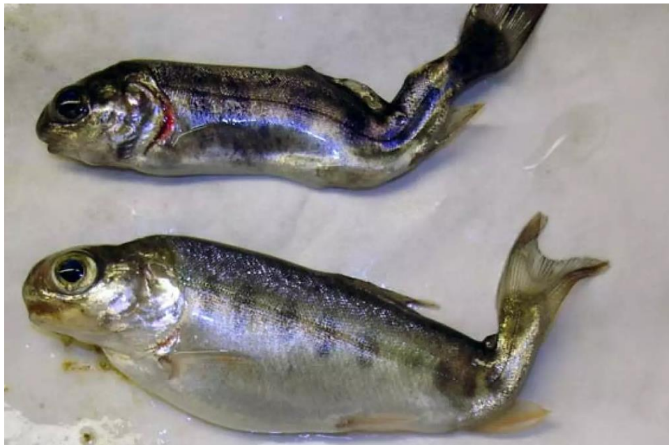
Рис. 3.13 Райдужна форель, уражена міксозомозом

Міксозомоз , відомий також як вертячка, є інвазійним захворюванням, що уражає різні види родини лососевих, зокрема лосося, струмкову та райдужну форель. Для цього патологічного стану характерними є деструкція хрящової тканини, розлади функціонування органів рівноваги та порушення діяльності центральної нервової системи (рис. 3.13).