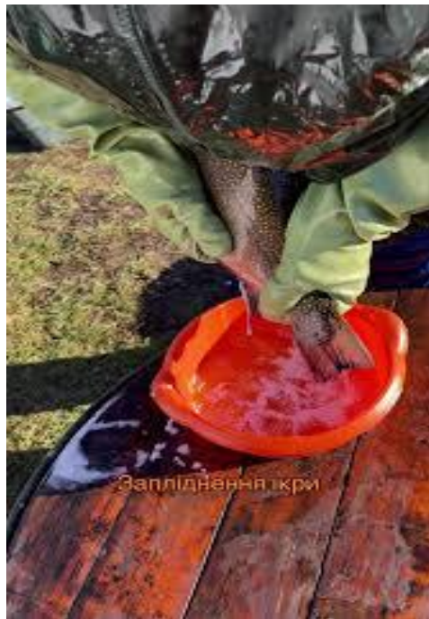
Рис.3.6 Запліднення ікри райдужної форелі

Розмноження форелі здійснюється за допомогою сухого або напівсухого способу осіменіння ікри. У сухому способі ікру та молоки ретельно перемішують, поступово додаючи воду до рівня її покриття. Після змішування суміші дають відстоятися протягом 5-10 хвилин, після чого ікру промивають для видалення залишків порожнинної рідини та сперми. Промиту ікру залишають у тій самій ємності на 2-3 години для набухання, забезпечуючи при цьому слабкий протік води (рис. 3.6).