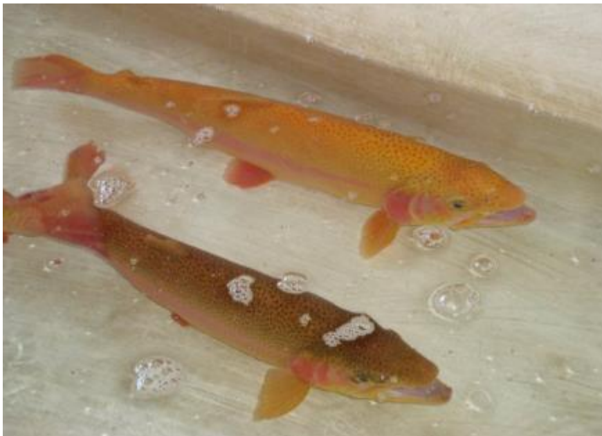
Рис.3.2 Райдужна форель породи «Адлерська янтарна»

Порода «Адлерська янтарна». В останні роки спостерігається зростання інтересу до естетичних аспектів рибництва: все більшої популярності набуває розведення форм із незвичним і оригінальним забарвленням. Такі риби користуються високим попитом на споживчому ринку. Кольорові мутації є поширеним явищем серед риб. Забарвлення тіла слугувало ключовою ознакою при селекції золотих рибок та декоративних коропів кої. Ймовірно, саме ці експерименти стали основою свідомого підходу до селекції в рибництві. У райдужної форелі зустрічаються такі варіації забарвлення: альбінос, альбінос-золотистий, жовтий, паломіно, зелений, металевий синій, кобальтовий (рис. 3.2).