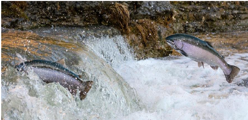
Рис.1.5 Міграція райдужної форелі

східному напрямку аж до узбережжя Камчатки. Задokumentовано окремі міграції протяжністю близько 5370 км (рис.1.5) [18].