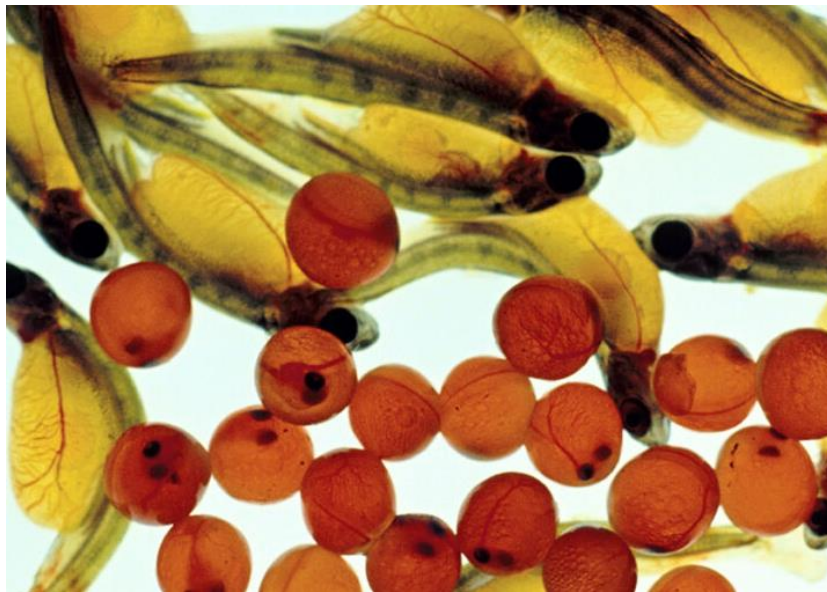
Рис.3.9 Постембріони райдувної форелі

водою. У молоді риб часто фіксуються випадки захворювань іхтіофтиріозом, тоді як у риб старших вікових груп переважають випадки диплостомозу. Значна смертність також може бути спричинена іншими чинниками, пов'язаними з порушенням режиму годівлі. Серед найсерйозніших проблем слід виокремити харчові отруєння через використання несвіжих кормових компонентів, переродження печінки внаслідок дисбалансу основних поживних речовин та надлишкового вмісту вуглеводів у раціоні, а також численні авітамінози.