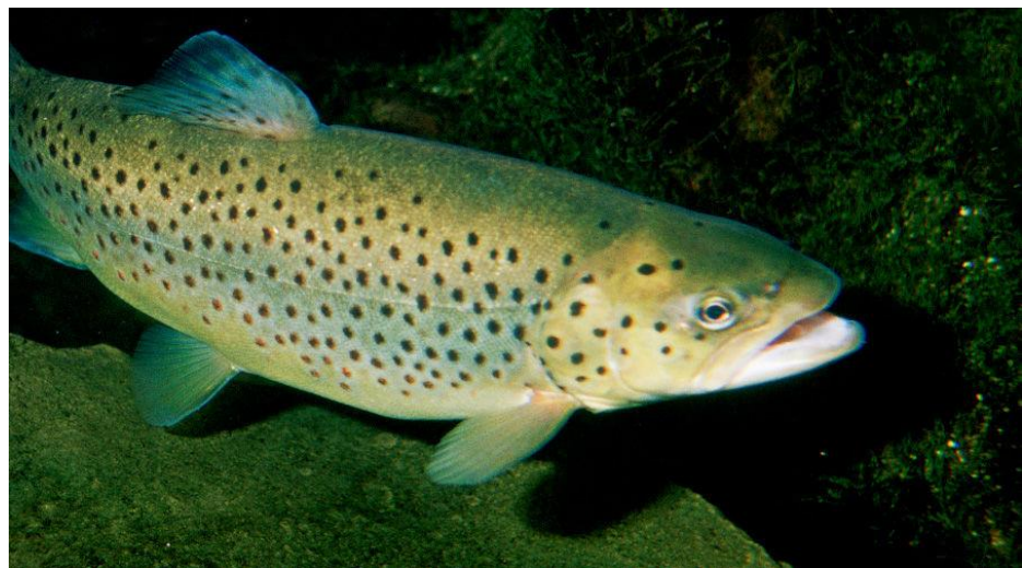
Рис.3.1 Райдужна форель породи «Адлер»

Порода «Адлер». Робота над створенням породи райдужної форелі Адлер розпочалася у 1975 році. У якості початкових форм було використано сталевоголового лосося та райдужну форель. Формування базового маточного стада здійснювалося протягом трьох поколінь за допомогою методу відтворювального схрещування. В процесі відбору особин для маточного стада проводився масовий відбір риб на основі їх ваги та розмірів. Плідники початкового стада відповідали чинним тогочасним стандартам за масою тіла. Проте показники плодючості самок не досягали встановлених норм, а періоди нересту риб відзначалися значною варіативністю у межах сезону. З 1985 року розпочалася робота з консолідації плідників, орієнтована на закріплення ознаки раннього нересту, а також вдосконалення ключових рибогосподарських характеристик, таких як вага тіла, робоча плодючість, середня маса ікринок та виживаність потомства. У процесі створення маточних стад застосовували методи масового відбору разом із сімейною селекцією, що дозволяло підвищувати якість отриманих поколінь риб та сприяти досягненню поставлених цілей (рис. 3.1).