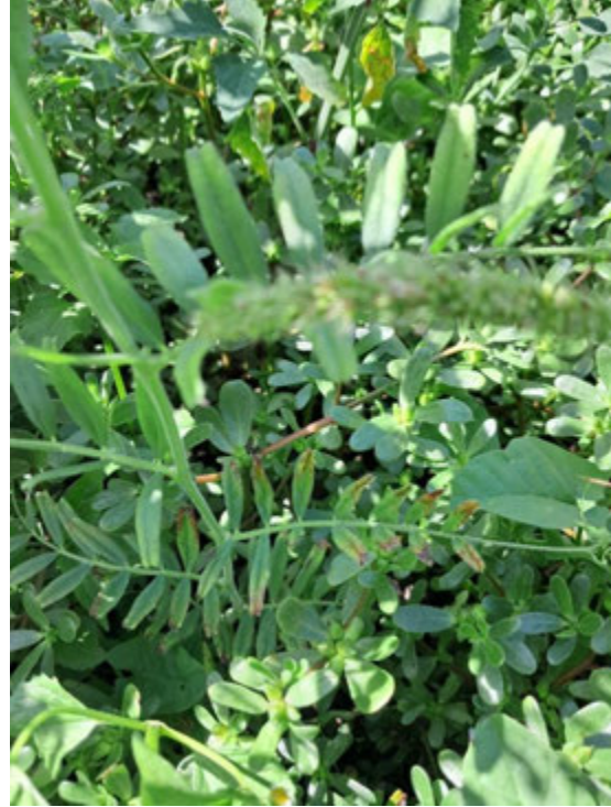
Рисунок 2.1 Дослідні ділянки вики ярої.

Методика обліку передбачає загальну оцінку стану рослин як безпосередньо на полі, так і за допомогою детального аналізу відібраних зразків. Огляд рослин або окремих їх частин проводять переважно в польових умовах, хоча в окремих випадках дослідження можуть здійснюватися в лабораторії. Спосіб відбору проб залежить від характеру поширення захворювання: у разі осередкової ураженості облік проводять на спеціальній ділянці, а при рівномірному розподілі хвороби – за допомогою огляду груп рослин у певному місці без попереднього відбору. Проби збирають відповідно до форми поля – по діагоналі, двох напівдіагоналей, у шаховому порядку чи за іншим підходом, враховуючи особливості ділянки. До основних показників під час обліку належить частота ураження хворобою, тобто відсоткове співвідношення уражених рослин або їхніх частин до загальної кількості обстежених.