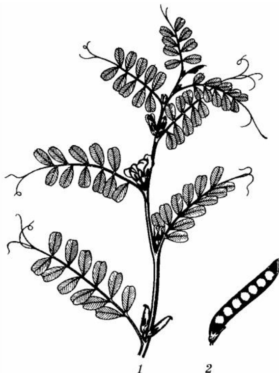
Рис. 87. Вика яра: 1 — гілка з квітками; 2 — плід

що є економічно вигідним і екологічно чистим. Зерна зернових бобових (соя, горох, кормові боби, люпин, вика, чина, нут та ін.) містять більше протеїну (від 20 до 50%), але менше жиру (окрім сої, де його вміст становить близько 20%). Зернобобові культури багаті на рибофлавін, однак містять менше каротину. Щодо енергетичної поживності, вони близькі до ячменю, але трохи відстають від кукурудзи. Крім того, ці культури містять велику кількість незамінних та критичних амінокислот [28].