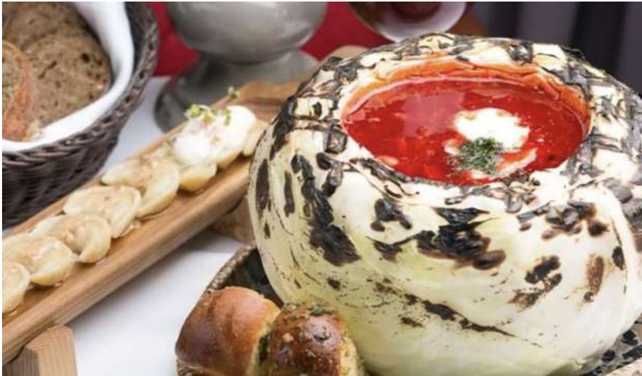
Рис. 2.1. Інтерпретація традиційних українських страв у ресторані "Канапа" (Київ)

Аналіз медіаполя України засвідчує, що тематика трансформації традиційної кухні представлена переважно в розважальному контексті (кулінарні шоу, блоги, сторінки ресторанів у соціальних мережах) та характеризується фрагментарністю й відсутністю системного підходу до висвітлення. Ґрунтовні публікації аналітичного характеру, які б досліджували соціокультурні аспекти модернізації української кухні, зустрічаються досить рідко, переважно у спеціалізованих виданнях з обмеженою цільовою аудиторією.