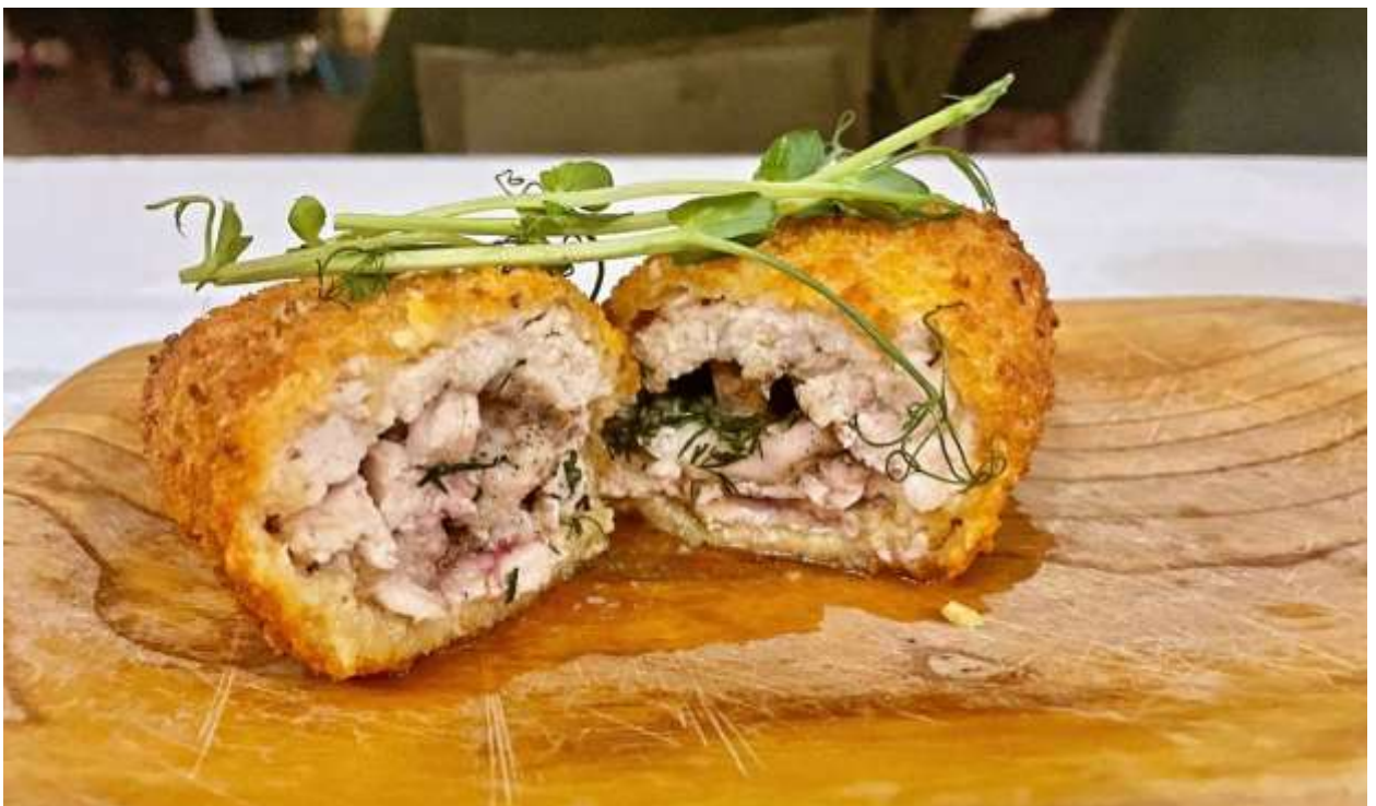
Рис. 2.3. Приклади модернових подач традиційних українських страв

Організаційна структура фоторепортажу передбачає поділ на тематичні