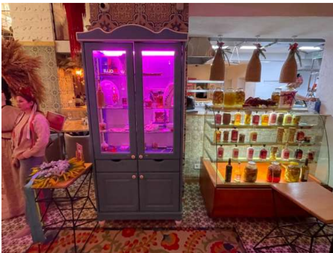
«Галушка» — київський ресторан, що представляє інноваційний підхід до

Структурна організація візуального матеріалу відображає рух від традиційного до інноваційного та демонструє багатогранність підходів до переосмислення кулінарної спадщини – від незначних модифікацій автентичних рецептів до радикальних експериментів з формою, текстурою та інгредієнтами. Паралельно в фоторепортажі простежується географічний вимір трансформацій, що демонструє регіональне різноманіття кулінарних традицій України та специфіку їх сучасних інтерпретацій.