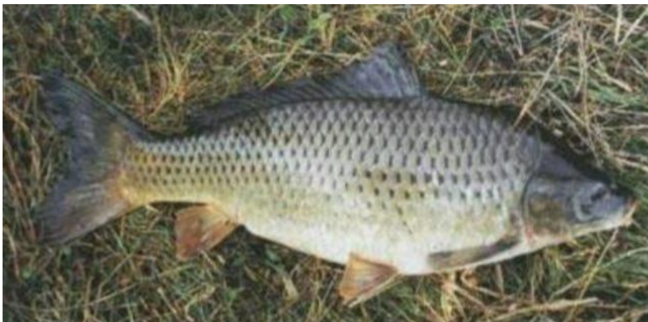
Рис. 1.5.2 Загальний вигляд українського нивківського коропа