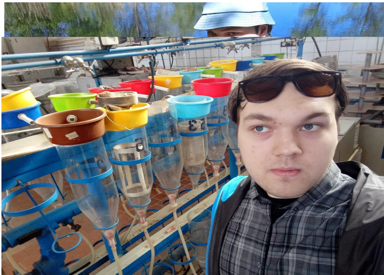
Рис. 2. Фотографія з інкубаційного цеху БЕГС