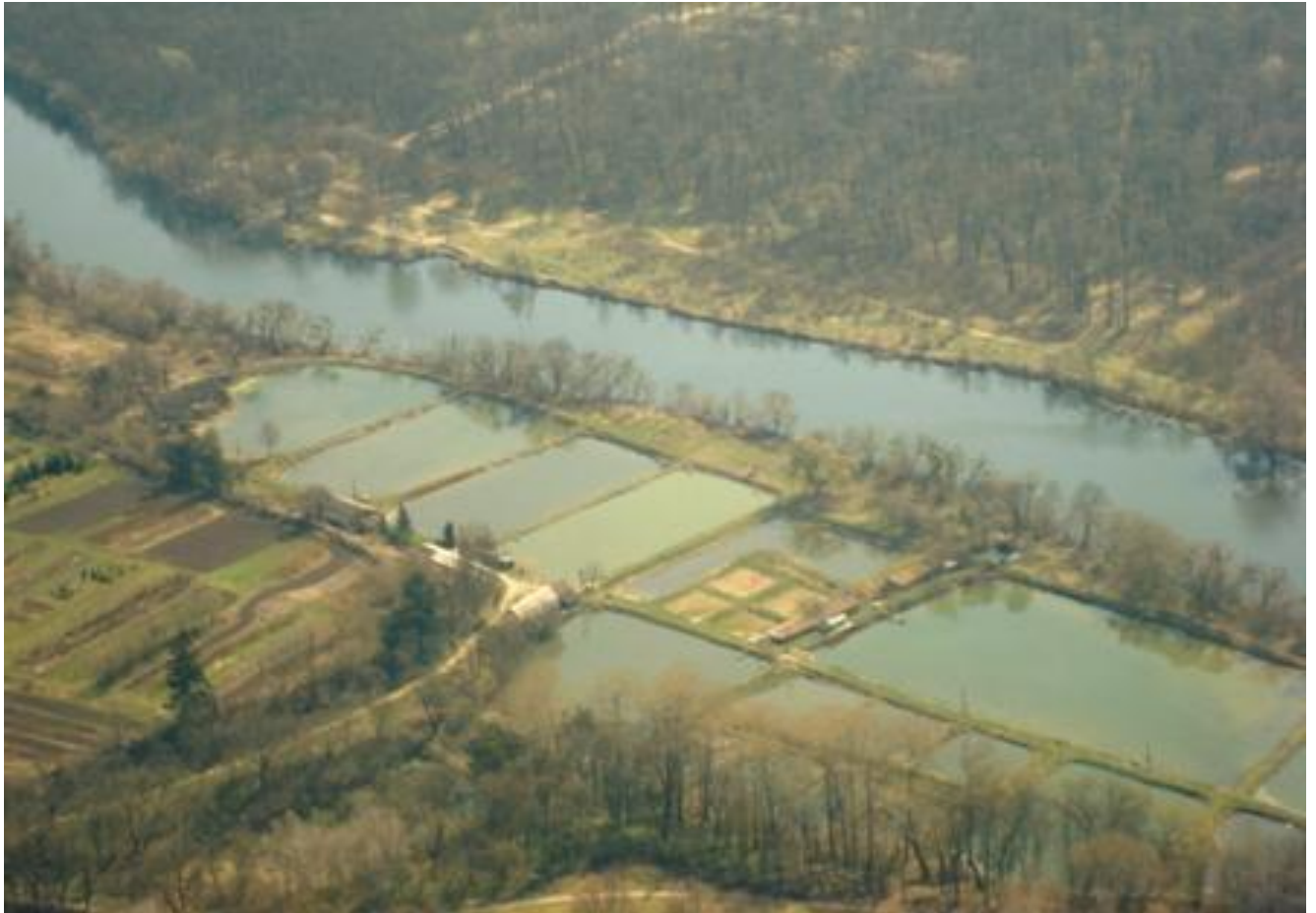
Рис. 3.1.1. Білоцерківська експериментальна гідробіологічна станція

Ставки № 9, 28, 29 здебільшого слугують маточними ставками для коропа та коропа кої; ставки № 5 та 6 виконують роль зимувальних ставків; ставки № 7, 13, 14, а також 9 використовуються для підрощення коропів у полікультурі з іншими видами; 8, 10, 21, 22, 23, 30 є нагульно-виросними ставами; у стані № 24 проводиться вирощування живих кормів.