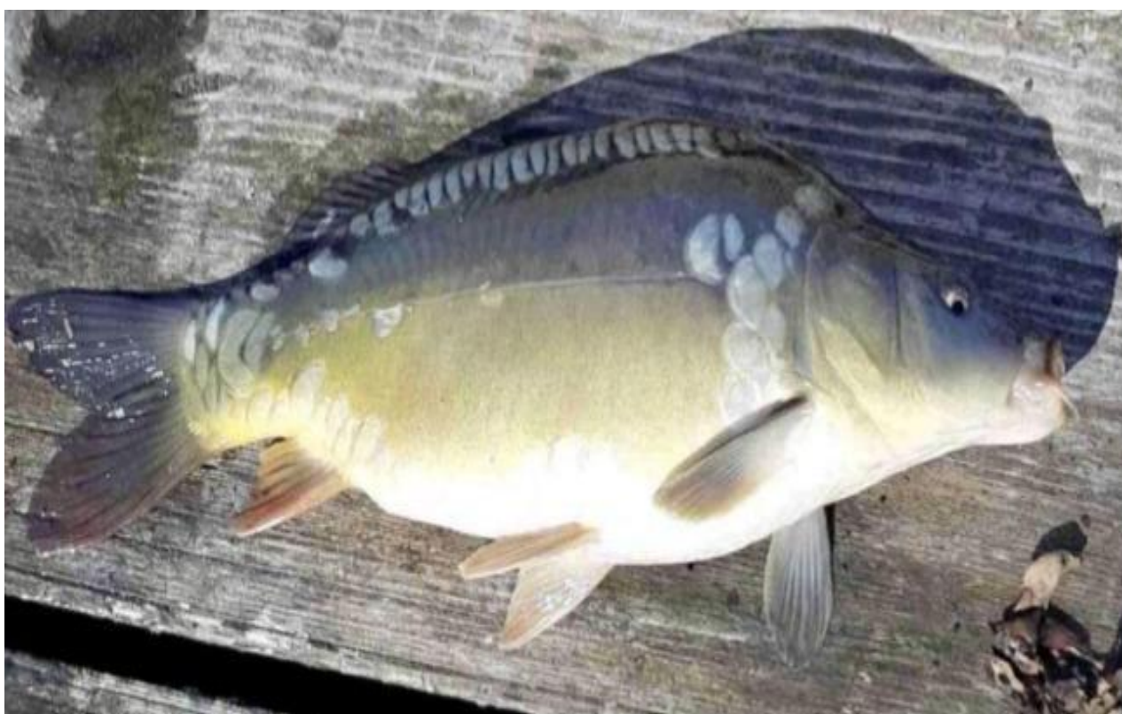
Рис 1.5.1 Загальний вигляд українського рамчастого коропа

Іншим популярним об'єктом аквакультури є короп кої. Це виведена в Японії порода коропа є популярним декоративним об'єктом по всьому світу. Їх різноманітне забарвлення приваблює покупців, і робити їх досить вигідним об'єктом для повномасштабного розведення. Колекціонери готові заплатити значні гроші за певні морфологічні особливості цих риб, що спонукає виробників до виведення нових особин з найрізноманітнішим забарвленням. В Україні налагодженні господарства по їх розведенню, і вони є досить прибутковими.