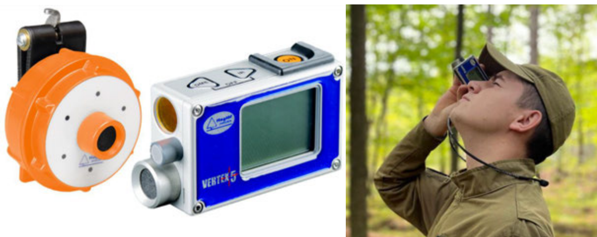
Рис. 2.3. Висотомір/далекомір ультразвуковий Vertex V

Вибір модельних дерев з переліку облікових виконується на основі ступенів товщини. За допомогою спеціалізованого програмного забезпечення формують розподіл певного деревного виду за відповідними ступенями товщини, визначають необхідну кількість та обирають номери кандидатів у модельні дерева за встановленими вимогами. Старший інвентаризаційної групи оглядає потенційні модельні дерева, та приймає рішення про проведення їх обмірів, для них додатково встановлюється дефоляція та дехромація, діаметр на пні та висота дерева. Вимірювання здійснюється з допомогою висотоміра/далекоміра ультразвукового Vertex V рис. 2.3.