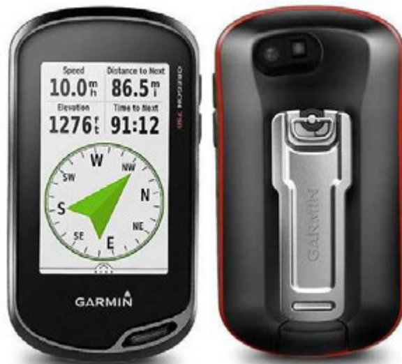
Рис. 2.2. GPS навігатор «Garmin Oregon 750»

Це стосується як переїздів, так і переходів до місця виконання робіт, зокрема від місця базування та між різними інвентаризаційними ділянками. Зібрані дані GPS є важливими для подальшого аналізу та документації. Запис GPS-треку та фіксація координат відбувається за допомогою навігатора «Garmin Oregon 750» рис. 2.2.