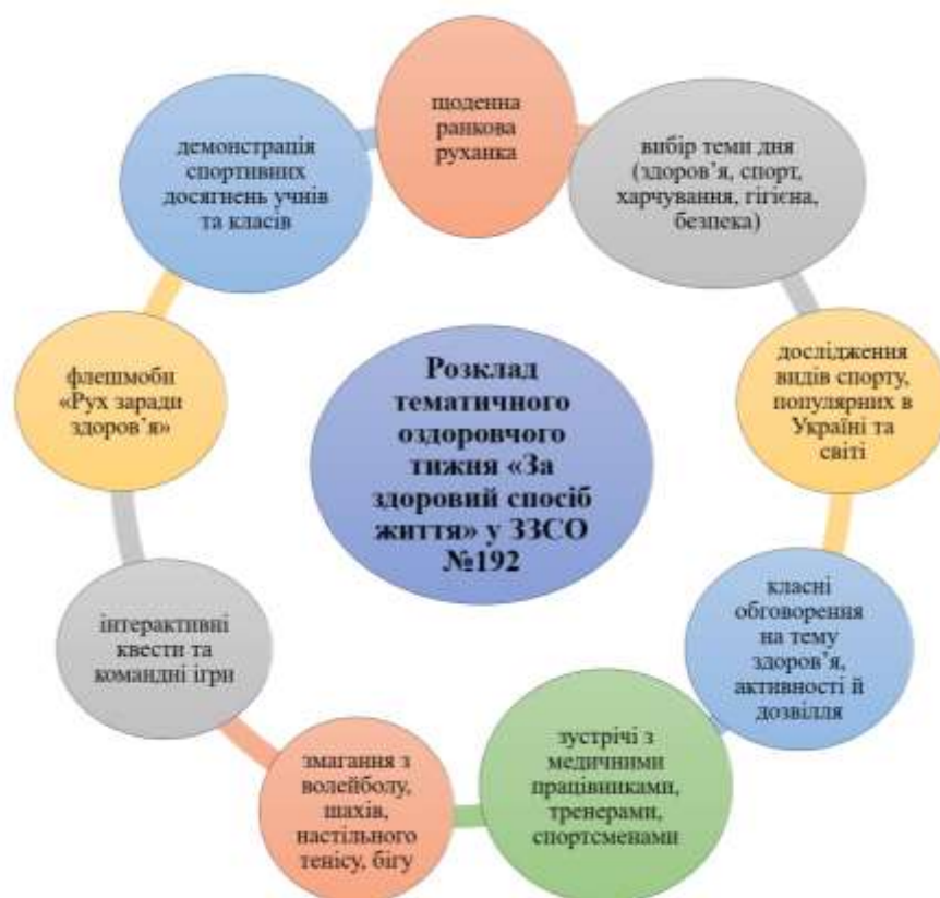
Рис. 2.3. Розклад тематичного оздоровчого тижня «За здоровий спосіб життя» у ЗЗСО № 192 м. Києва

Щороку у ЗЗСО №192 організовується тематичний оздоровчий тиждень «За здоровий спосіб життя», що охоплює такі заходи (див. рис. 2.2) [66].