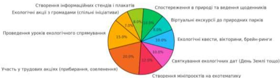
Рис. 2.2. Шляхи здійснення екологічного виховання у ЗЗСО №192 м.

Основними шляхами здійснення екологічного виховання у ЗЗСО № 192, див. рис. 2.2.