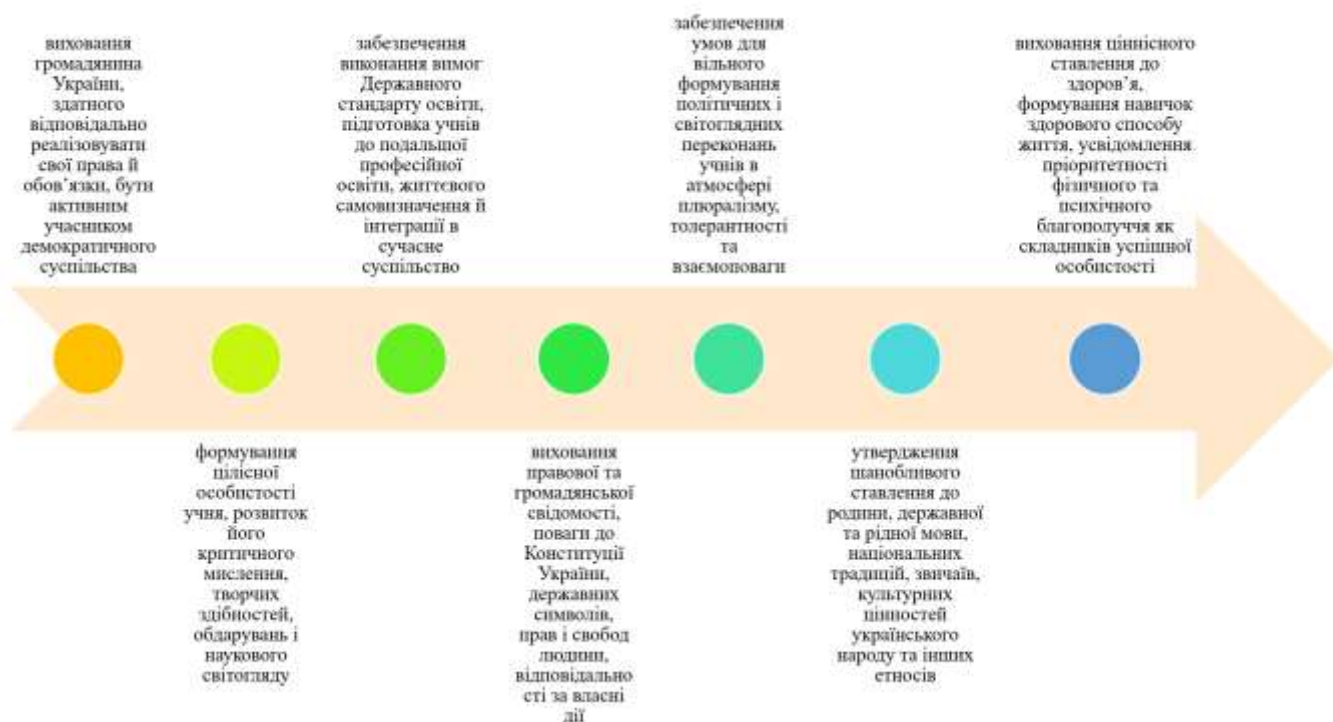
Рис. 1.1. Ключові напрями виховної діяльності класного керівника у закладі загальної середньої освіти

майстерності, а й чіткого стратегічного бачення, співпраці з батьківською громадськістю, ефективної комунікації з іншими учасниками освітнього процесу [46; 48].