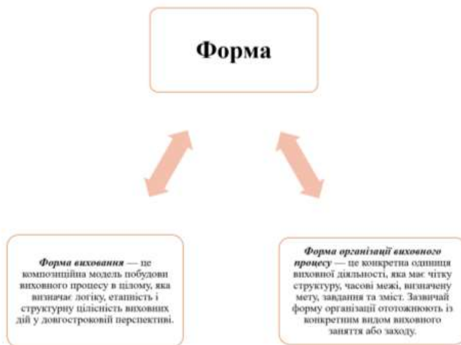
Рис. 1.2. Основні підходи до трактування поняття «форма» у виховному процесі закладу загальної середньої освіти

Сучасна педагогіка розрізняє два основні значення терміну «форма», див. рис. 1.2.