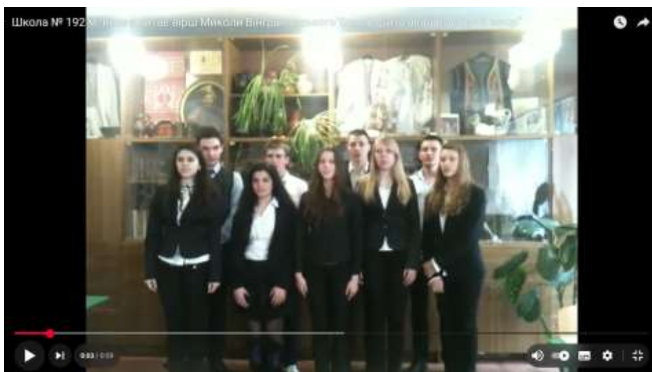
Рис. 2.4. Відео декламації вірша Миколи Вінграновського учнями 11-А класу ЗЗСО № 192 м. Києва

У межах інтелектуально-духовного виховання в ЗЗСО № 192 м. Києва учні беруть участь у літературних читаннях, творчих конкурсах, декламаціях поезій. Прикладом є публічний виступ учнів 11-А класу з читанням вірша Миколи Вінграновського «Сеньйорито акаціє, добрий вечір», розміщений у відкритому доступі на платформі YouTube, див. рис. 2.4. Відео ілюструє зацікавленість старшокласників українською літературою та розвиток їх естетичного, морального й емоційного потенціалу [67].