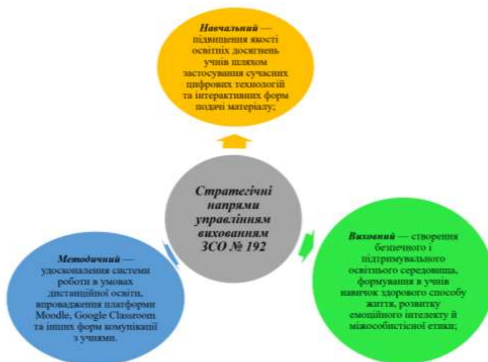
Рис. 2.1. Стратегічні напрями управління вихованням у ЗЗСО № 192 м. Києва

Протягом навчального року колектив школи працював над розв'язанням трьох стратегічних напрямів, які подані на рис. 2.1. [64].