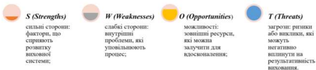
Рис. 2.6. Основні категорії SWOT-аналізу виховної діяльності у ЗЗСО № 192 м. Києва

SWOT-аналіз у межах виховної діяльності охоплює такі основні категорії, див. рис. 2.6.