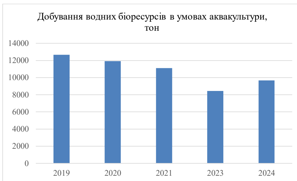
Рисунок 1.1 - Добування водних біоресурсів в умовах аквакультури [5]

В обсягу добування водних біоресурсів в умовах аквакультури спостерігається загальна тенденція до зниження. Добування з 2018 року до 2023 року наведено на рис. 1.1.