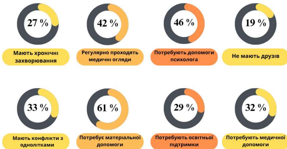
Рис. 3.2. Самопочуття, здоров'я, взаємини та потреби дітей з сімей, які опинилися у складних життєвих обставинах

Здоров'я дитини є одним із найважливіших факторів, що визначає її фізичний та психосоціальний розвиток, рівень успішності в навчанні, здатність до соціальної адаптації та загальну якість життя. Уразливі категорії дітей, зокрема ті, що виховуються в сім'ях із низьким рівнем соціально-економічного забезпечення, перебувають у групі ризику щодо виникнення та загострення різноманітних захворювань.