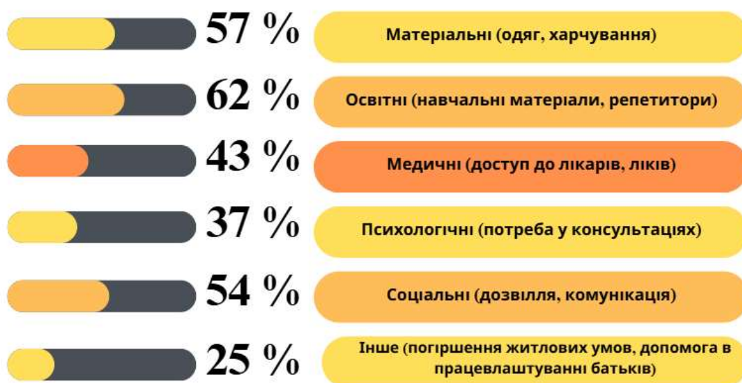
Рис. 3.3. Потреби дітей із сімей у складних життєвих обставинах, які залишаються незадоволеними за оцінкою соціальних працівників

Аналіз незадоволених потреб виявив кілька критичних напрямків, які вимагають особливої уваги. Однією з найбільших незадоволених потреб є освітня підтримка. За даними опитування, 62% соціальних працівників вказали, що найбільше потребують підтримки діти в навчальному процесі – це і навчальні матеріали, і доступ до репетиторів, і допомога з підготовкою домашніх завдань.