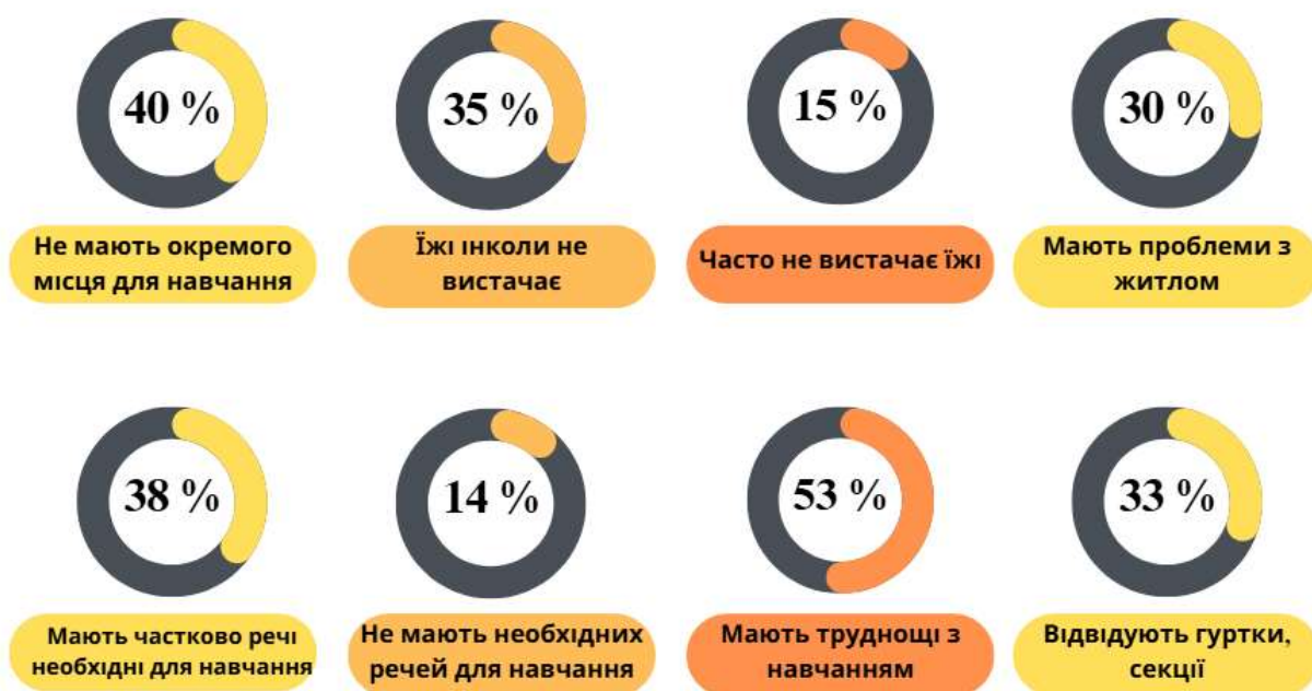
Рис 3.1. Умови життя, навчання та дозвілля дітей з сімей, які опинилися у складних життєвих обставинах