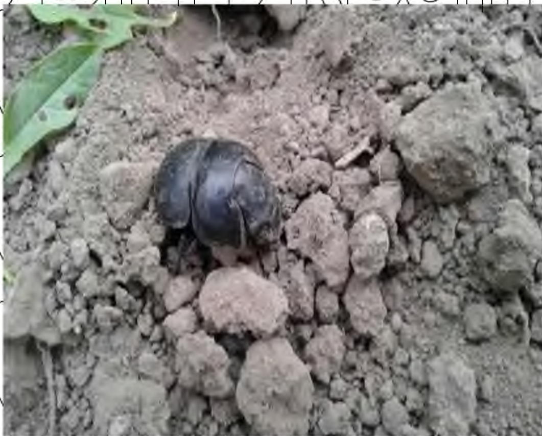
Рис. 4.2. Кравчик-головач, або жук – стригунець

Кравчик-головач – Lethrus apterus Laxm. (ряд Coleoptera, родина пластинчастовусі – Scarabaeidae) – поліфаг, який пошкоджує практично всі культури і дикорослі рослини, відає перевагу молодим пагонам і листкам, які щойно відросли (рис. 4.2). Цей шкідник широко розповсюджений в Лівобережному Степу України. Шкідливість його полягає в тому, що рано навесні кравчик грубо об'їдає сходи соняшнику