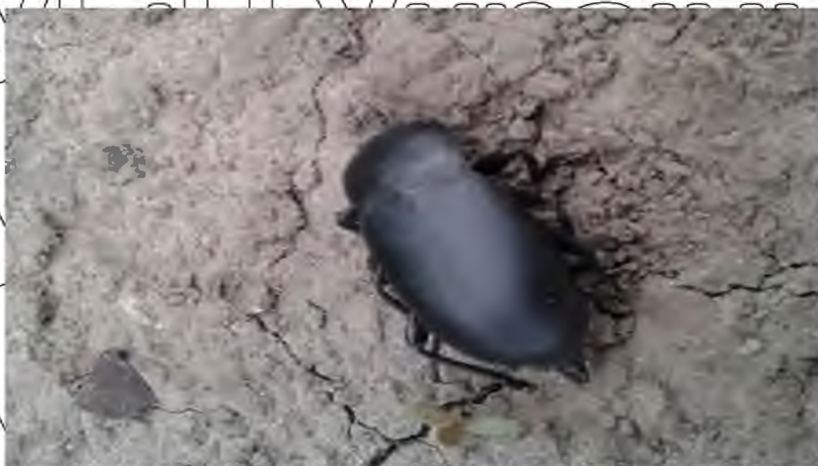
Рис 4.5. Мідляк широкогрудий імаго ( Blaps lethifera Marsh.)

Найбільшої шкоди наносять дорослі жуки (Рис. 4.5). Личинки мідляків є одними з найбільш розповсюджених ґрунтових шкідників – пошкоджують насіння, сходи, підземну частину стебла, кореневу шийку і кореневу систему рослин соняшнику [3].