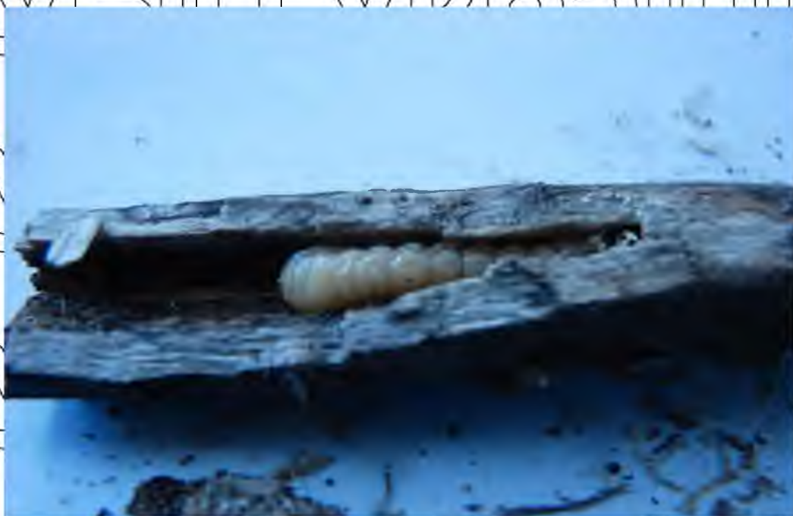
Рис. 5. 1. Пошкодження стебел соняшнику личинкою південної соняшникової шипоноски

За обстежень дослідних ділянок та фермерських господарств було знайдено жук південної соняшникової шипоноски.