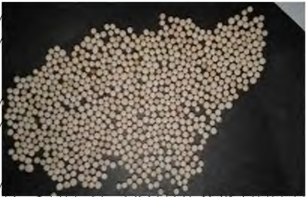
Рис. 2.3. Яйця відкладені лучним метеликом

В досліді застосували Децис f-Люкс 25 ЕС, КЕ (дельтаметрин, 25 г/л) з нормою витрати препарату 0,3 л/га і 0,5 л/га; Енжіо 247 SC, КС (лямбда-цигалотрин, 106 г/л + гаметоксам, 141 г/л) з нормою витрати 0,18 л/га і 0,20 л/га; Кораген 20, КС (хлорантранліпрол, 200 г/л) з нормою витрати препарату 0,15 л/га і 0,2 л/га [20]. Обприскування посівів соняшнику провели ОП-2000.