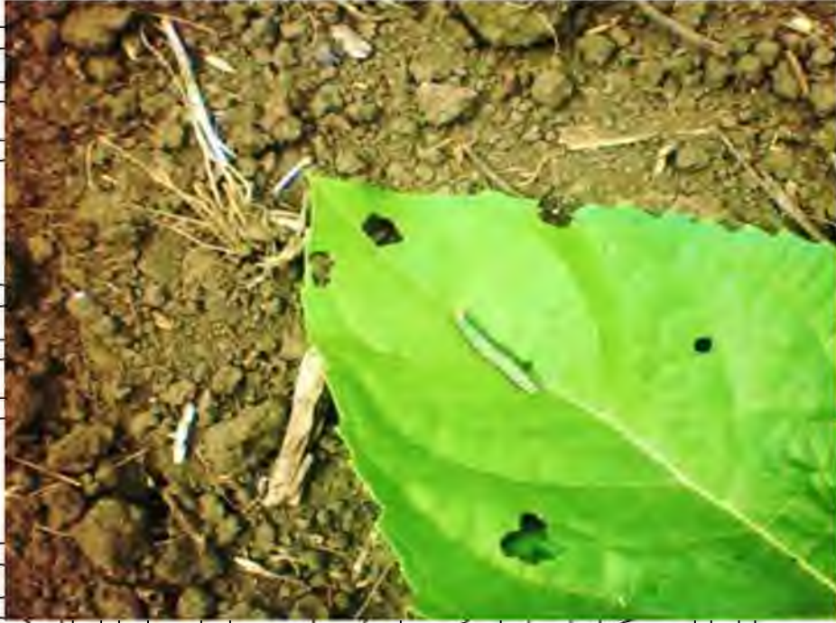
Рис. 4.8. Пощкодження посівів соняшнику гусеницями лучного метелика II покоління

Розвиток фітофага третьої генерації відбувався з кінця серпня до кінця вересня.