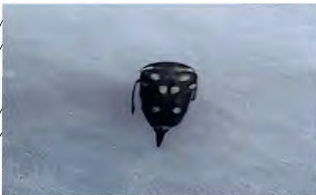
Рис. 3.2 Жук соняшникової шипоноски

Протягом вересня – жовтня за обстежень дослідник ділянок та фермерських господарств на наявність шкідників, було виявлено личинки південної соняшникової шипоноски, як у стеблах рослин соняшнику, так і в його коренях. Личинки живились внутрішнім змістом стебел соняшнику і прогризали галереї при цьому рухались в напрямку вниз до кореня (рис. 3.3).