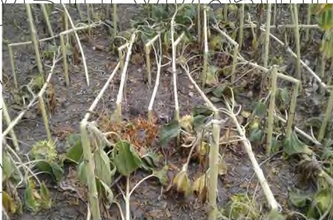
Рис. 3.4. Пошкодженні стебла соняшника південною соняшниковою шипоноскою та зламані під дією вітру

Пошкоджені південною соняшниковою шипоноскою стебла соняшника ламаються під дією вітру. Урожайність значно знижується (рис. 3.4).