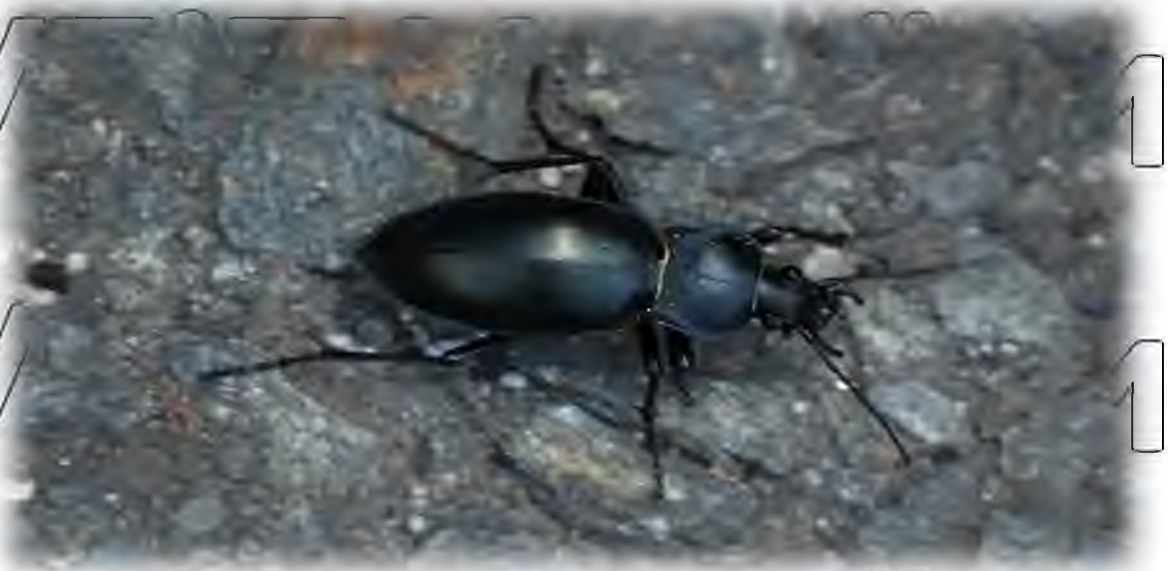
Рис. 6.1. Журуноуклий маго Carabus glabratus

Метою дослідження було з'ясування складу та динаміки активності (на основі щільності) населення жуків з родини журунів (Carabidae). Окрім цього шкідників виявлено за допомогою ґрунтових розкопок, носіння санком та при маршрутних обстеженнях (рис. 6.1).