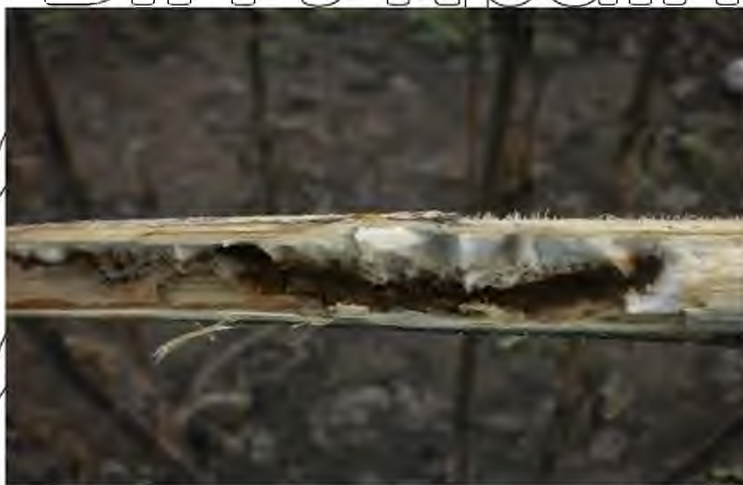
Рис. 3.3. Галереї, прогризені личинкою південної соняшникової шипоноски

Протягом вересня – жовтня за обстежень дослідник ділянок та фермерських господарств на наявність шкідників, було виявлено личинки південної соняшникової шипоноски, як у стеблах рослин соняшнику, так і в його коренях. Личинки живились внутрішнім змістом стебел соняшнику і прогризали галереї при цьому рухались в напрямку вниз до кореня (рис. 3.3).