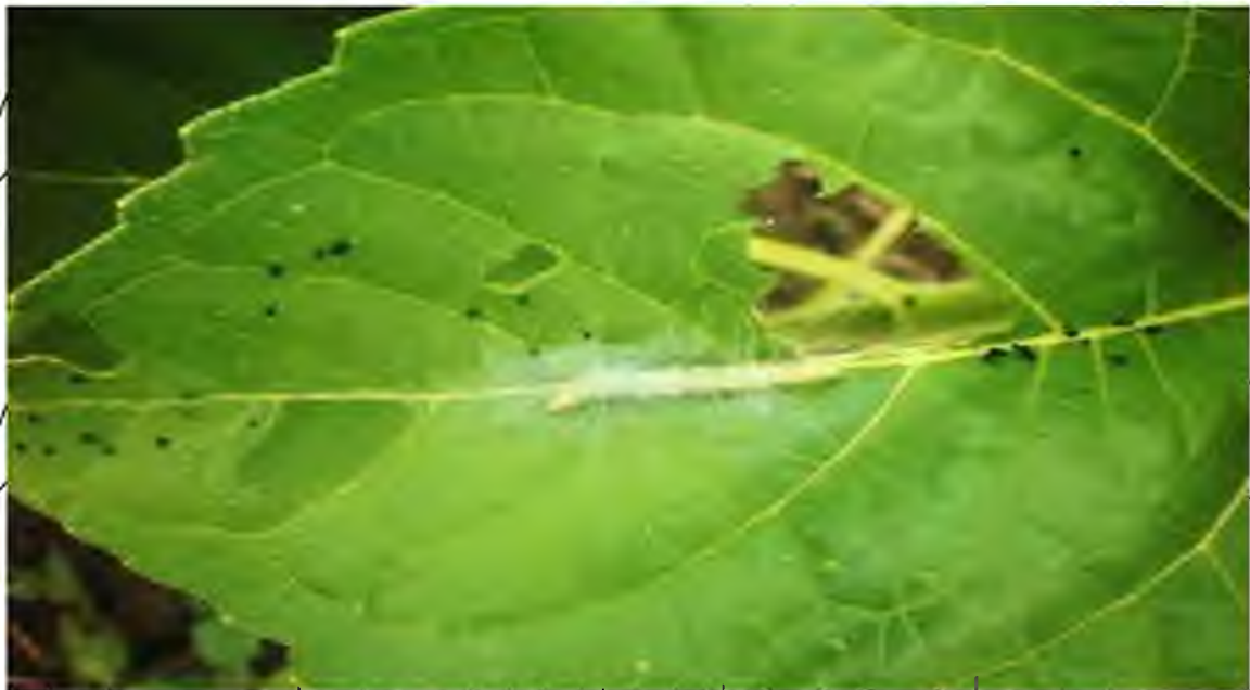
Рис. 4.7. Гусениці II покоління лучного метелика на посівах соняшнику

Літ метеликів II-го покоління розпочався з середини червня. Гусеницями другого покоління було заселено 8 – 28 % рослин на 17 – 45 % площ соняшнику, кукурудзи, за чисельності від 2 до 12 екз./м 2 , максимально – до 30 – 65 % рослин за чисельності до 20 екз./м 2 , що на межі порогу шкідливості (рис. 4.7, 4.8.).