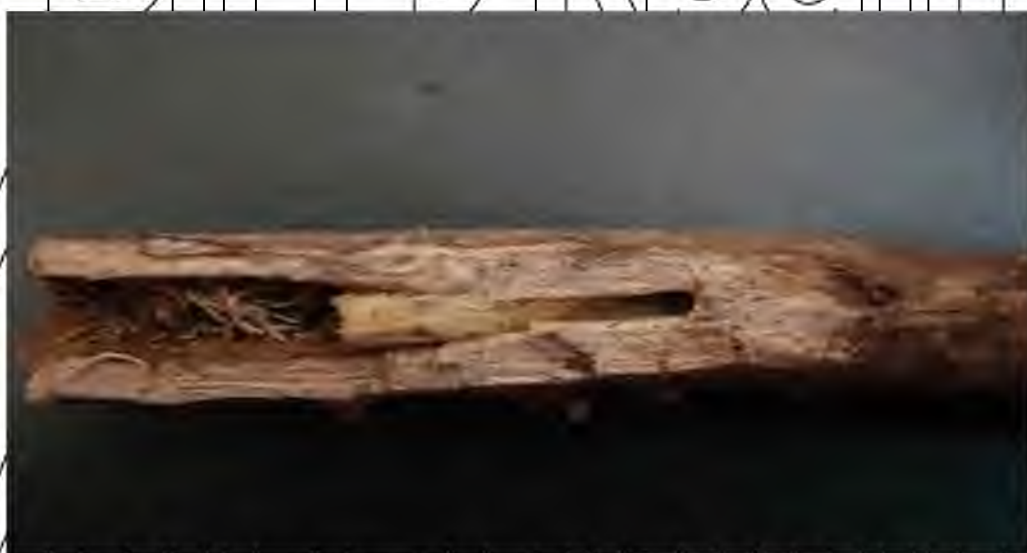
Рис. 2.2. Розвиток імаго соняшникового вусача в лабораторних умовах