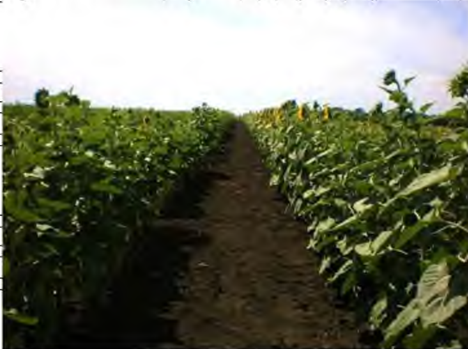
Рис. 4.9. Обстеження посівів соняшнику на заселеність п'ядуноків

Сила льоту метеликів була 3 – 40 екз. на 10 кроків. Чисельність гусениць була меншою ніж попередньої генерації (2 – 6 екз./м 2 , максимум 32 екз./м 2 ) (рис. 4.9.).