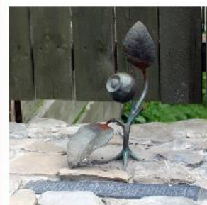
Пам'ятник чорниці, с. Гукливе