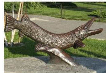
Пам'ятник кременчуцькій щуці, м. Кременчук

Пам'ятники присвячені продуктам та стравам в Україні