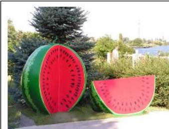
Пам'ятник кавуну, м. Гола Пристань