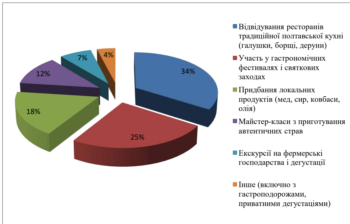
Рис. 2.3. Вподобання туристів щодо гастрономічних приваб Полтави (розподіл у відсотках)

Представлені дані дають змогу чітко унаочнити, які саме гастрономічні враження є найбільш привабливими для відвідувачів Полтави, а також визначити потенційні зони для розвитку нових туристичних продуктів у сфері кулінарного туризму.