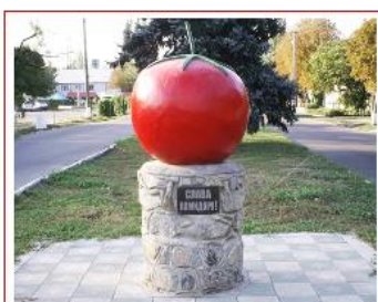
Пам'ятник «славетному» помідору, м. Кам'янка-Дністровська