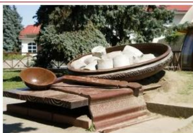
Пам'ятник полтавській галушці, м. Полтава

Пам'ятники присвячені продуктам та стравам в Україні