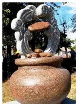
Пам'ятник поліському деруну, м. Коростень