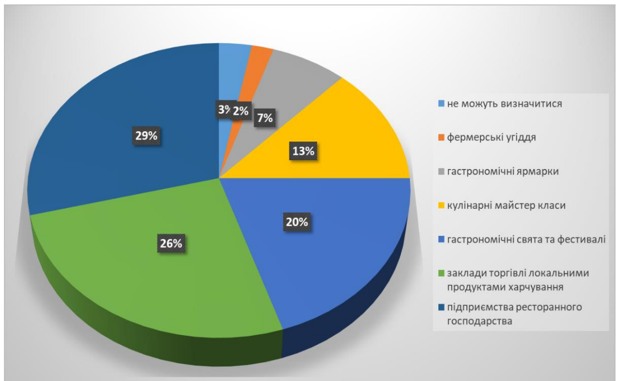
Рис. 2.1. Об'єкти гастрономічного туризму України, які користуються попитом у туристів

господарства — на їхню користь висловилися 29% респондентів. Це свідчить про те, що відвідування ресторанів, кафе, тематичних закладів з автентичною українською кухнею залишається найбільш поширеною формою гастрономічного туризму. Серед чинників такої популярності можна виділити комфортні умови, широкий вибір страв, можливість швидко ознайомитися з регіональними особливостями кухні.