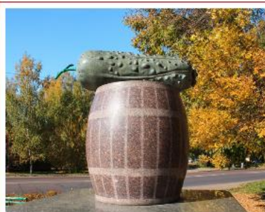
Пам'ятник ніжинському огірку, м. Ніжин