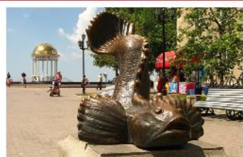
Пам'ятник бичку-годувальнику, м. Бердянськ