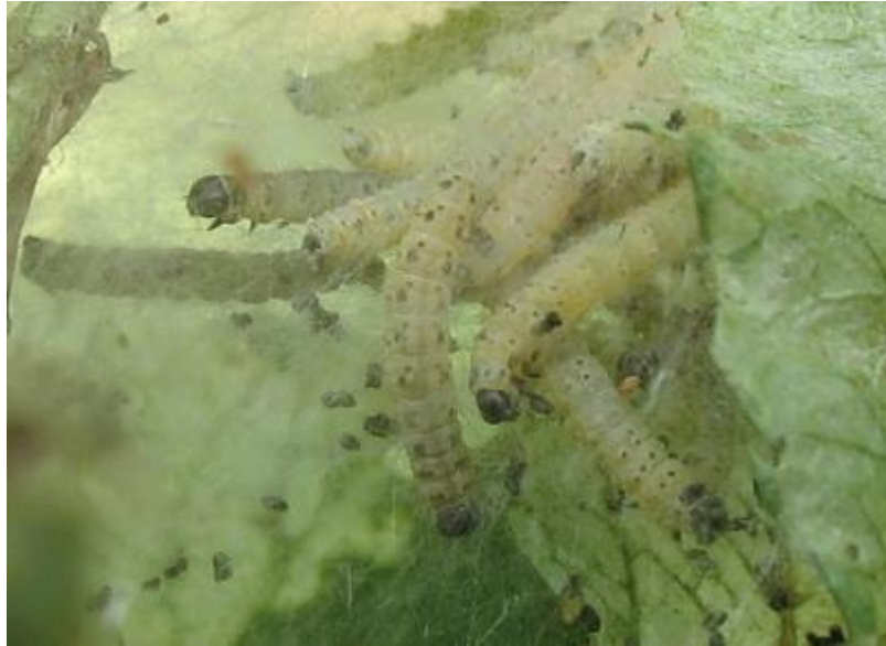
Рис. 5. Пошкодження листків гусеницями молі на яблуні сорту Айдаред, НДП «Плодоовочевий сад» НУБіП України, 2024 р.