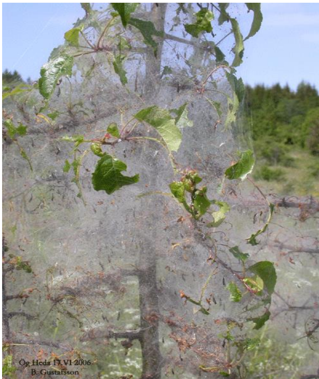
Рис. 1. 100% знищення листкової маси яблуні за масових спалахів (За Ög Heda, 2014 р.)

діапаузи. Розвивається горностаєва міль в одному поколінні за вегетаційний період.