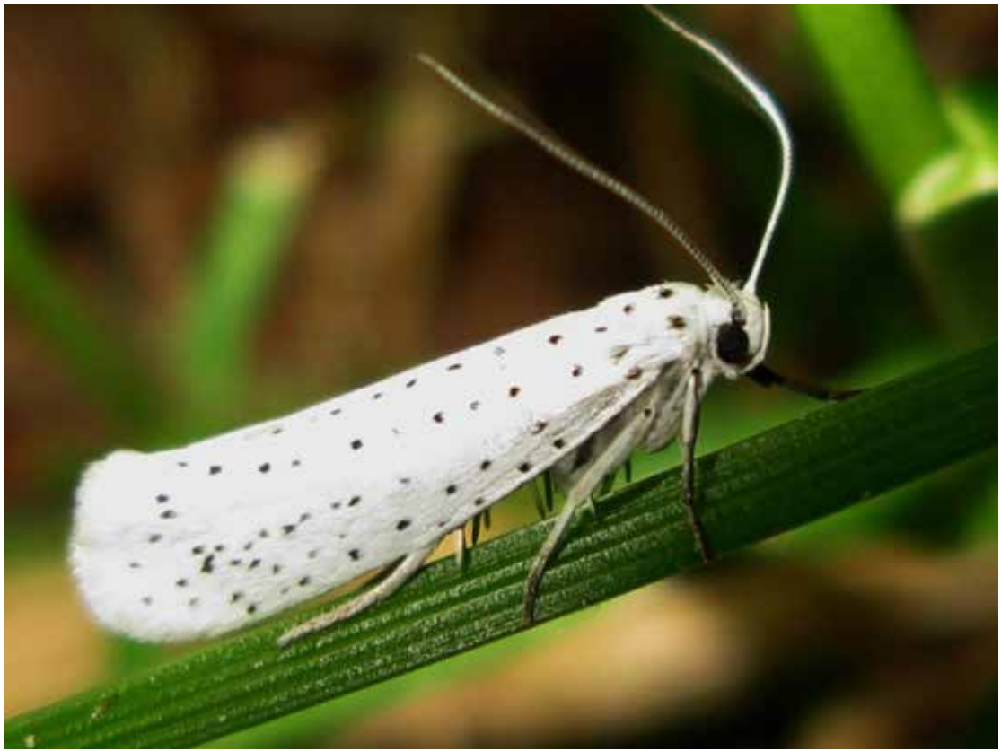
Рис. 2. Метелик яблуневої молі (За Og Neda, 2019 р.)

Першого віку під щитками, зимують гусениці. Навесні, вони виходять з під щитків і відразу проникають усередину бруньок при досягненні середньодобової температури 12 °С, через 4 – 5 діб після початку розпускання бруньок яблуні та під молодого листя епідерміс. Живляться в мінах епідермісом впродовж 9 – 12 діб гусениці. Що збігається в часі з цвітінням яблуні, після першого линяння, гусениці залишають міни, переходячи де плетуть павутинні гнізда й скелетують листки на поверхню листя. Обгризаючи листя, кожна група гусениць, переміщується від верхівки до основи гілок, обплітаючи їх павутиною густою. У листових мінах, триває 40 – 45 діб, живлення гусениць, з урахуванням часу перебування їх. Вони проходять п'ять віків за цей період. Прохолодна і волога - зумовлює підвищену смертність гусениць, а суха й спекотна погода сприяє їх розвитку, і навпаки.