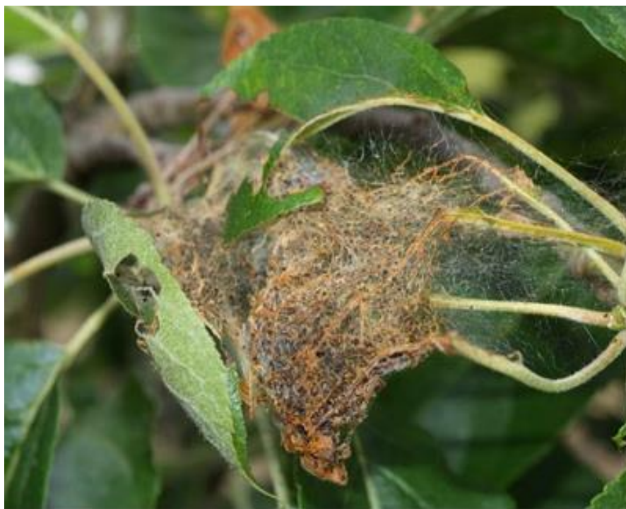
Рис. 3. Заселеність яблуни плодовими моллями, 2020 р.

На основі Bacillus thuringiensis проти гусениць різних віків горностаєвих молей Експериментально встановлено ефективність бактеріальних препаратів. Загибель гусениць їх від біологічних препаратів бітоксубациліну, дендробациліну, ентобактерину, діпелу в 0,5- 1,0%-му розведенні становить 93,7-99% [14]. Шкодочинність плодової молі на присадибних ділянках дещо більша в порівнянні з плодовими промисловими насадженнями. Враховуючи реальну, недостатню висвітленість даного питання у фаховій літературі, проводять лабораторні й польові дослідження з вивчення дії бактеріальних препаратів проти гусениць, багато науковців проводять плодової молі, тощо спостереження за станом популяції плодової молі [16, 18].