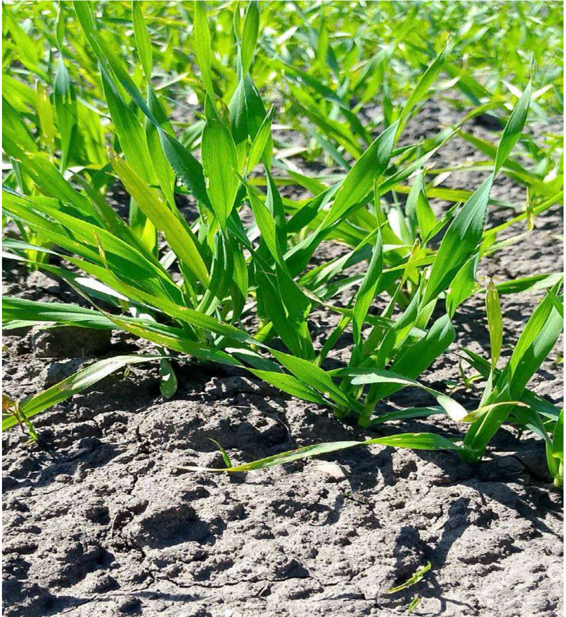
Рис.3.2.Ячмінь на варіанті без добрив на 30 день вегетації

Варіант з використанням N50-вермикомпост показав зменшення ваги для ячменю, де вага ячменю становила 214 г для зеленої маси та 27,82 г для сухої речовини. Варіант без використання добрив показав зменшення ваги для гороху, де вага становила 132 г для зеленої маси та 27,72 г для сухої речовини. Варіант з використанням N25 компост+N25 мінеральне добриво показав зменшення ваги для бобів, де вага становила 138 г для зеленої маси та 22,08 г для сухої речовини.