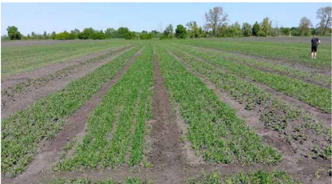
Рис.2.1. Демонстративне фото дослідної ділянки.

Об'єктом дослідження є сумісні посіви сільськогосподарських культур та ґрунт. Сумісні посіви відносяться до агрономічної практики, де дві або більше різні культури вирощуються на одній і тій же земельній ділянці в один і той же вегетаційний сезон. Об'єктом дослідження передбачається вивчення впливу ґрунтових умов і різних елементів технологій вирощування на продуктивність та якість сумісних посівів.