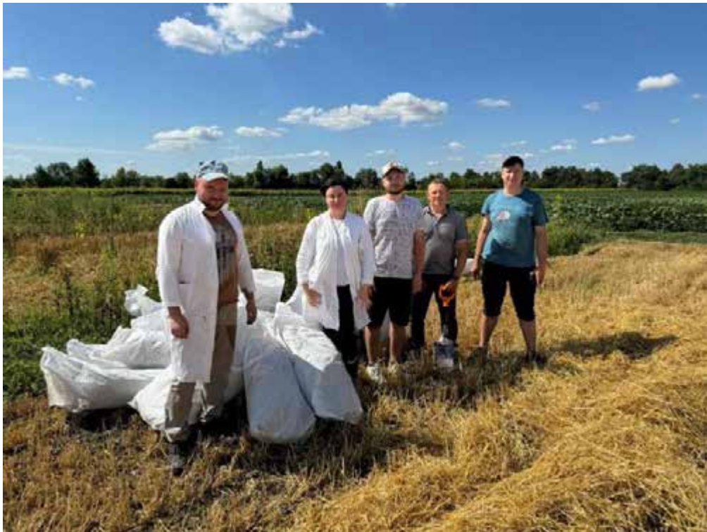
Рис3.3. Дослідна ділянка на 90-й день вегетації

У варіанті без добрив, вага ячменю становила 576 грами в зеленій масі, і вага насіння складала 495,36 грама на квадратний метр. Вага гороху була 135 грам в зеленій масі та 116,1 грама на квадратний метр. Коли вага кормових бобів становила 140 грама в зеленій масі та 120,4 грама на квадратний метр.