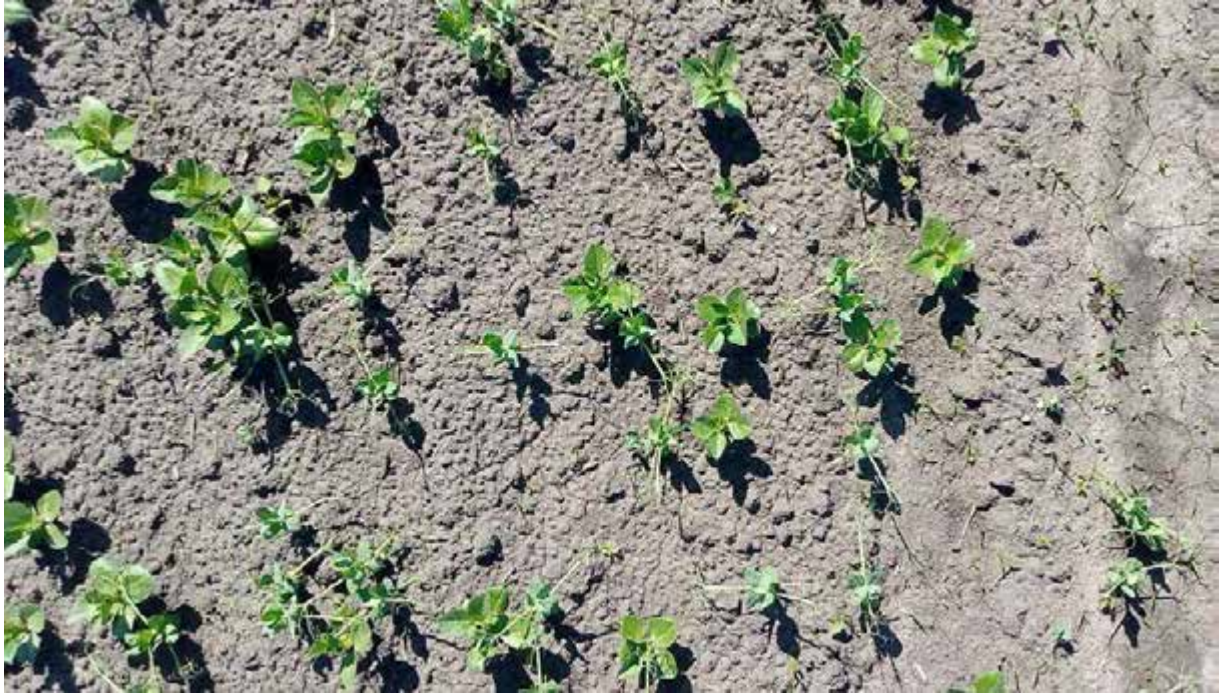
Рис.3.1 Сходи гороху на варіанті без добрив

Варіанти N_{25} компост+ N_{25} мінеральне добриво та N_{50} -вермикомпост також показали певний позитивний вплив, збільшивши кількість сходів ячменю, гороху та кормових бобів порівняно з варіантом без добрив. Кількість сходів гороху була найвищою в варіанті N_{50} -аміачна селітра та N_{25} -вермикомпост+ N_{25} мінеральне добриво (30 сходів на квадратний метр), тоді як кількість сходів ячменю була найвищою в варіанті N_{50} -компост (130 сходів на квадратний метр) та для кормових бобів найбільша кількість сходів була майже на всіх варіантах окрім N_{50} -вермикомпост та N_{50} -аміачна селітра (22 сходів на квадратний метр).