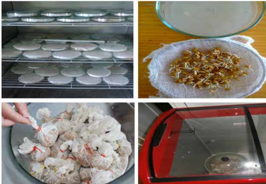
Рис. 6.1. Проморожування проростків у марлевих мішечках (МП)[10]