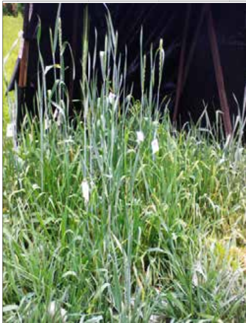
Рис. 8.2. Рослини під час вегетації: а) за скороченого світлового дня; б) за природного світлового дня (контроль) (МІП) [9]