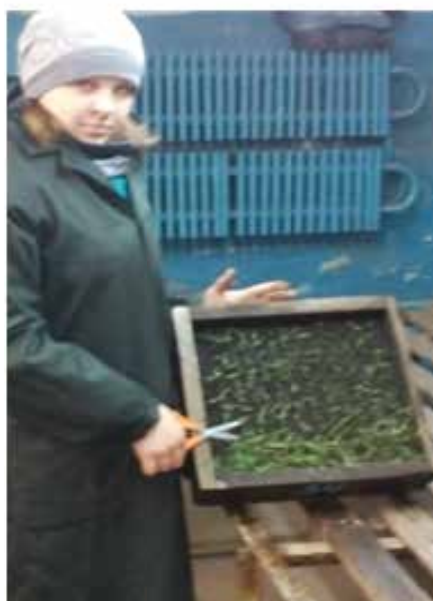
Рис. 6.3. Оцінка морозостійкості у висівних ящиках (МПП) [10]

Дослідний матеріал висівають у висівні ящики в рядки по 20 – 25 насінин в кожному і насипають зверху ґрунт. Після висіву зразки встановлюють на вегетаційному майданчику, а після проходження фаз загартування їх транспортують і поміщають в низькотемпературні камери (КНТ – 1М). Надалі проморожування проводять при двох температурах, починаючи зниження температури у камерах з температури навколишнього середовища з інтервалом 2°C на 1 год до заданої температури. Експозиція проморожування 24 год. Після поступового їх розмерзання (2 доби) рослини в ящиках поміщають в приміщення і підготовлюють їх до відрощування. Попередній підрахунок живих і загблих рослин проводять через 10–12 діб, остаточний – через 15–16 діб.