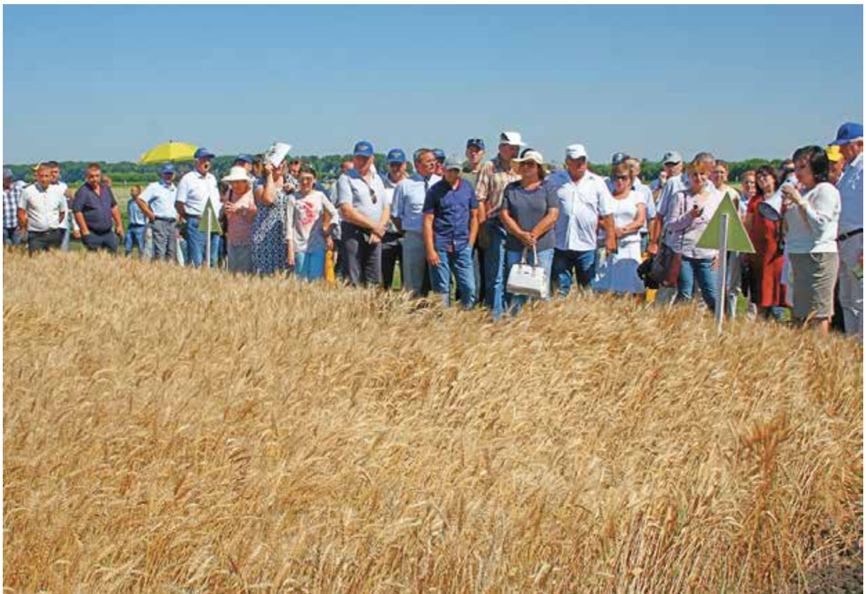
Рис. 1.1. Виставково-інноваційний центр НААН України, демонстраційне поле

Наведене є лише частиною сільськогосподарських культур вітчизняної селекції, які постійно висіваються у Виставково-інноваційному центрі НААН України на Київщині для широкої демонстрації і наочної пропаганди кращих вітчизняних сортів та гібридів останніх років. Цей постійно діючий центр було створено у 2009 р. на базі ДП ДГ «Саливонківське» Інституту біоенергетичних культур і цукрових буряків НААН України в с. Ксаверівка Друга. Відтоді щороку тут на демонстраційному полі площею 76,4 га за 10-пільною сівозміною із застосуванням інтенсивних технологій висівають кращі розробки вітчизняних наукових установ мережі НААН України, які знайшли своє застосування в агропідприємствах і ті, які лише пробивають собі дорогу (рис. 1.1).