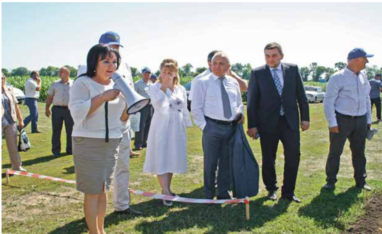
Рис. 1.2. Директор Інституту зрошуваного землеробства НААН Раїса Вожегова доповідає про селекційні досягнення інституту

Здобутки Інституту зрошуваного землеробства НААН презентувала директор наукової установи Раїса Вожегова. Вона зазначила, що це єдиний в Україні інститут, який працює над розв'язанням фундаментальних і прикладних завдань ведення землеробства на зрошуваних землях. Другим важливим напрямком його роботи є створення нових посухостійких сортів для умов ризикованого землеробства в жорстких посушливих умовах, на богарі (рис. 1.2).