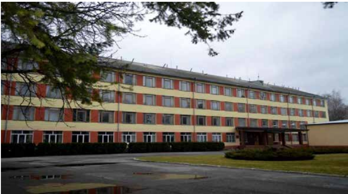
Рис. 2.1 - Корпус ННЦ „Інститут землеробства НААН”

Польові дослідження проводили в відділі кормовиробництва ННЦ „Інститут землеробства НААН”, на території с. Чабани Фастівського району Київської області, яке відноситься до Київського агроґрунтового району (рис. 2.1).