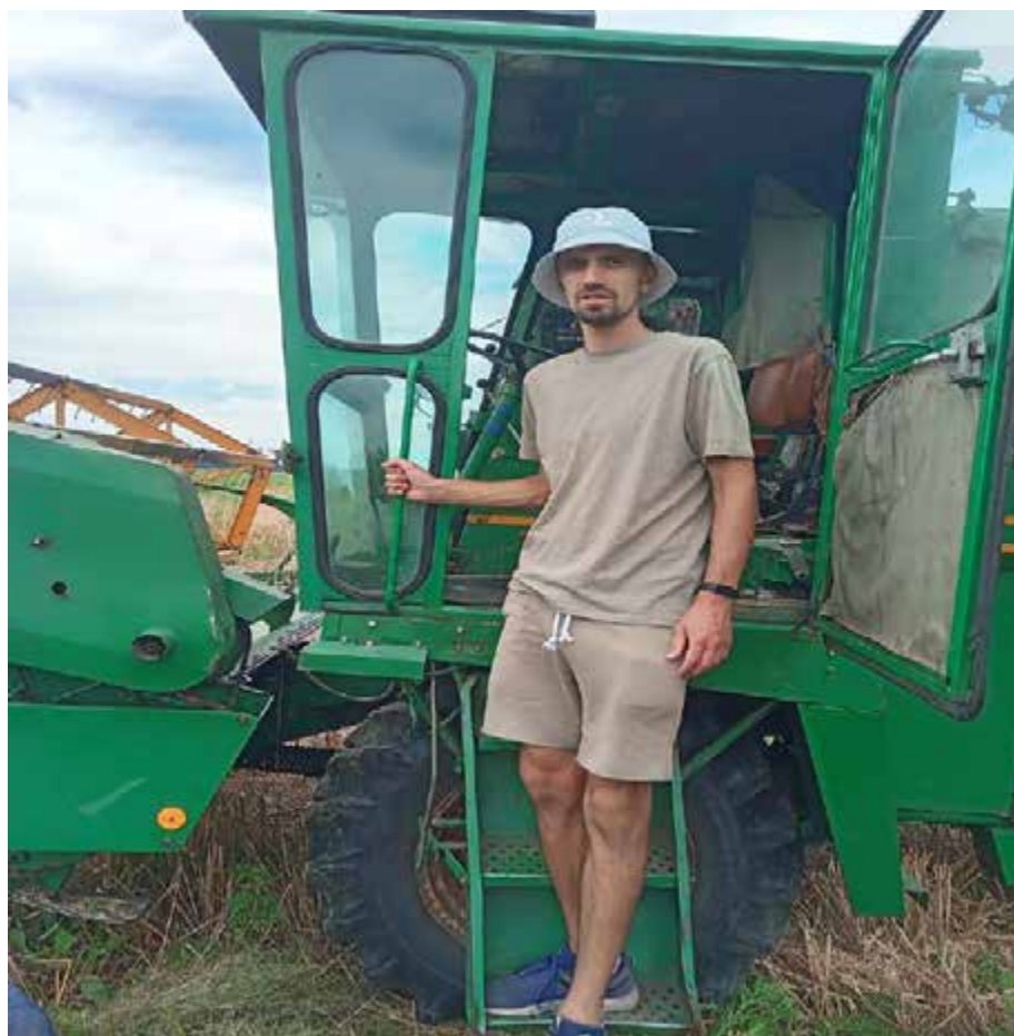
Рис.3.2. Під час збирання насіння зразків конюшини лучної