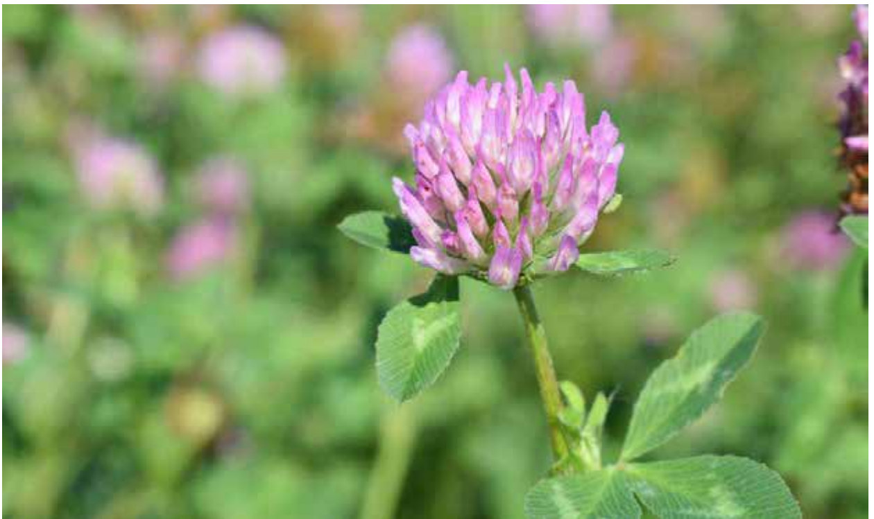
Рис.3.3. Суцвіття голівка зразка 08/17.

Кількість квіток в суцвіттях коливалась від 78,7 шт. у зразка №08/17 до 96,1шт. у зразка № 03/19 (Рис.3.3). Високі показники прояву ознаки мали зразки №№02/19, 07/17 та стандарт- сорт Полісянка – більше 90 квіток в голівці. При проведенні досліджень за цією ознакою ми не виявили жодного зразка, який би статистично достовірно перевищив стандарт. На нашу думку, збільшення квіток є можливим тільки за рахунок виникнення фасціації суцвітть, що приводить до утворення подвійних суцвітть.