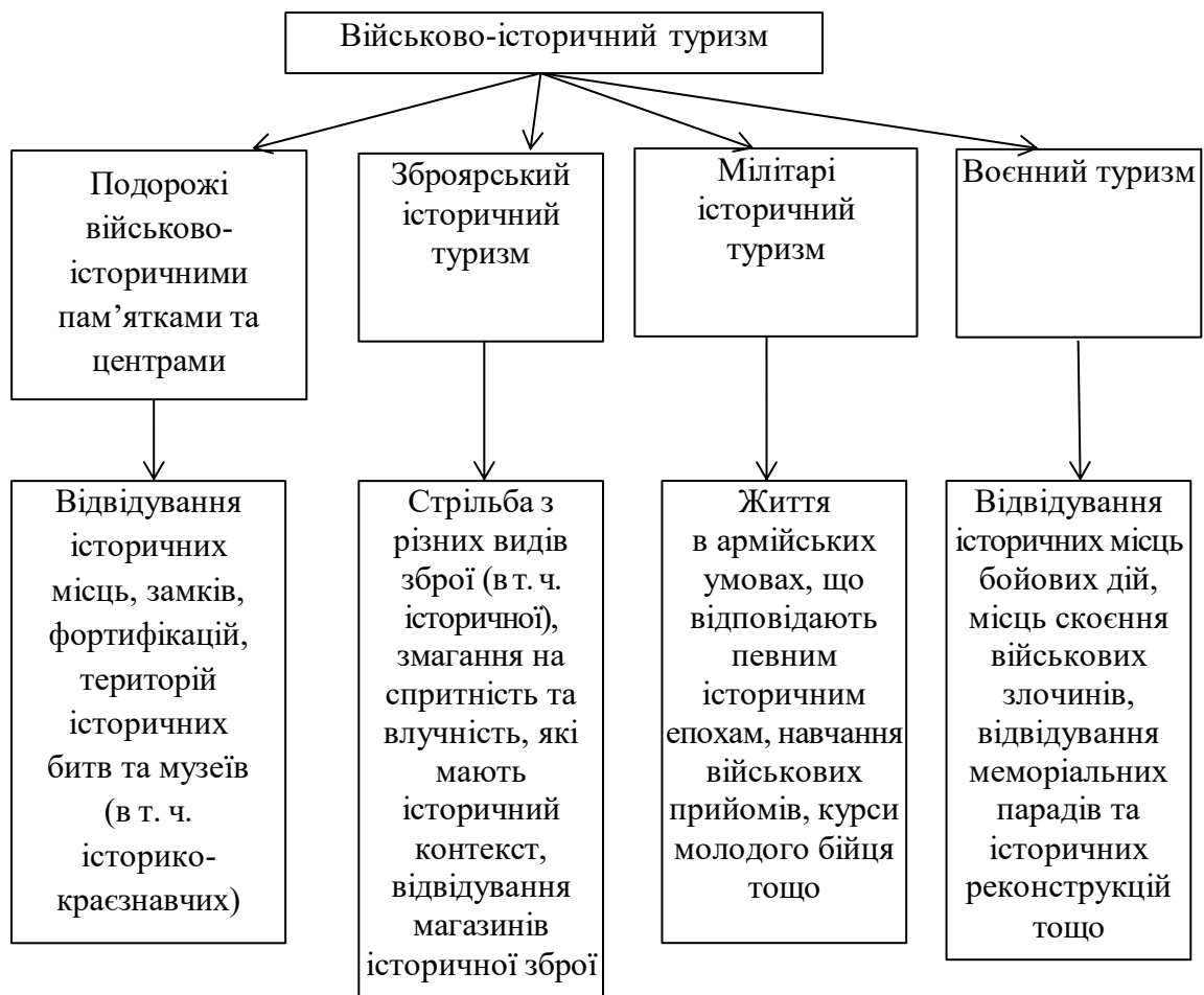
Рисунок 1.3. Підвиди воєнно-історичного туризму

Кляп та Шандор (2013) поділяють воєнно-історичний туризм на підвиди, які представлено на рис. 1.3.