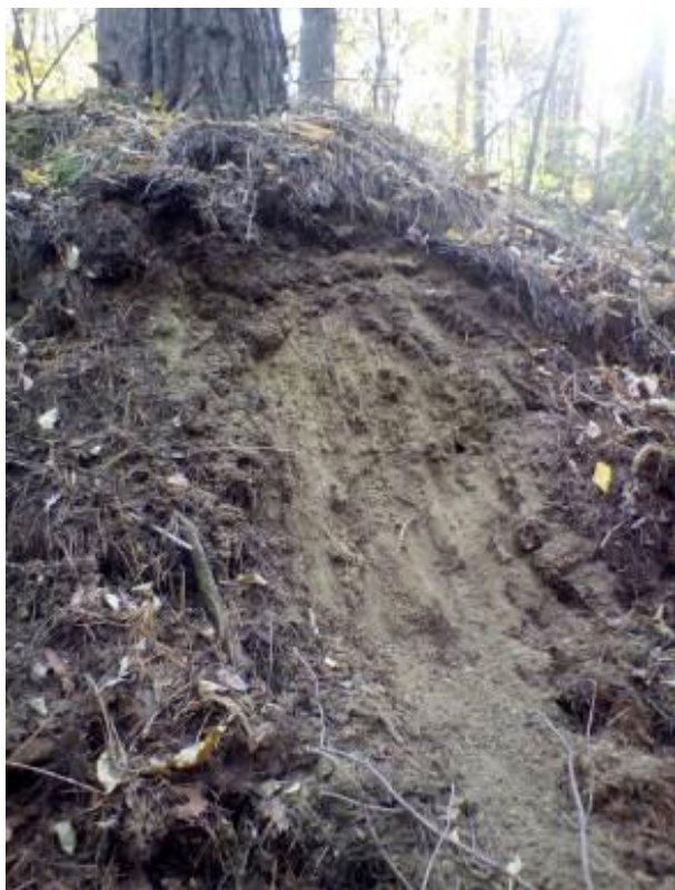
Рис. 1. Переміщений ґрунт у насадженнях буровугільного кар'єру (кв. 90, вид. 4)

не вистачає поживних речовин, що призводить до їх ослаблення, і як наслідок – всихання, яке відмічено у насадженнях старшого віку (рис. 2).