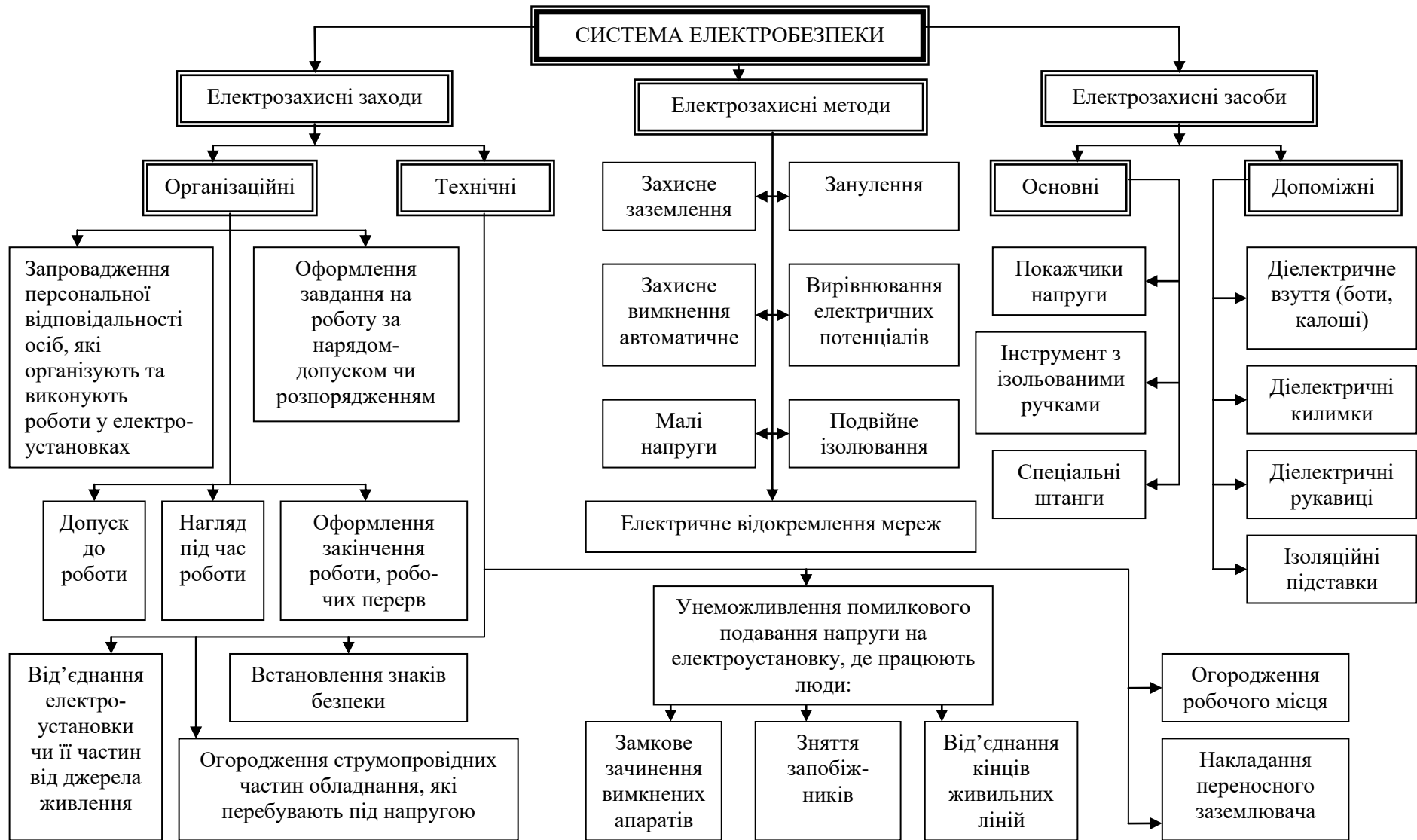
Рис. 6.2. Блок-схема системи електробезпеки