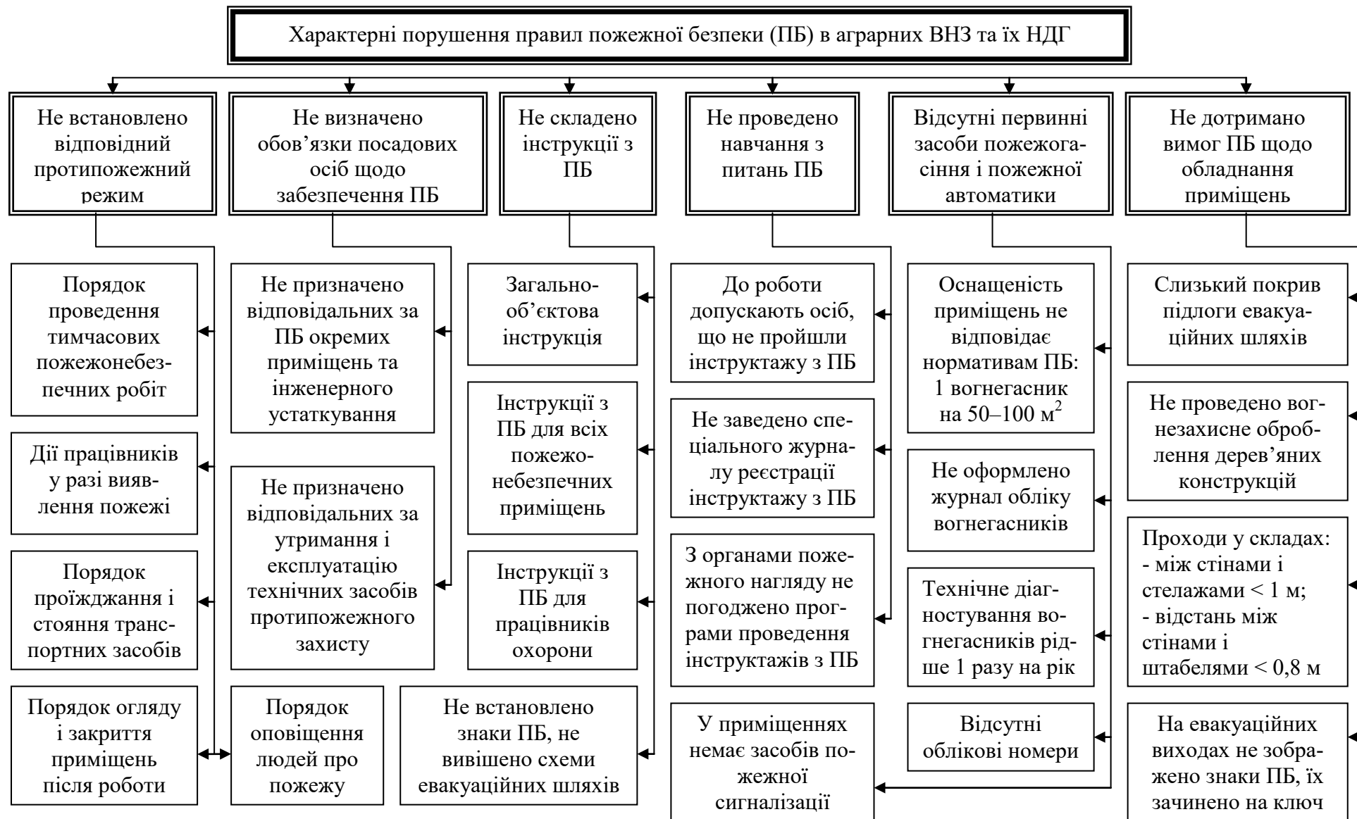
Рис. 5.1. Блок-схема основних порушень правил пожежної безпеки в аграрному ВНЗ