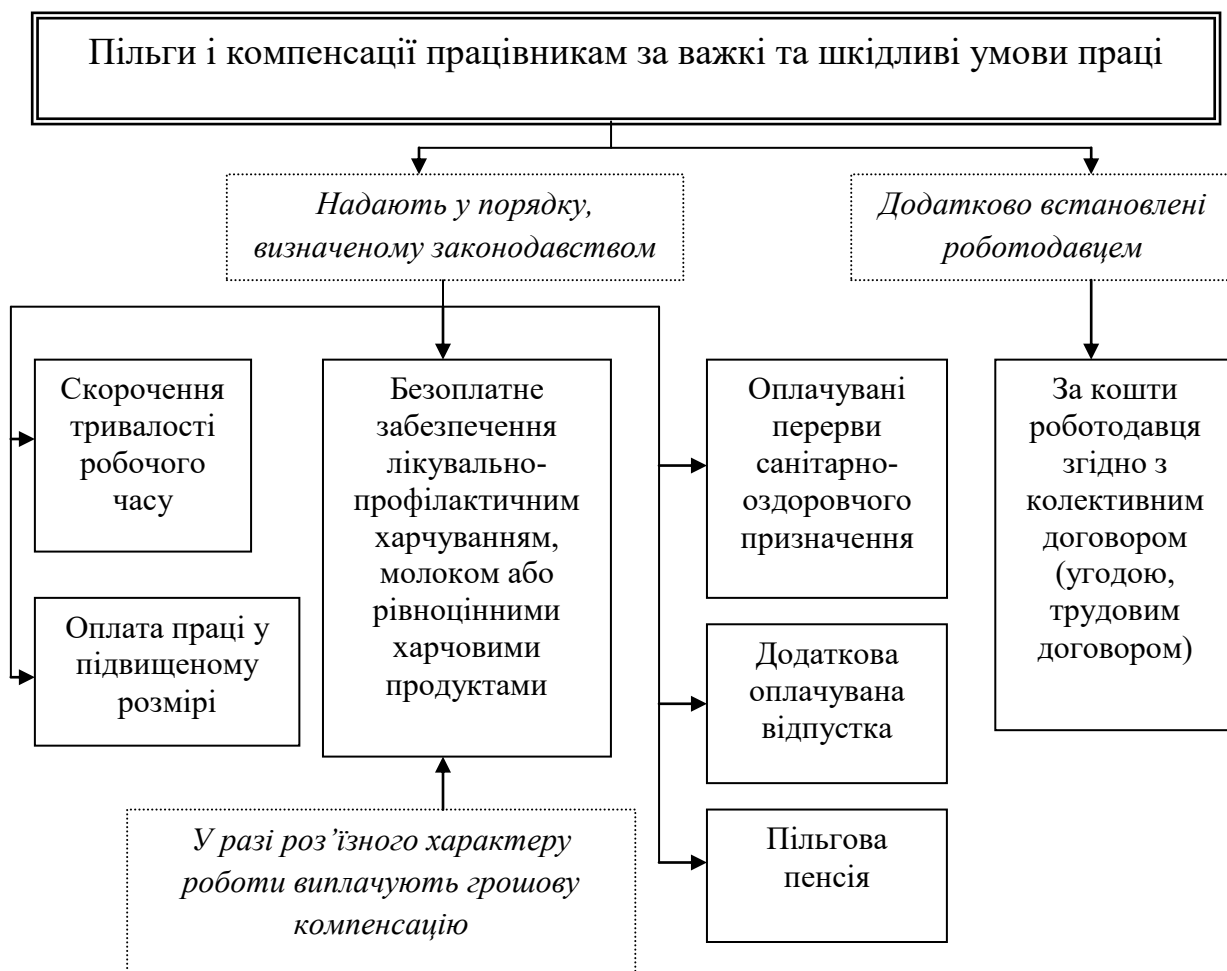
Рис. 3.1. Надання працівникам пільг і компенсації за важкі та шкідливі умови праці

У ст. 5 Закону України «Про охорону праці» вказано, що під час укладання трудового договору роботодавець повинен проінформувати працівників під підпис про умови праці та про наявність на їх робочих місцях небезпечних і шкідливих виробничих чинників, які не усунуто, можливі наслідки їх впливу на здоров'я та про права працівників на пільги і компенсації за роботу за таких умов згідно із законодавством і колективним договором. Пільги і компенсації працівникам за важкі та шкідливі умови праці представлено на рис. 3.1.