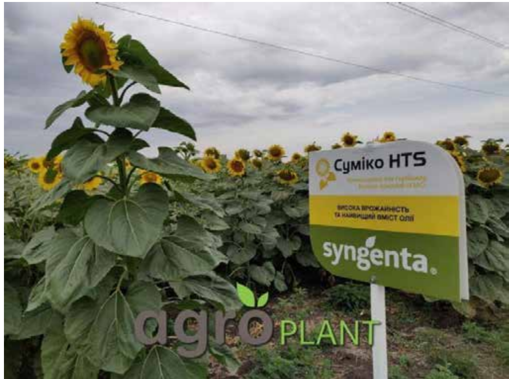
Рис.4. Гібрид соняшнику Суміко HTS