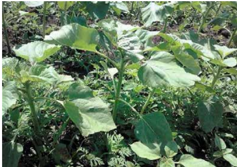
Рис.6 Амброзія полинолиста в посівах соняшнику.

Обробка недоцільна при наступних явищах: