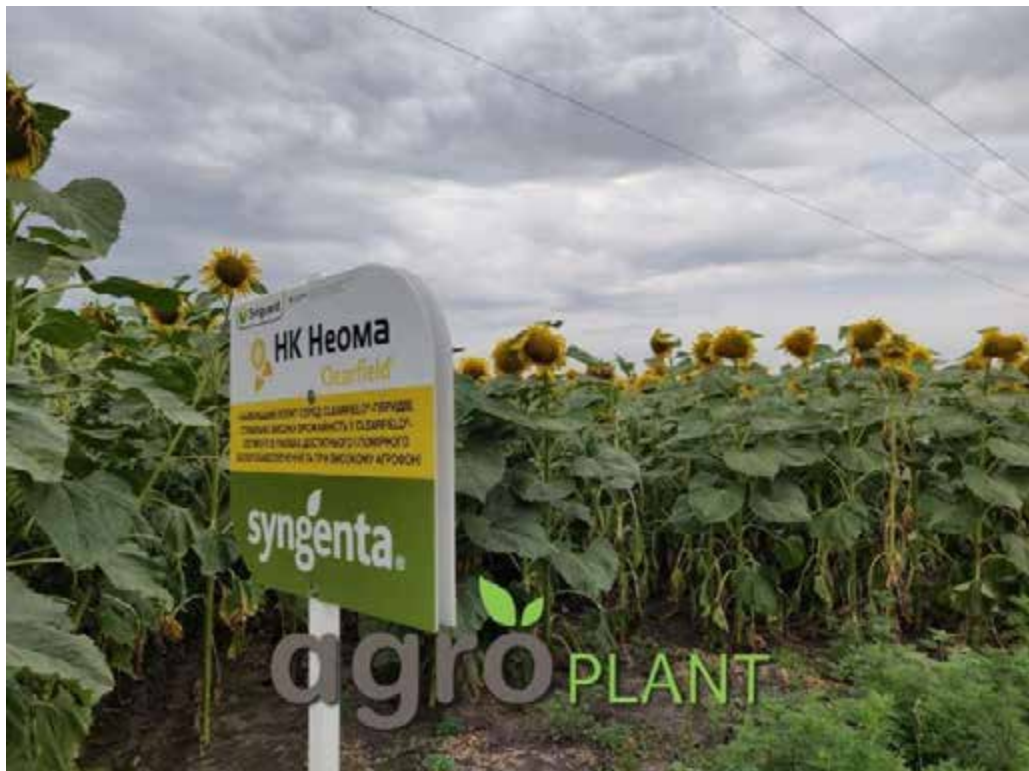
Рис. 5 Гібрид соняшника НК Неома

Гібрид інтенсивного типу з середньою енергією початкового росту і дуже високим потенціалом урожайності. Кращу віддачу забезпечує на родючих ґрунтах, добре відгукується на внесення добрив і підгодівлі. Один з найкращих і найпопулярніших гібридів для технології Clearfield® (під Євролайтинг). Посівний матеріал крім фунгіциду, додатково оброблений інсектицидом Круізер.