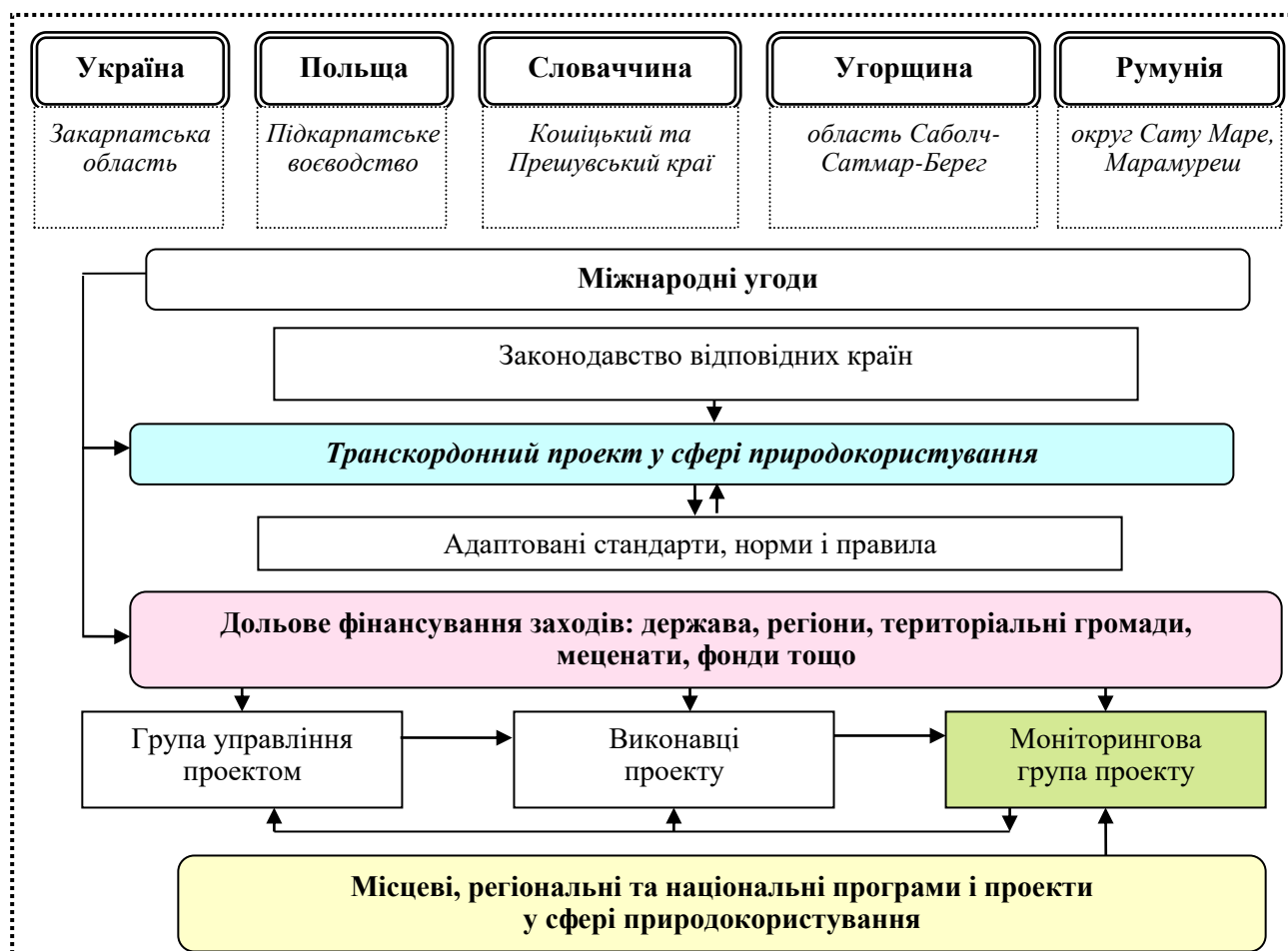
Рис. 1. Логічна модель інтегрованого управління природоохоронною діяльністю в транскордонних регіонах*

охоронних заходів і програм транскордонної співпраці та проаналізовано еколого-економічні важелі управління природокористуванням.