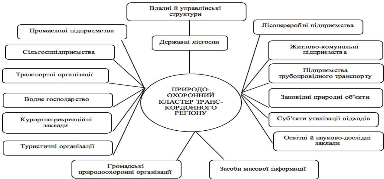
Рис. 2. Структура природоохоронного кластеру транскордонного регіону* Примітка. *Розроблено автором

транспортними організаціями, заповідні природні об'єкти та організації сфери обслуговування: курортно-рекреаційні заклади, туристичні фірми, суб'єкти утилізації відходів. До структури природоохоронного кластеру варто включити й освітні та науково-дослідні заклади, які здійснюють наукові дослідження та підготовку й перепідготовку спеціалістів з природоохоронної діяльності, управління кластерною організацією.